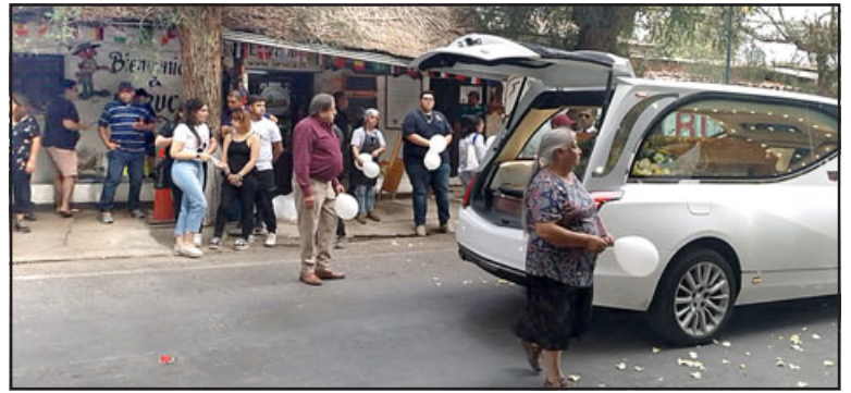
La pompa fúnebre pasando fuera del restaurante.