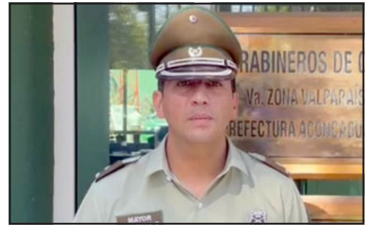
Mayor Jorge Guzmán, Comisario de Carabineros de San Felipe.

En el marco del mismo trabajo preventivo, es que personal de Carabineros de San Felipe logró la detención de un hombre que portaba elementos para cometer un delito. «Ayer (martes) mediante la fiscalización que se realizó en la Avenida Maipú, se logró la detención de un sujeto el cual portaba elementos idóneos para cometer un delito, esto es una navaja y una pistola a fuego».