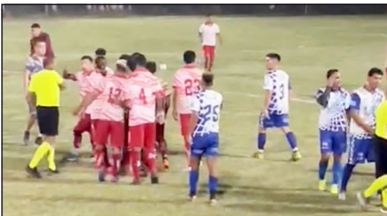
El partido entre La Troya y Reñaca Alto no llegó a su fin a raíz que los viñamarinos abandonaron la cancha.

la sanción aplicada la semana pasada por el Tribunal de Disciplina, aunque saben perfectamente que la apelación podría no fructificar, con lo que de manera definitiva quedarían fuera de la Copa de Campeones, por más que queden pasos o gestiones por hacer, pero el tiempo juega en contra para seguir escalando en busca del perdón.