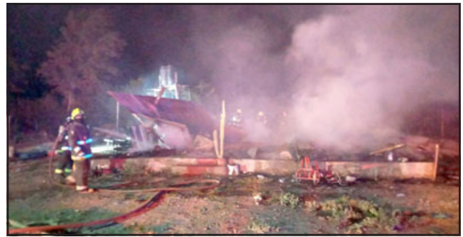
Vivienda resultó totalmente destruida a raíz de este incendio.