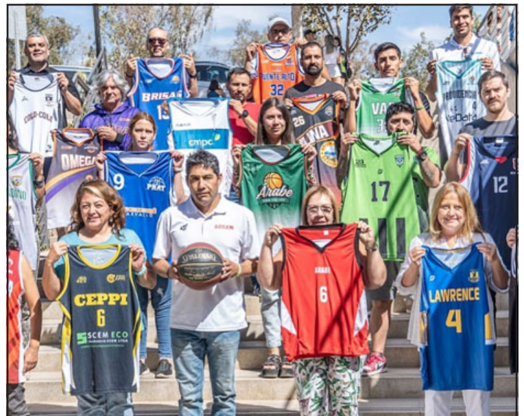
Dirigentes de los clubes que intervendrán en la Libcentro de Menores muestran las camisetas oficiales para la temporada.