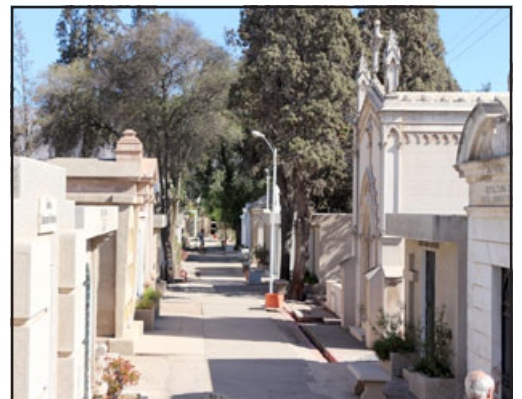
El Cementerio Municipal espera una importante asistencia de público para este largo fin de Semana Santa.

horario de invierno cierra sus puertas a las 18:30 horas, por lo cual la invitación es a que la gente concorra sin ningún problema. El Cementerio Municipal se encuentra totalmente preparado para recibir a los cientos de personas que acuden a visitar a sus deudos durante este fin de semana.