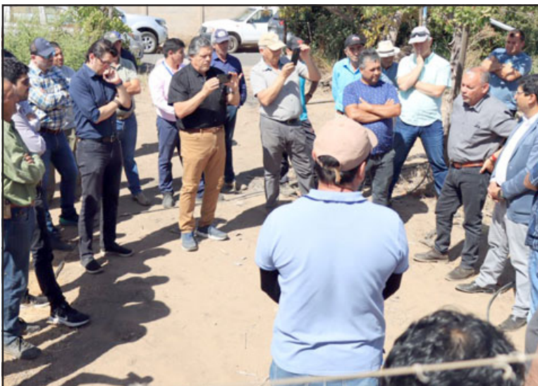
Previo a la entrega de vehículos, Mundaca visitó a agricultores, canalistas y representantes de la Junta de Vigilancia de la Primera Sección.

Al cerrar, la máxima autoridad regional subrayó la importancia de este tipo de actividades que « ratifican lo que hemos dicho siempre; queremos hacer de la Región de Valparaíso una región de derechos y con este tipo de acciones seguimos cumpliendo a la comunidad».