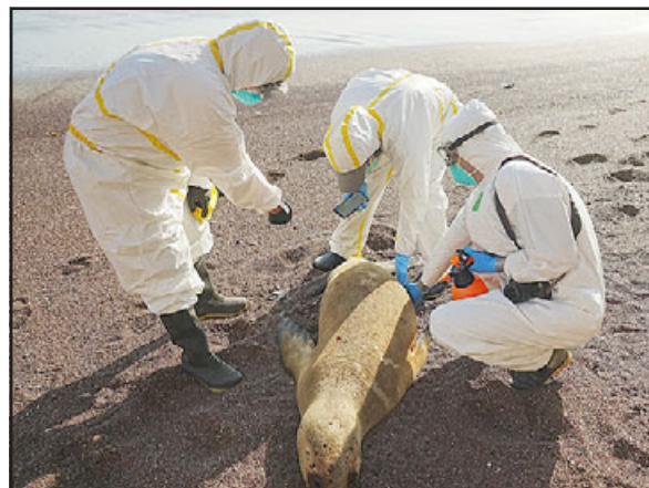
La gripe aviar se ha propagado a gran velocidad en aves y algunos mamíferos en todo el país, y ya se han registrado casos confirmados en nuestra región de Valparaíso.