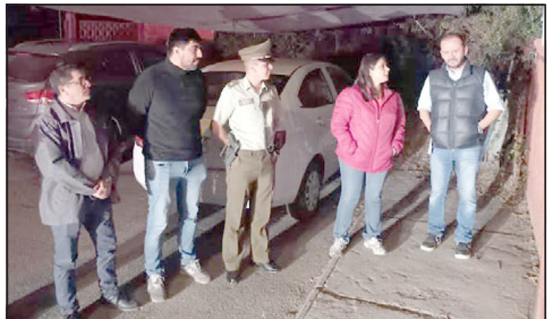
Autoridades políticas y de Carabineros realizando ronda nocturna en Catemu.

neros, pues claramente los vehículos policiales no cuentan con los equipos de salud respectivos para atender una emergencia, cualquiera sea el tipo; sin embargo, la vocación de servicio pesó mucho más en ese momento.