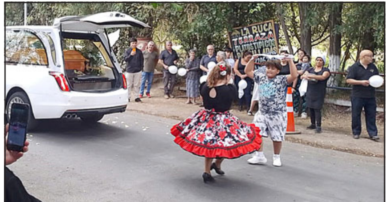
Una pareja baila un pie de cueca en homenaje y despedida.