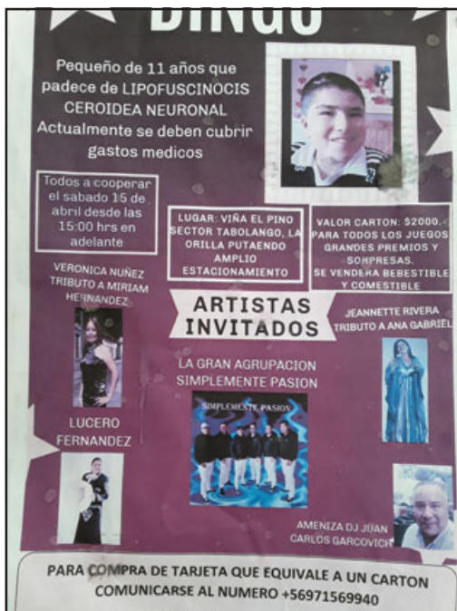
Este es el afiche promocional del bingo por Amaro.