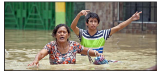
Una pareja de ciudadanos peruanos escapan a duras penas caminando con el agua más arriba de la cintura.

ría catastrófico en primavera, porque ya los árboles empiezan a brotar, hay producción, la floración, entonces podría ser de un gran perjuicio agrícola.