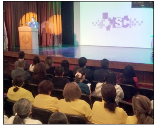
En el Teatro Municipal se llevó a cabo la cuenta pública.

Mejoras en la urgencia del recinto que se han comenzado a ejecutar con obras para mejorar los tiempos de respuesta. «Tenemos un presupuesto acotado, pero siempre tratamos de ir siendo eficientes y eligiendo las mejores inversiones que tenemos que ir haciendo. En este minuto estamos haciendo las inversiones que podemos en la urgencia, por ejemplo, en las próximas dos semanas vamos a contar con un sistema de tubo neumático que nos va a per-