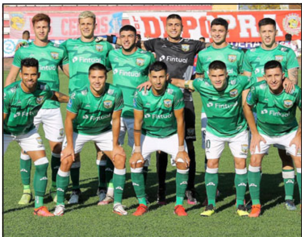
Trasandino comparte la cima de la tabla en el torneo de la Segunda División.