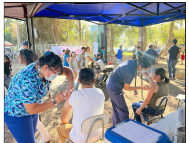
Equipos de Salud del Cesfam Segismundo Iturra realizarán operativo de vacunación en la feria de Diego de Almagro. (Archivo)

tros como Cesfam Segismundo Iturra Taito, nos vamos a encontrar este domingo en la feria de Diego de Almagro. El horario de vacunación será desde las 9:00 de la mañana hasta las 12:00 horas, vamos a contar con todas las vacunas para covid, esquemas primarios y también para re-