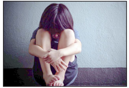
La menor de 4 años narró a su abuelita el abuso cometido por el imputado. (Imagen referencial)

- En un momento queda a solas con él, la niña da esta narración a la abuela. Hay que ser bastante prudente con las narraciones de los niños pequeños, son bastante susceptibles a la forma y el contexto en que se les pregunta, por esa razón es que le pidió un plazo