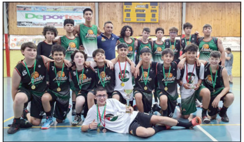
El Club Deportivo Árabe participará por primera vez en Torneo Libcentro.

También la presidenta indicó los equipos del valle que dirán presente en el torneo, además de explicar la primera participación del club en el Torneo Libcentro. « Son cuatro equipos del valle que participaremos; Club Deportivo Árabe San Felipe, Club Arturo Prat, Trasandino y San Felipe Basket. Son en total 22 equipos de la zona centro