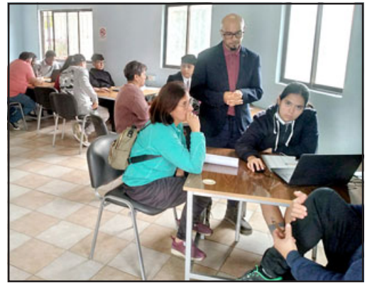
Hasta el 28 de abril, estudiantes y funcionarios del SII estarán asesorando a contribuyentes en la operación renta 2023.

«Para todas las personas que tengan pago, existe la posibilidad de pagarlo en línea o imprimir un comprobante para ir