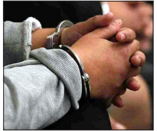
Este lunes se conocerá la sentencia para el sujeto que fue hallado culpable de violación a menor de 14 años.

coles) se desarrolló el juicio oral. Declaró la familia de la víctima, funcionarios de la Policía de Investigaciones, acompañamos también la ficha clínica de la menor. Declararon además dos funcionarias de la época, trabajaban en el PIE (Plan de Intervención Especializada) que asistían a esta niña. Ambas trabajaron con ella, no solamente a propósito de esto, sino que venían trabajando de antes porque se encontraba en riesgo social. Y luego de este embarazo la niña se acogió a la ley que permite el aborto en circunstancias como ésta y también la acompañaron en ese proceso; ambas ex-