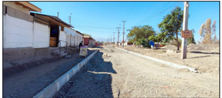
La empresa ha ido corrigiendo ciertas situaciones que generaban dificultades de distinto tipo a los residentes del sector, quienes presentaron algunas inquietudes y requerimientos.

una relación de costos y beneficios; sin embargo, creemos que la obra ha avanzado bien, los equipos técnicos están trabajando para que los vehículos puedan ingresar al sector intervenido sin ningún tipo de problema, así que hago un llamado a la locomoción colectiva para que nos apoye en este proceso y que los vecinos tengan mejor conectividad entre la Villa Juan Pablo II y el centro de San Felipe».