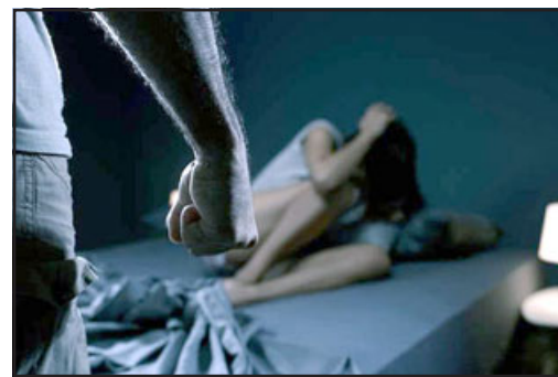
El imputado quedó en prisión preventiva al intentar dañar a su ex pareja. (Referencial)

- Fiscal, hubo un procedimiento por Femicidio Frustrado en Putaendo durante este fin de semana, ¿qué se puede decir a la opinión pública?