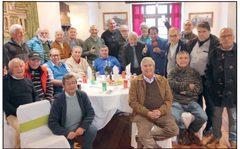
En la foto de archivo, egresados en 1971 del Liceo de Hombres de San Felipe, quienes se reencontraron en mayo del año pasado en el Club San Felipe.

dial saludo en este tiempo en que la comunidad liceana se apresta a conmemorar sus 185 años de vida, y reciban también una cordial invitación a participar de una reunión ampliada fijada para el día martes 25 de abril a las 18,00 hrs. en dependencias del Liceo.