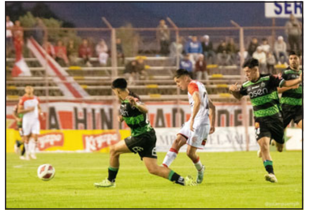
Los sanfelipeños aún no convencen en el actual torneo.