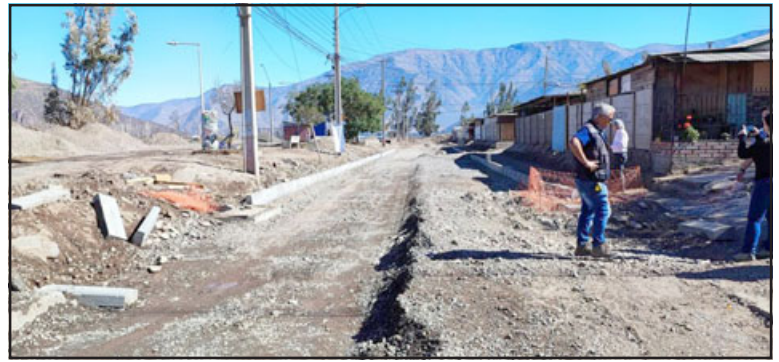
Los trabajos presentan cerca de un 44% de avance y se encuentran dentro de los plazos estipulados en contrato.