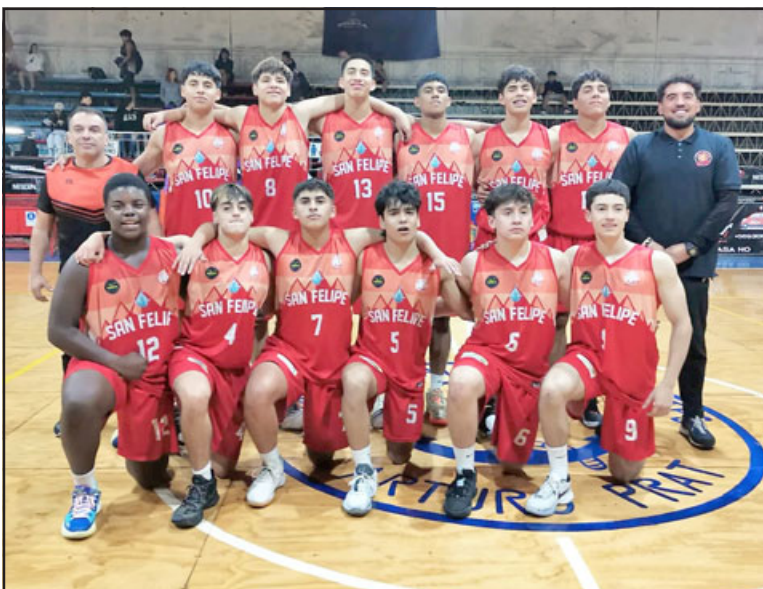
Conjunto U-17 de San Felipe Basket.

El pasado fin de semana, los tres clubes sanfelipeños que intervienen en la Libcentro Menores, vivieron experiencias disímiles en la principal competencia formativa cestera de la zona central del país.