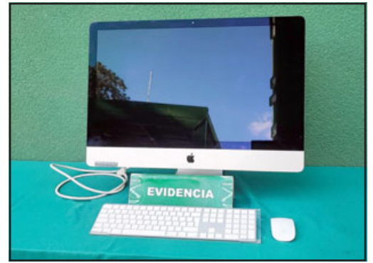
Este es el computador recuperado por personal de la SIP, un Apple IMac avaluado en tres millones de pesos.

se encuentran en el centro histórico de nuestra ciudad. No obstante los servicios policiales que se están realizando con la finalidad de poder evitar, a modo de ejemplo solamente la semana pasada tuvimos cinco detenidos por este tipo de delitos y el cual, al tener una pena baja, los sujetos quedan en libertad posteriormente. No obstante a ello, Carabineros va a seguir trabajando de manera incansable con respecto a poder generar el máximo de medidas de seguridad, como asimismo poder instruir a la gente que