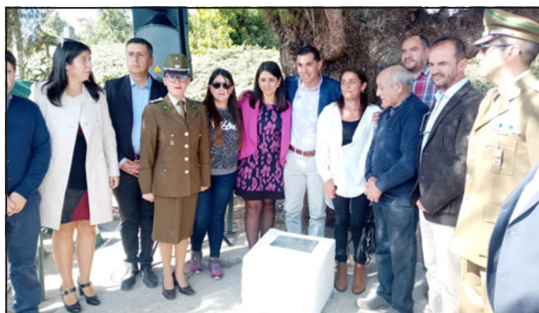
En la jornada estuvieron presentes autoridades de la comuna de Panquehue, Catemu y San Felipe.