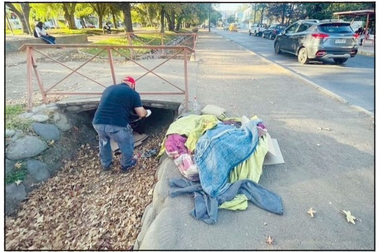
Personal municipal eliminó rucos en las alamedas.

«El patrullaje preventivo se construye a partir de datos de vecinos y Carabineros, se coteja la información y se planifican los patrullajes, este sistema se focaliza en barrios definidos con una focalización en el sector centro para de cierta forma dar un ordenamiento a la ciu-