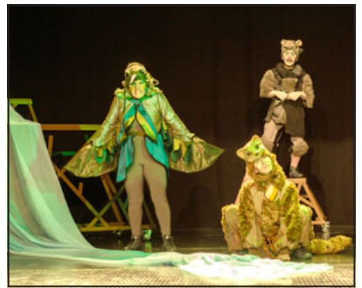
La obra es un montaje de la compañía 'La Washa', la cual nace en Valparaíso en 2012.

La obra es un montaje de la compañía 'La Washa', la cual nace en Valparaíso en 2012. Actual-