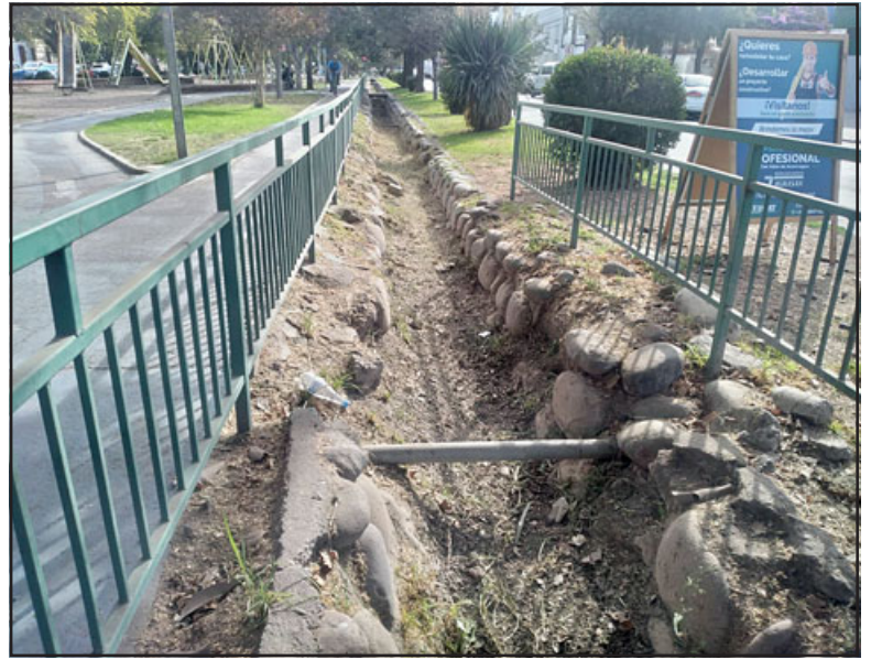
Municipio ha limpiado canales y colectores de aguas lluvias.

do en una primera etapa un trabajo de abordar en la calle Pedro de Valdivia, ya mañana vamos a realizar una visita a terreno para identificar los puntos críticos a raíz de los trabajos, por eso vamos a reunirnos con la empresa con el objeto que no se entorpezca la movilidad de los vecinos y vecinas», agregó.