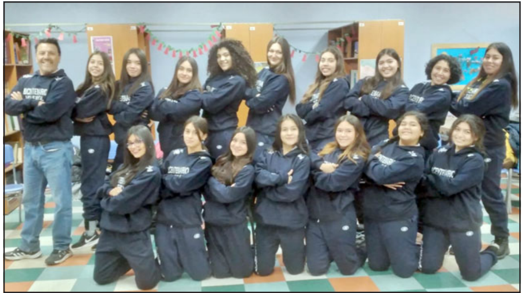
Ellas son las jugadoras que buscarán dejar a San Felipe en lo más alto del podio en Punta Arenas.

En este mismo contexto, Chávez destacó que en esta oportunidad «vamos con la categoría sub 15 y sub 17 y las expectativas deportivas como siempre es estar ubicados lo mejor posible, pero fundamentalmente estamos en un proceso de preparación, estamos ad portas de jugar la etapa comunal de los juegos escolares, para nosotros nuestra primera prioridad es la competencia escolar y este