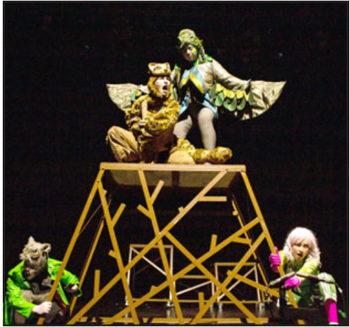
Actualmente la compañía cuenta con un variado repertorio de obras para distintos públicos.

El Área de Vinculación con el Medio y Extensión de la Universidad de Valparaíso, Campus San Felipe, gestionó la presentación de la obra de teatro 'Caudal, por la liberación de las aguas', de forma totalmente gratuita para la comunidad del valle de Aconcagua.