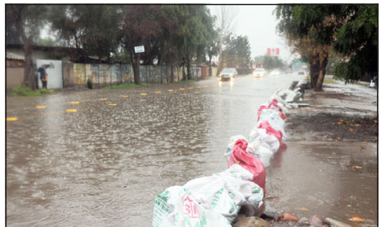
Unos 25 milímetros de lluvia como mínimo se espera caigan este fin de semana, lo que puede generar graves problemas. (Foto archivo).

Para Fernández, las cifras de agua caída que podrían registrarse son importantes para el mes de abril. «En un año normal, la estación de Quinta Normal, que es la que nos entrega mayores datos para la zona centro, marca alrededor de los 28,8 milímetros.