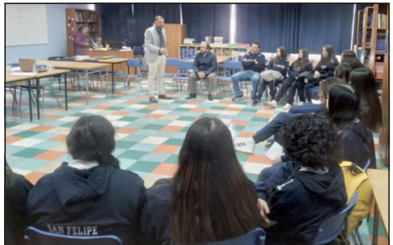
Delegación fue despedida por profesores y familiares.

«Dentro de los esfuerzos califica esto, un viaje de una semana, vamos a entrenar en Punta Arenas, vamos a jugar con equipos mayores, vamos a jugar con equipos argentinos, es todo positivo, el apoyo del colegio, de los apoderados, de las autoridades, una vez más estamos poniendo el nombre del Liceo Bicentenario lo más alto posible», añadió.