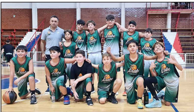
El team U13 del Árabe debutó en la Libcentro con una goleada.