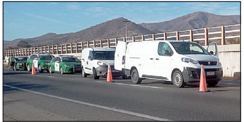
Estos fueron los vehículos asaltados.

En este mismo sentido, el Comisario de Carabineros de San Felipe señaló que «hasta el momento se encuentran realizando diligencias personal de Santiago puesto que los vehículos fueron encontrados en el sector territorial de la Subcomisaría de Llay Llay, no se mantienen mayores antecedentes del paradero de los antisociales, no obs-