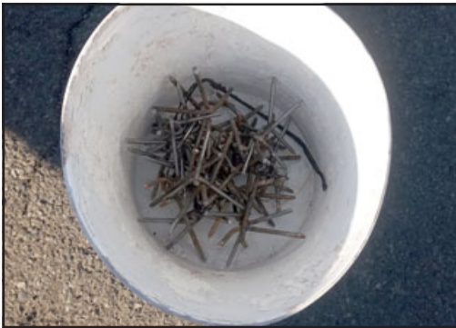
Delincuentes arrojaron 'miguelitos' al camino.

El robo se registró a eso de las 7:20 de la mañana y movilizó a gran parte de los Carabineros de la Subcomisaría de Llay Llay.