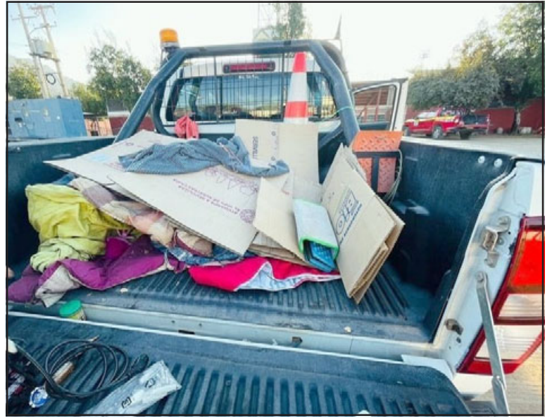
Parte de los elementos retirados por personal municipal.