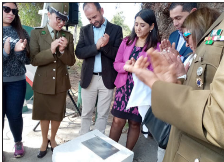
La ceremonia se realizó en el km. 13 de la ruta 60 CH, sector 'El Mirador' de Panquehue.