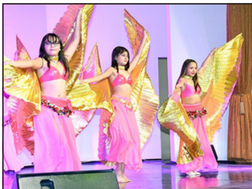
Cada 29 de abril los elencos se organizan para ofrecer lo mejor de sus coreografías y colores.

llets». zón y del alma... No puedo más que agradecer al alcalde esta oportunidad y a todos los que organizaron y trabajaron en esto, y por supuesto a los ballets».