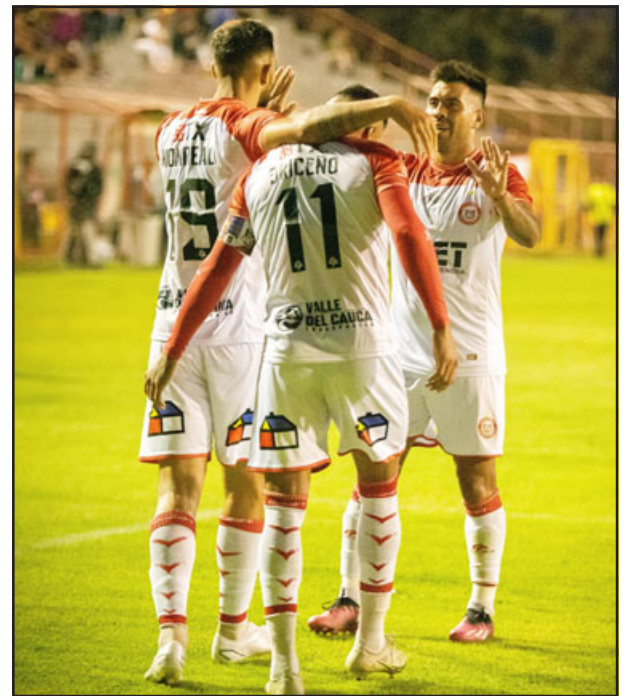
Si los albirrojos se imponen a La Serena, empezarán a meter presión al grupo de arriba.