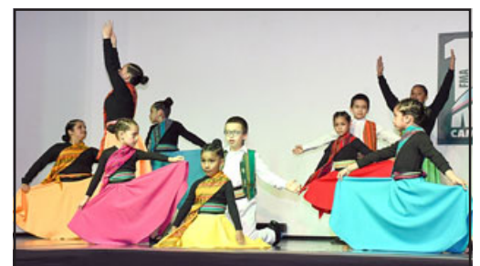
Son distintos elencos, de todas las edades, y con presentaciones para todos los gustos.