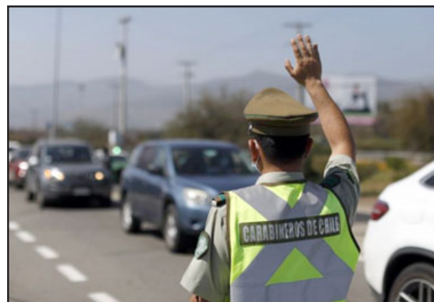
Personal de Carabineros efectuaba un control vehicular cuando el conductor del móvil intentó atropellar a uno de los funcionarios. (Imagen referencial)

Respecto de lo incautado en el vehículo, el mayor