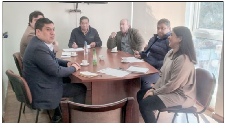
Delegación Provincial, Seremi de Transportes y Telecomunicaciones y directivos de las empresas, en reunión de coordinación para las elecciones del domingo.

Asimismo, el Seremi destacó que «eso nos permitirá absorber la demanda importante de personas que se trasladarán de locales a sus domicilios, para que podamos tener un tránsito