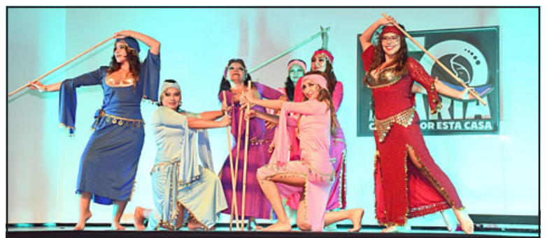
Los Andes celebró en grande el Día Internacional de la Danza.