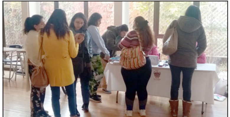
Los emprendedores también tuvieron la opción de inocularse con la vacuna contra la Influenza y Covid.

co expresó que «en particular, los permisos sanitarios, sobretodo dependiendo del rubro en el cual el emprendedor se está enmarcando, es muy relevante de que pueda revisarlo y sobretodo hacer las consultas previas antes, ya que no vaya a pasar que compre algo, después lo quiera intercalar y ocupar para su factura; recuerden bien que evidentemente esto tiene que tributar a través del Servicio de Impuestos Internos. Por otra parte, para nosotros fue fundamental como Centro de Negocios otorgar una nueva capacitación, para que los emprendedores sigan las redes sociales de Sercotec Aconcagua, donde tenemos este tipo de actividades en conjunto con la Promoción de Salud de San