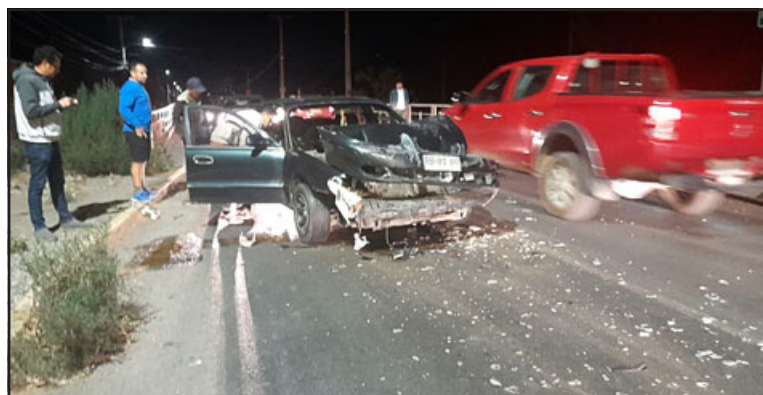
Irresponsable conductor chocó de frente a otro vehículo en el sector del Puente Encón.