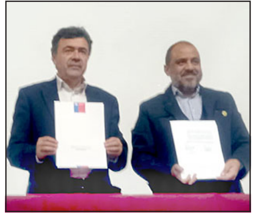
Los ministros de Educación, Marco Ávila, y de Agricultura, Esteban Valenzuela, en la firma del convenio.

«Hoy nos sentimos orgullosos y felices de ser el escenario que recibe a ambos ministros, trabajando por el fortale-