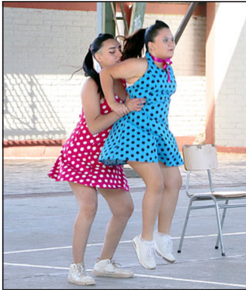
Integrantes del taller realizaron una demostración en la multicancha del Liceo Bicentenario Colegio Panquehue ayer martes 2 de mayo.

memoró el Día Internacional de la Danza, algunos integrantes realizaron una demostración en la multicancha del liceo panquehuino el martes 2 de mayo.