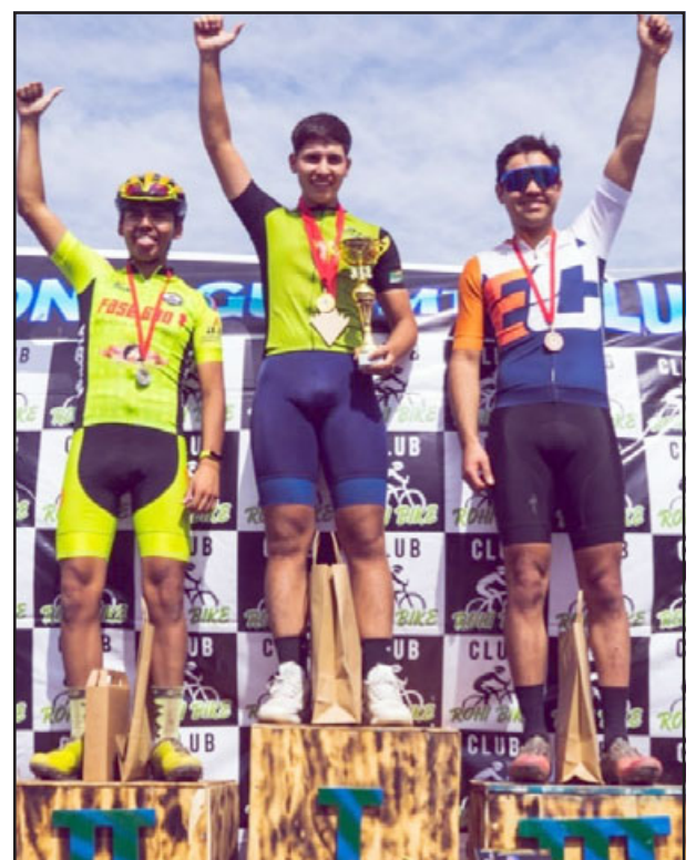
Parte de los ganadores en las distintas categorías del evento.