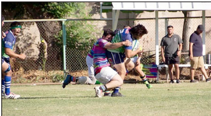
Los Halcones consiguieron su sexto triunfo consecutivo en la Arusa.

el equipo aconcağıino sigue en lo más alto de su división de la liga Arusa, convirtiéndose con propiedad, en candidato para quedarse con el título de su categoría.