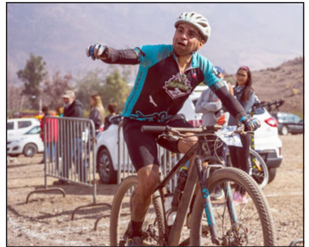
Los deportistas dieron lo mejor de sí para estar en lo más alto del podio.