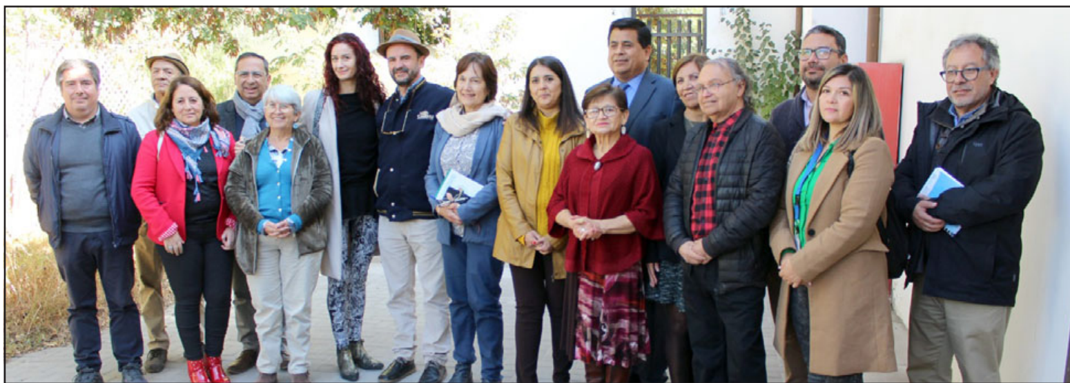
Alcaldes de las seis comunas, directivos de las universidades UPLA y UV, la Seremi de Las Culturas, Las Artes y El Patrimonio, entre otras autoridades, planean actividades de conmemoración.

de las expresiones más atroces de la dictadura, que fue el asesinato, la prisión, la tortura y el exilio. Y en esa perspectiva, nos sumaremos junto con los alcaldes y alcaldesas, para que esta conmemoración no sea un aniversario más, sino que sea el punto de inflexión que nos permita fortalecer la democracia, pero fundamentalmente, decirles a las nuevas generaciones que no tuvieron ese espacio-tiempo, la importancia y la trascendencia que tiene cuidar la democracia y proyectar nuestro país hacia el futuro», cerró.