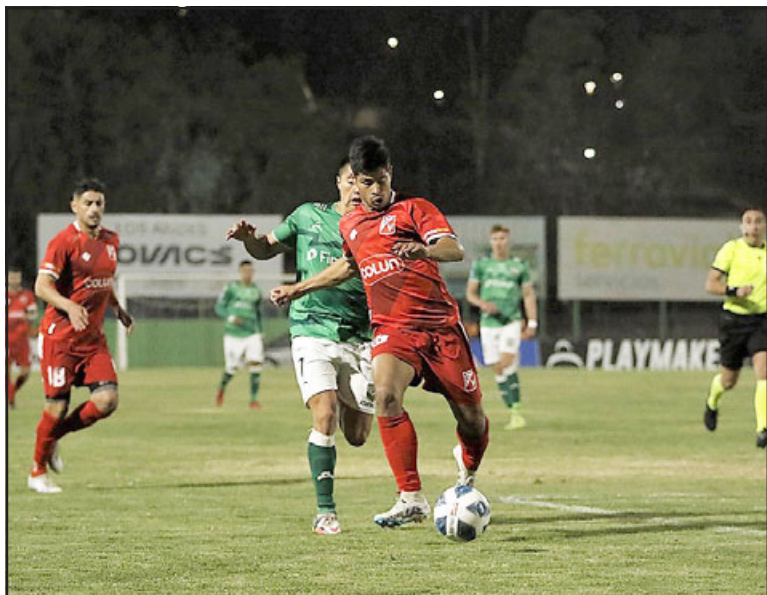
El conjunto del 'Calle Calle' fue un problema sin solución para los andinos.