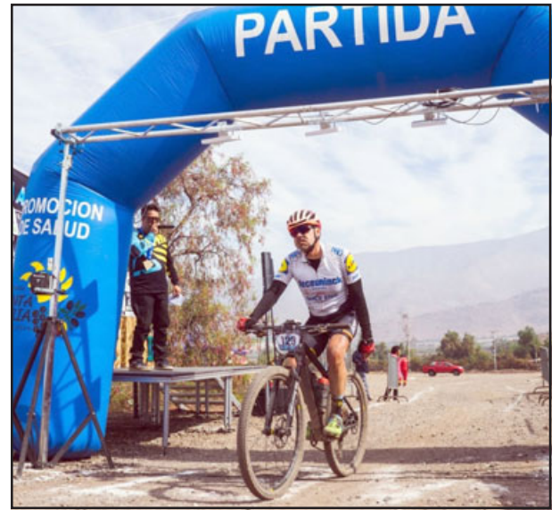
Momento en el que comienza la carrera.

Segunda jornada que se llevará a cabo en la comuna de Putaendo el próximo 24 de junio y que promete ser del más alto nivel en nuestro valle del Aconcagua, con grandes exponentes de este deporte que le dan vida a uno de los eventos de 'ciclismo de aventura' más relevantes de la región y el país.