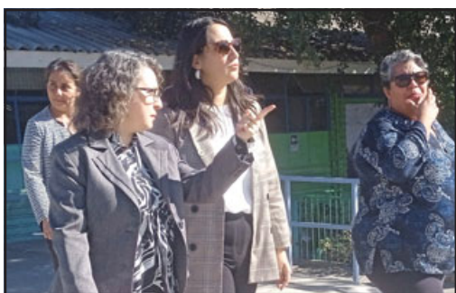
La Seremi de Educación visitó el Liceo San Felipe y la Escuela José de San Martín.

Concluyó señalando que «la calidad de la educación que le podemos dar a nuestros estudiantes también pasa por la infraestructura y en eso estamos buscando el apoyo a nivel regional».