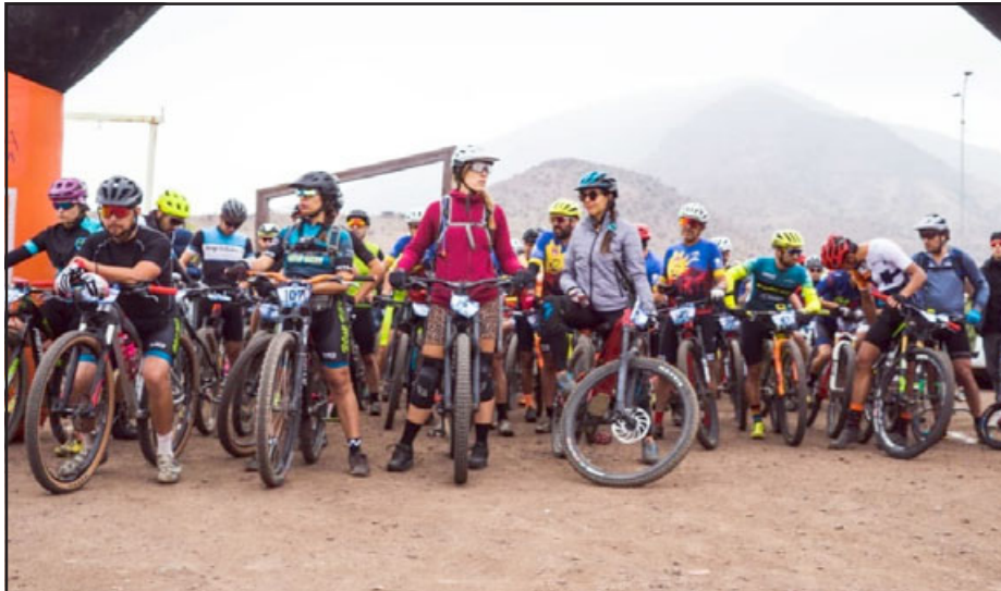
Los participantes a segundos de competir.