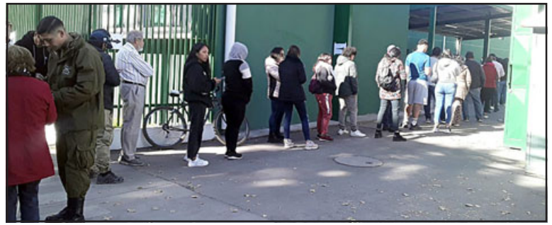
Cientos de personas haciendo fila en Carabineros para dejar constancia de no poder ir a sufragar.

Las calles adyacentes a los locales estaban habilitadas, ya que no hubo esos cortes tradicionales por parte de Carabineros. Por ello los vehículos con personas que presentaban algún tipo de discapacidad, llegaban hasta el frontis de los locales sin mayores problemas. Miembros del Ejército de Chile estuvieron a cargo de custodiar los distintos establecimientos educativos usados para este proceso.