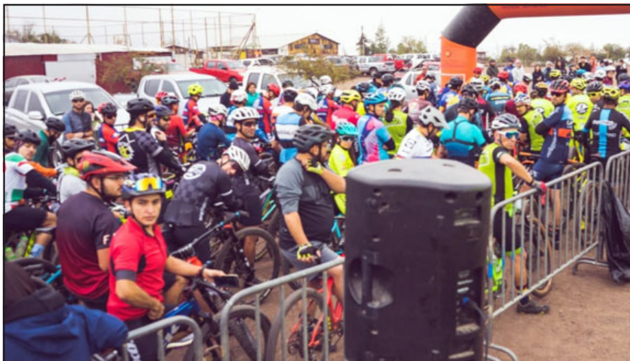
Carrera reúne a cientos de ciclistas.