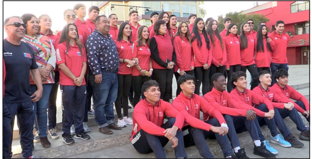
Delegación deportiva sanfelipeña emprendió rumbo a Valparaíso este domingo, para disputar los 'Juegos Binacionales de Integración Andina Cristo Redentor'.