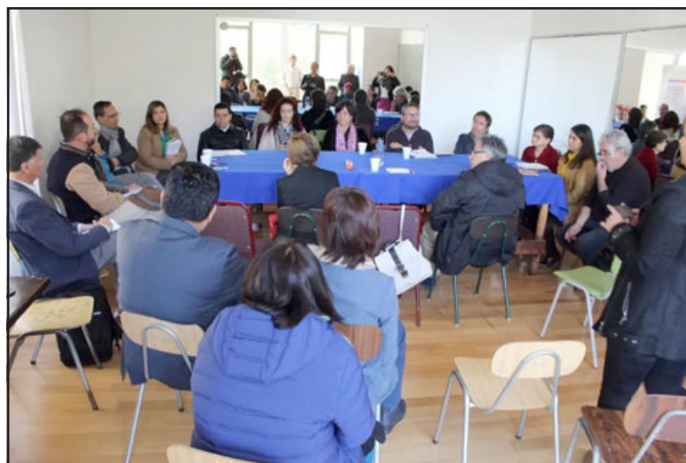
Este miércoles se conformó la primera mesa provincial en conmemoración de los 50 años del Golpe Militar.