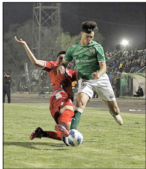
Trasandino nuevamente decepcionó a su hinchada al empatar en casa.

La quinta igualdad seguida de los andinos, fue completamente ajustada a lo que sucedió en el terreno de juego, ya que en el global, ambas escuadras dispusieron de oportunidades para marcar, cosa que no ocurrió gracias a la inoperancia de los de-