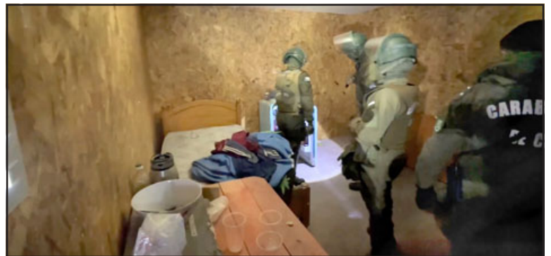
Carabineros en el interior de la mediagua, la cual se encontraba sin moradores en ese minuto, no obstante se aprecian pertenencias como un pequeño refrigerador o frigobar.

Cabe hacer presente que este es el segundo desalojo que se realiza en San Felipe, la semana pasada se llevó a cabo el mismo trabajo en el sector de Los Molles. En ambos casos, la oportuna denuncia de vecinos ha sido clave para evitar estos delitos.