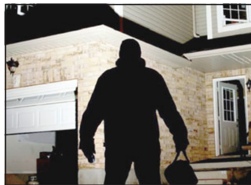
El delito de robo en lugar habitado ha registrado una leve alza en la zona. (Imagen referencial)

Junto con esto, el mayor Jorge Guzmán precisó que «otro delito que se analizó fue el robo de accesorios de y desde el interior del vehículo, lamentablemente por las características de este delito requiere muy poco tiempo, el llamado es a no dejar especies a la vista».