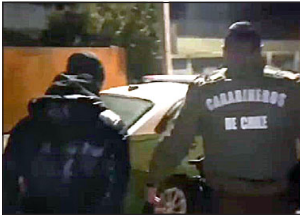
El sujeto fue detenido por personal de Carabineros del OS7 de Aconcagua.