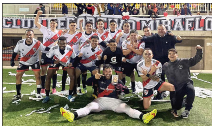
Miraflores chocará contra el 'gigante' Glorias Navales.