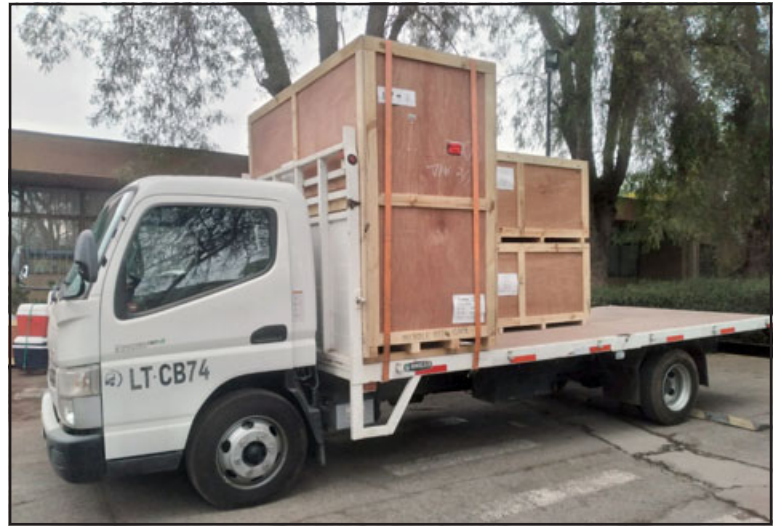
Nuevo scanner ya arribó al Hospital San Camilo.

En este mismo contexto, el profesional agregó que «las características diferentes es que el anterior era de 16 cortes, este es de 80, nos va a permitir hacer escáner mucho más rápido», viene con una tecnología nueva