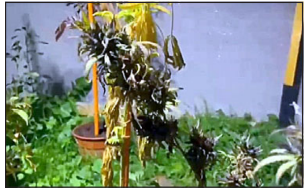
Personal del OS7 de Carabineros de Aconcagua logró sacar de circulación una importante cantidad de drogas.