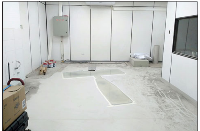
Este es el lugar donde estará emplazado el nuevo scanner del Hospital San Camilo.

El nuevo escáner del Hospital San Camilo fue descargado durante la jornada del día miércoles, y los equipos respectivos comenzaron con el trabajo de instalación para en el mes de junio, éste ya se encuentre totalmente operativo.