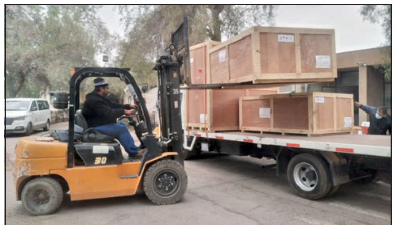
Trabajadores descargando el nuevo scanner.