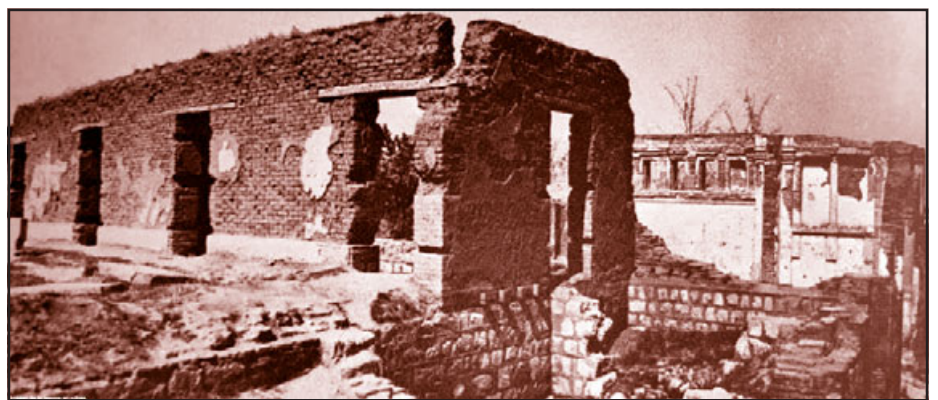
Esta es la casona de 'La Quintrala', lugar donde se han encontrado restos arqueológicos que actualmente se exhiben en el museo de Los Andes.

mana convoca a escuchar a quien estuvo a cargo de la investigación histórica de la Casona Huechuraba, hacienda que perteneció a Catalina de los Ríos y Lisperguer y posteriormente a la familia Carrera. La charla lleva por título 'La Historia del Fundo el Guanaco', como pasara a llamarse el lugar hacia el s. XVIII.