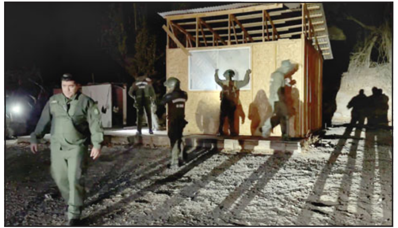
Esta es la mediagua levantada en el terreno fiscal, sobre un sólido radier de cemento.