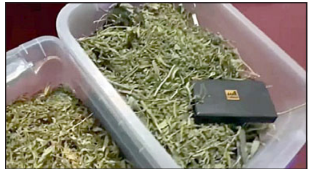
Marihuana en proceso para su venta.