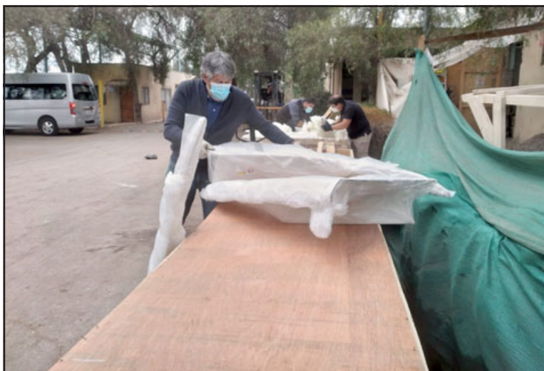
Proceso de revisión de las piezas del nuevo equipo médico.