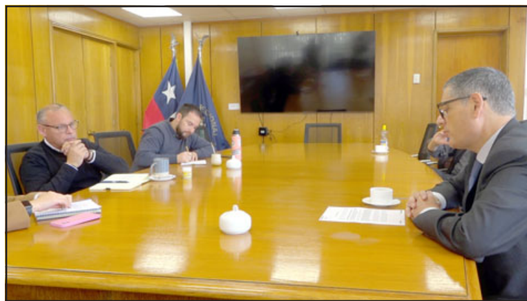
El Director del Sernac se reunió con el gobernador Mundaca para informar la demanda colectiva en contra de Esvál.

Respecto a la problemática, el gobernador Rodrigo Mundaca señaló que estas irregularidades de Esvál ponen en cuestionamiento la labor que está realizando la Superintendencia de Servicios Sanitarios (SISS); «afortunadamente tenemos un Servicio Nacional del Consumidor que está haciendo la pega (...) lo que señala esta demanda colectiva es que las personas no han sido suficientemente compensadas a propósito de cortes no programados en-