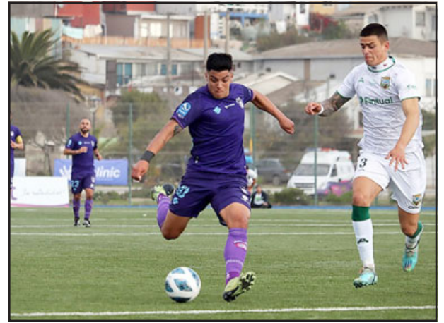
Trasandino sufrió una derrota dolorosa y dramática frente a San Antonio Unido.