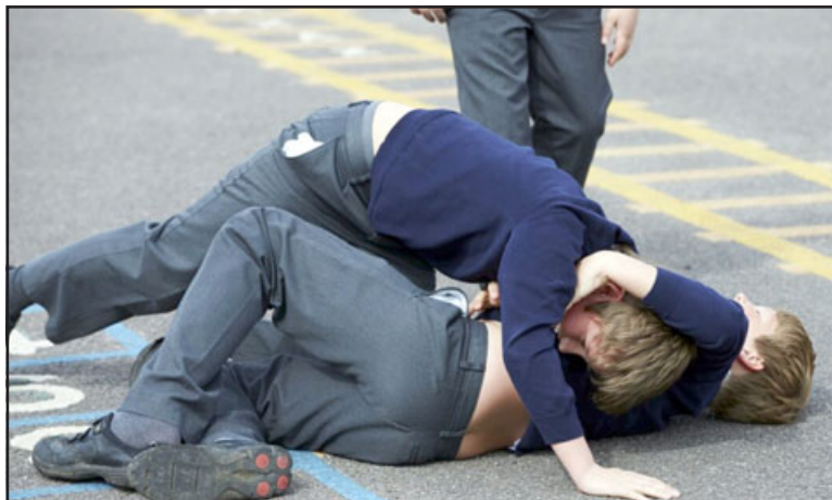
Una brutal pelea de estudiantes se registró en Avenida Miraflores con Hermanos Carrera Oriente en San Felipe. (Imagen referencial)