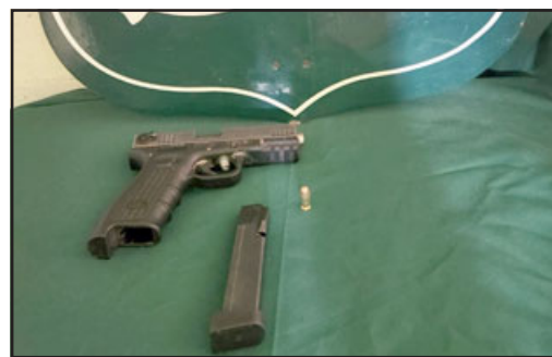
Esta es el arma con la que fue descubierto el menor de 16 años.

desciende de su vehículo particular y se identifica como carabiniere, mostrando su placa de servicio. Ante esto, el joven emprende la huida en dirección al sector de la población Tres Carreras, arrojando dicho armamento a la vía pública, donde se logra la detención de este menor», sostuvo.