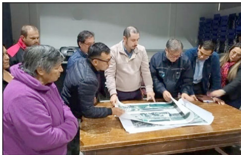
Seremi del MOP dio a conocer proyecto de mejoramiento vial en la ruta Troncal 601.

Asimismo, Riquelme destacó que «vinimos a presentar el proyecto, estamos viendo los fondos para poder ejecutarlo pronto. Considera algunas cosas básicas que es el control de velocidad, no nos hemos metido en otros temas para no complejizar más y el