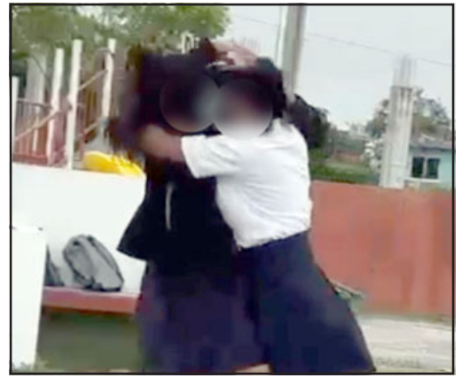
Niñas de 14 a 16 años se vieron involucradas en la riña que despierta aún más preocupación considerando el alto grado de agresividad. (Imagen referencial)

Es por esto que desde Carabineros ya se está trabajando en elaborar campañas educativas destina-