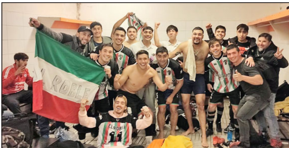
En la intimidad del camarín los integrantes de 'El Roble' continuaron la celebración.