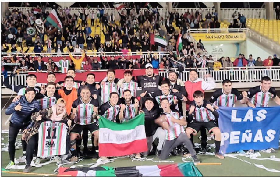
FUERTE COMO ROBLE.- El equipo perteneciente a la Asociación Rural Llay Llay festeja el paso a la final junto a su fiel hinchada.-

dades, siendo superado por San Antonio, Lautaro y Limache, que respectivamente acumulan 19, 20 y 26 puntos.