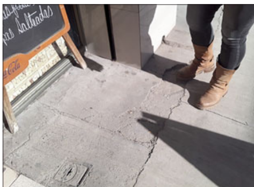
Estas fueron las terminaciones que hicieron. Impresionante.