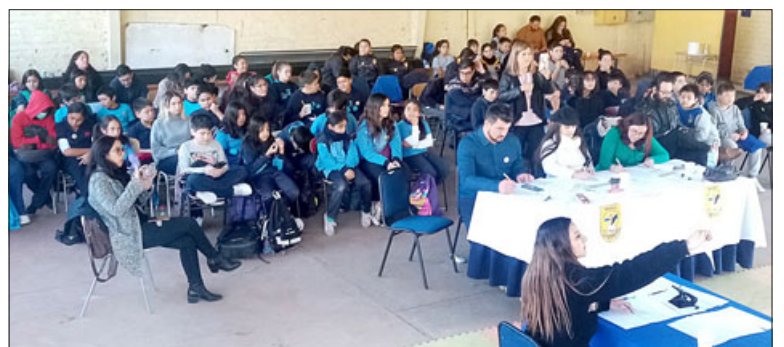
La actividad tuvo un gran marco de estudiantes que participaron del 'Spelling Bee', zona rural.