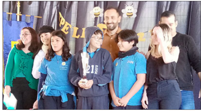
'Escuela 21 de Mayo', primer lugar en categoría 'Sextos Básicos'.

«Un nivel buenísimo, excelente, a pesar de que no habíamos tenido actividades y que a los niños al principio les pregunté quiénes ha-