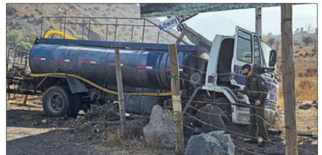
A un costado del camino terminó uno de los involucrados en el accidente, un camión cisterna cuyo conductor resultó ileso.

Te invitamos a seguir estas recomendaciones para prevenir eventuales contagios del COVID-19