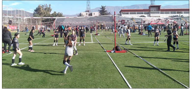
En toda la cancha se habilitaron espacios para jugar voleibol.