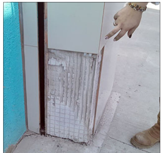
Le sacaron un porcelanato que no repusieron.