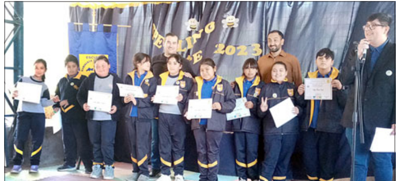
'Escuela Heriberto Bermúdez Cruz', primeros en categoría 'Quintos Básicos'.