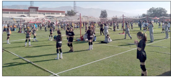
Momento del calentamiento de las delegaciones deportivas.

El encuentro deportivo congregó a cientos de niñas y niños que se dieron cita en torno al voleibol en el Estadio Municipal de San Felipe.