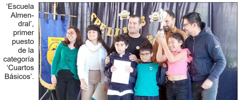
'Escuela Almendral', primer puesto de la categoría 'Cuartos Básicos'.

bían participado en un deletreo y nadie, ninguna escuela, de las ocho escuelas que estuvieron acá presentes, nunca habían participado en un deletreo y el nivel está bueno. Ahora, obviamente comparado con escuelas urbanas o escuelas de ciudades grandes, tendríamos que ponernos a ese nivel, ver cómo andamos, pero en esta oportunidad considero que los