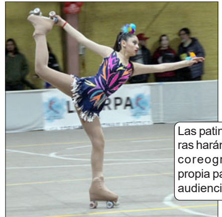
Las patinadoras harán una coreografía propia para la audiencia.