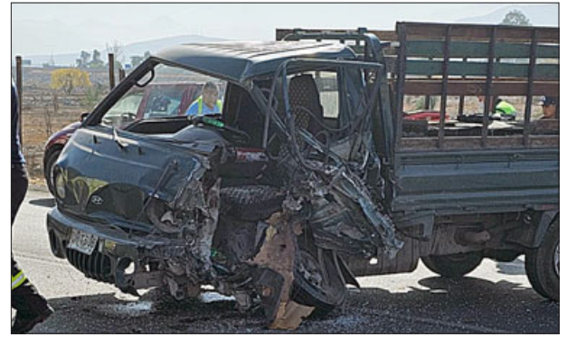
Así quedó la camioneta tres cuartos tras recibir el fuerte el impacto por parte de un camión.

«Cuando llegó la unidad de rescate, el tránsito estaba cortado por el he-