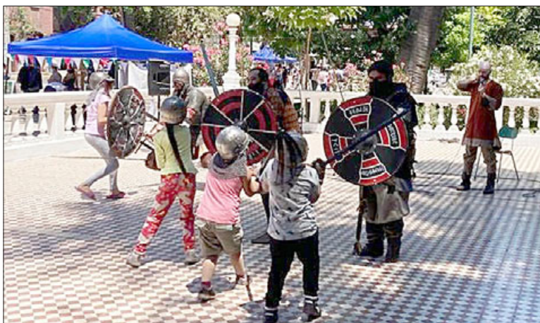
Varmesjord recreacion vikinga.