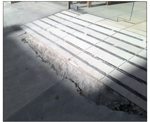
IMPRESIONANTE.- Así quedó la entrada al restorán, definitivamente esto no puede ser aceptado.

- Mire, yo más que nada pienso de que igual esto no salió barato ¿ya?, entonces bajo ese sentido yo pienso que cuando uno hace un buen trabajo, con los aportes que tengan, me imagino que no es un aporte mínimo, entonces pienso que hay que hacer las cosas bien y es una molestia porque quedó horrible, si comparamos con la vereda del frente que está mu-