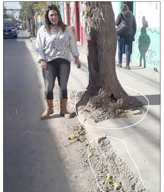
Cualquiera que vea esta imagen, pensará que las veredas ya cumplieron su vida útil y deben ser renovadas, pero no, son nuevas, recién hechas...

- Me gustaría que ellos vinieran, arreglaran un poco aquí afuera del restorán, que le pusieran un poquito más de cariño y amor, eso solamente.