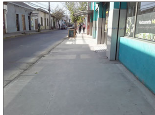
Una panorámica de cómo quedaron los trabajos afuera del restorán 'Mar y Tierra'.