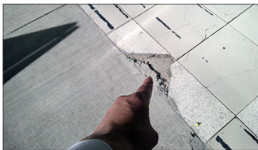
Imagínese tener un local bastante atractivo y que una obra pública lo deje en este estado.