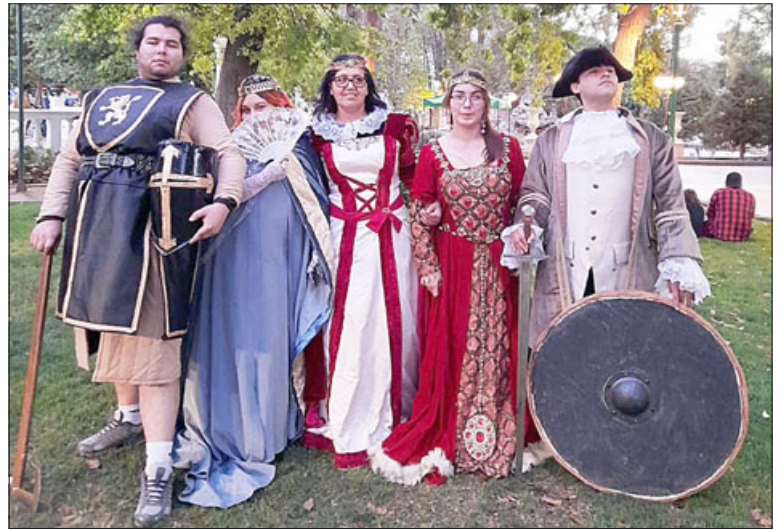
Asistentes luciendo trajes medievales.

tará con su mágica voz; contaremos también con el gran show de 'Leoniuous Pino', gran gaitero que nos hará bailar con sus melodías; los locales 'Camerata Aconcagua' no pueden faltar, es un grupo vocal dedicado exclusivamente a la música antigua, muy queridos en el valle; finalmente contaremos con la gran presencia de 'Luna Negra Danza Tribal', gran bailarina sanfelipeña que nos cautivará con su espectacular baile. El día sábado realizaremos un concurso con los mejores trajes medievales, por lo que les recomendamos a los lectores que vayan en familia caracterizados y podrán participar en un entretenido concurso. Y a propósito de trajes, estará a disposición un puesto hermoso en el que podrán ponerse un traje medieval y