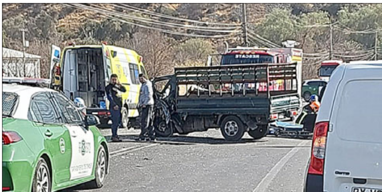
Choque generó que el tránsito estuviera suspendido por algunos minutos.

Minutos después de producido el choque, el tránsito fue reestablecido en el lugar.