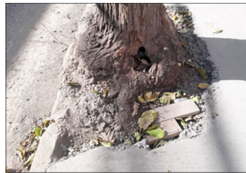
Así quedó la taza a un árbol que hicieron.