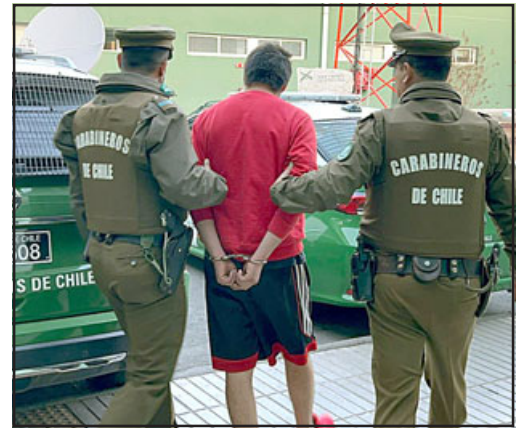
El sentenciado siendo trasladado por personal de Carabineros.

Carabineros señaló que el detenido será puesto a disposición del Tribunal de Garantía de San Felipe el día de hoy para su control de detención por la droga incautada, para posteriormente entrar a cumplir la pena de 5