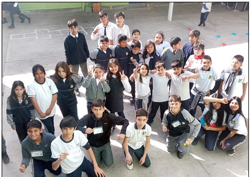
Monitores con su credencial, junto a los estudiantes, quienes esperan ansiosos los días miércoles.