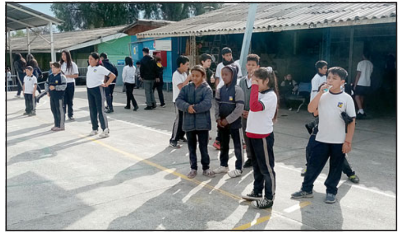
Todos los miércoles los alumnos tendrán su 'Recreo Entretenido'.

La iniciativa fue propuesta por estos propios alumnos, quienes sintieron la necesidad de mejorar el clima de la escuela y fomentar la sana convivencia escolar, puesto que los estudiantes que hoy son los líderes de los más pequeños, en algún