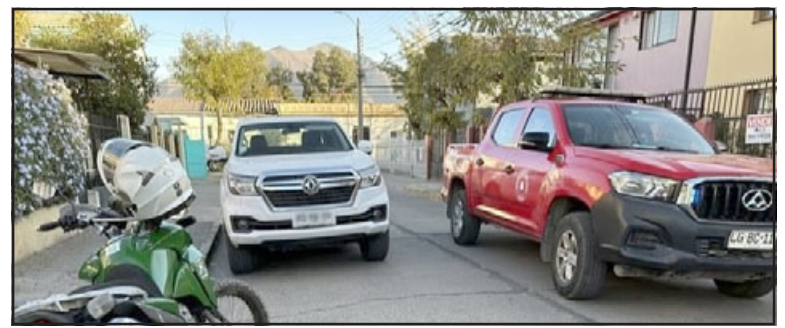
Patrullaje preventivo permitió detectar que al vehículo de la imagen le habían clonado sus patentes.

personal de Carabineros para adoptar el procedimiento de rigor.