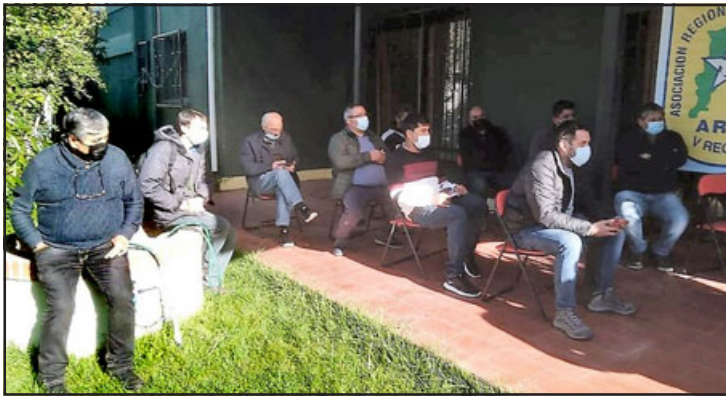
Este sábado se reunirán en Viña del Mar los principales directivos del balompié aficionado de la quinta región.