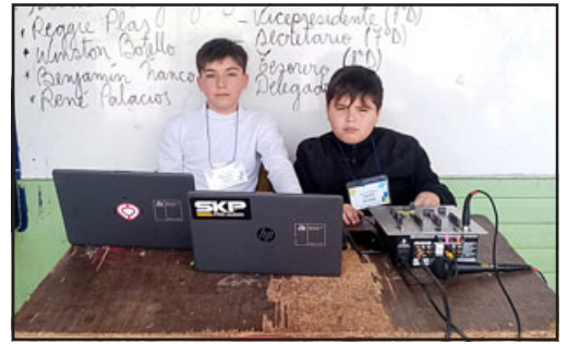
Estación de música para hacer más dinámico el 'Recreo Entretenido'.

«Lo que nosotros queremos hacer con los monitores es cambiar su liderazgo a algo positivo, ya que muchos de ellos han tenido conflictos en las salas de clases y hoy por hoy han bajado esos conflictos, se comprometieron a no descuidar el ambiente pedagógico y que van a ser parte de este proyecto, siendo una referencia para los más chicos, entonces tenían que mos-