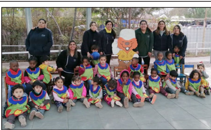
El jardín infantil 'Hormiguitas de Aconcagua' fue el escogido por Conaf para celebrar el Día del Medioambiente.

Personal de Carabineros lleva a cabo la investigación respectiva para esclarecer el hecho.