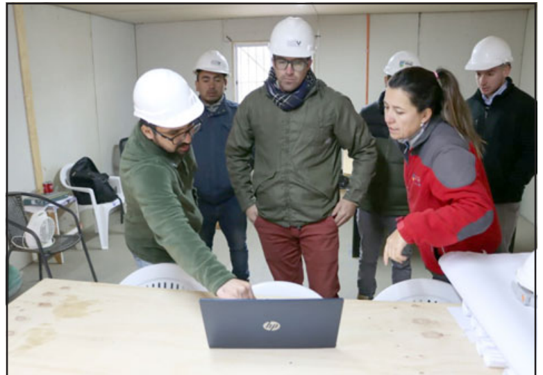
Obras fueron visitadas por el alcalde Edgardo González Arancibia.