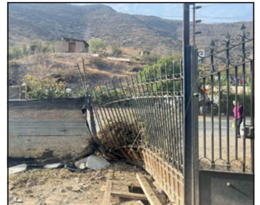
Parte de los daños dejados por el choque que los afectó este domingo.

Se puede ver claramente que, a raíz del accidente, la familia quedó desprotegida sin las panderetas.