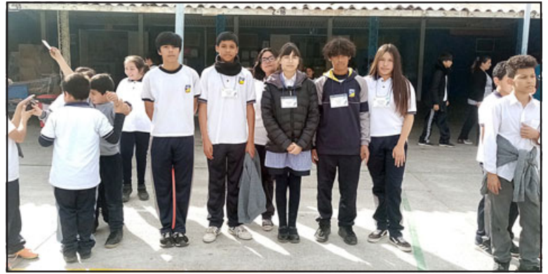
La iniciativa busca mejorar los índices de agresividad entre estudiantes.

Finalmente, Leiva comentó la motivación que existe, el trabajo de los monitores y la positividad de este tipo de actividades. «Los niños están súper motivados, saben que el día miércoles sí o sí van a haber este tipo de actividades, entonces andan preguntando el día miércoles en la mañana qué actividades vamos a tener.