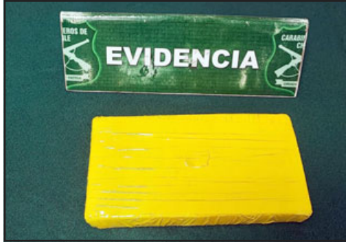
El ladrillo de cocaína de alta pureza avaluado en 20 millones de pesos.

El sentenciado fue identificado con las iniciales B.L.M.S. , de 26 años de edad.