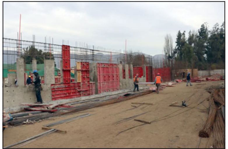
A toda máquina avanzan las obras de construcción del Liceo El Porvenir.

«Estamos muy contentos y esperanzados con esta noticia, con esta visita a terreno y con la reunión que tuvimos con los vecinos y vecinas, porque nos permite soñar que a partir del segundo semestre del año 2024 podamos tener en Llay Llay, uno de los Liceos más modernos de todo Chile», cerró el alcalde Edgardo González.