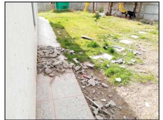
Escombros del impacto de este fin de semana pasado, donde el vehículo casi entra a una de las habitaciones de la casa.

puesto que no beban alcohol y si lo hacen, como se dice siempre en los comerciales, que entreguen las llaves, que los vayan a buscar y que piensen en las otras personas, que se pongan en el lugar de la otra persona, pensando en que, si chocan, qué daño les provocan a las familias. Eso esperamos», cerró.