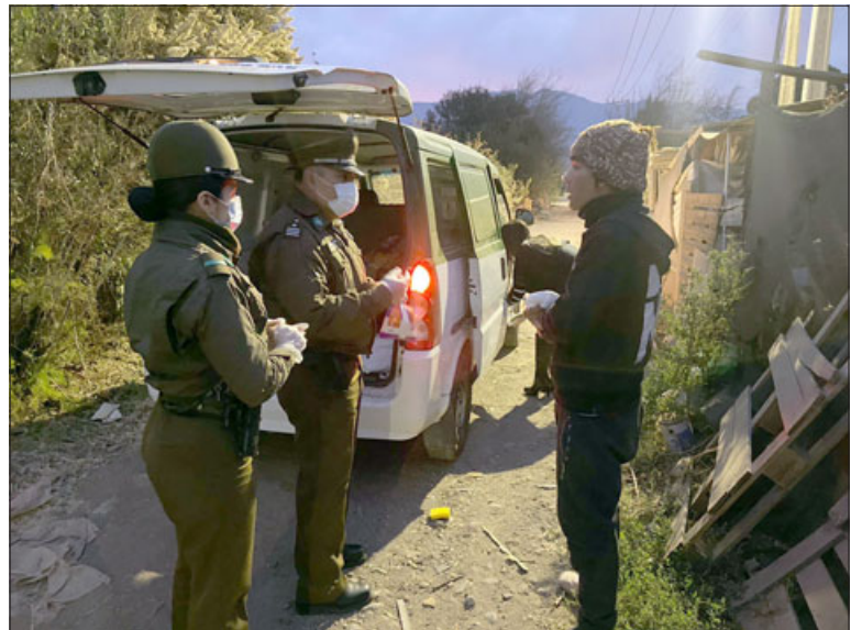
Trabajo en terreno de la Oficina de Integración Comunitaria de Carabineros.