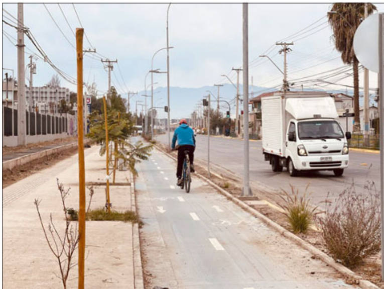
La obra se divide en nueve etapas por un monto total de 47 mil millones de pesos, y lo que se inauguró corresponde a 1.7 kilómetros por un monto de alrededor de 6 mil millones de pesos.

La edil además añadió que estos proyectos son «algo muy necesario por el hecho que todo lo que es la fluidez del tránsito lo tenemos que potenciar, hoy Michimalonco con la calidad que se ve estructural, esperamos que todos los vecinos y vecinas lo cuiden, esto es parte para toda la comuna, necesitamos tener estos espacios que le den belleza a la comunidad y seguridad que es lo más importante», cerró.