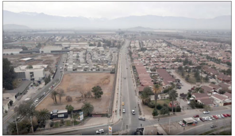
La nueva e imponente avenida Michimalonco fue finalmente inaugurada en forma oficial este martes.