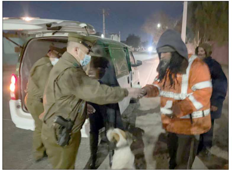
Un café caliente para el frío dieron los funcionarios de Carabineros a quienes más lo necesitan.