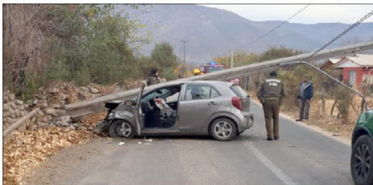
En esta posición y con airbag activado quedó el automóvil particular del suboficial de Carabineros Juan Santibáñez Sanhueza.

- Son lesiones de carácter grave, reservadas, al momento él se encuentra fuera de riesgo vital y obviamente como institución también lo estamos apoyando a él y a