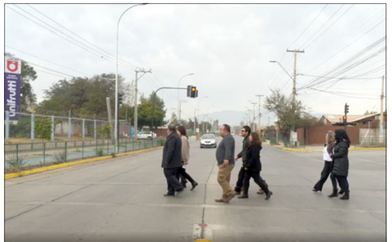
Autoridades junto a vecinos cruzando la calzada de esta nueva arteria estructural de San Felipe.