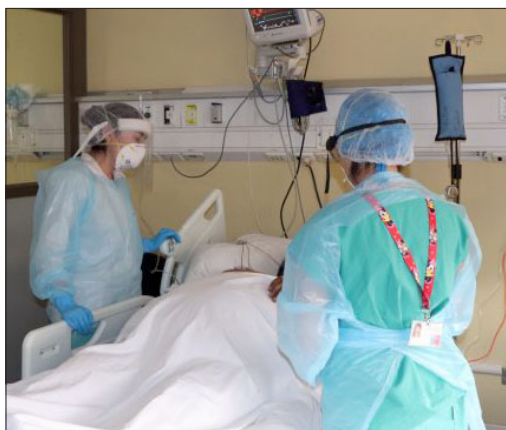
Al 100% de ocupación de camas se llegó en la Unidad de Pacientes Críticos del Hospital San Camilo de San Felipe. (Referencial)

«Aquí lo importante es lograr que la población se vacune, que se vacune ahora ya porque se demora un par de semanas en adquirir la inmunidad, para que, si se contagia, tener una enfermedad más leve por influenza y no tener que llegar a la hospitalización en los adultos que nos va a complicar mucho más el sistema», manifestó Meléndez.