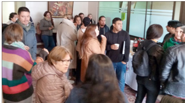
Hay 23 familias beneficiadas en primera instancia, aunque aún faltan 17 que se sumen a este proyecto.