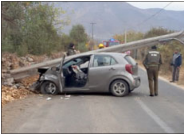
Accidente pudo ser fatal.

Error posterga inauguración: Nuevo pozo de agua para APR Las Cabras seguirá esperando