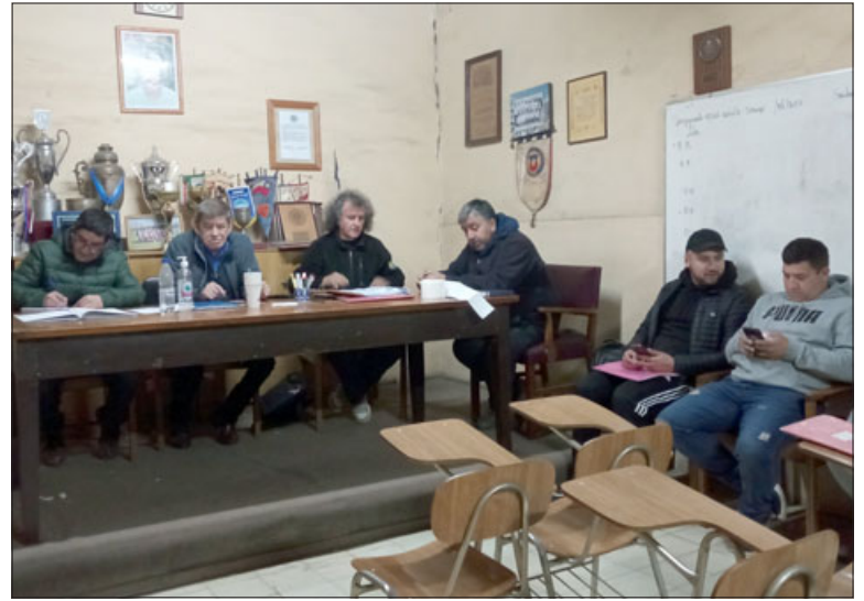
En la reunión de esta noche los directivos deberán ponerse de acuerdo para seguir avanzando.

Como se recordará, algunos directivos denunciaron que un club (Unión Delicias) hizo actuar ante Ju-