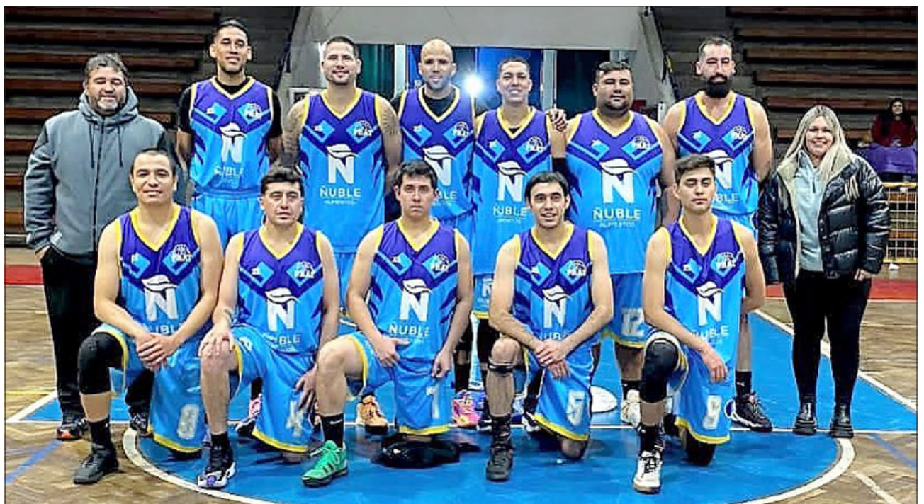
El Prat está dentro de los cuatro mejores de la LNBCN.