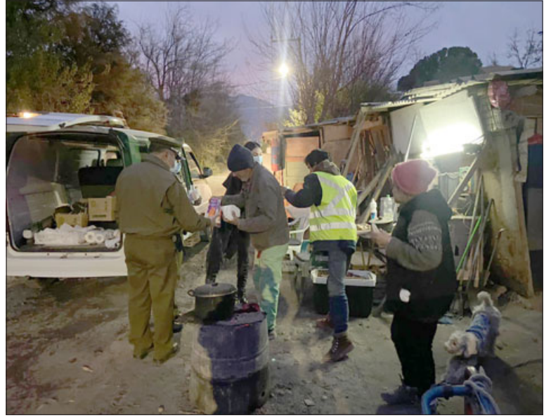
Oficina de Integración Comunitaria de Carabineros entregó ayuda a las personas en situación de calle.

Cabe destacar que de manera constante la Oficina de Integración Comunitaria de Carabineros de San Felipe realiza este trabajo de 'ruta calle', entregando alimento y ayuda a las personas que más lo necesitan, considerando, además, las bajas temperaturas que estamos viviendo en nuestro valle del Aconcagua a raíz del invierno.