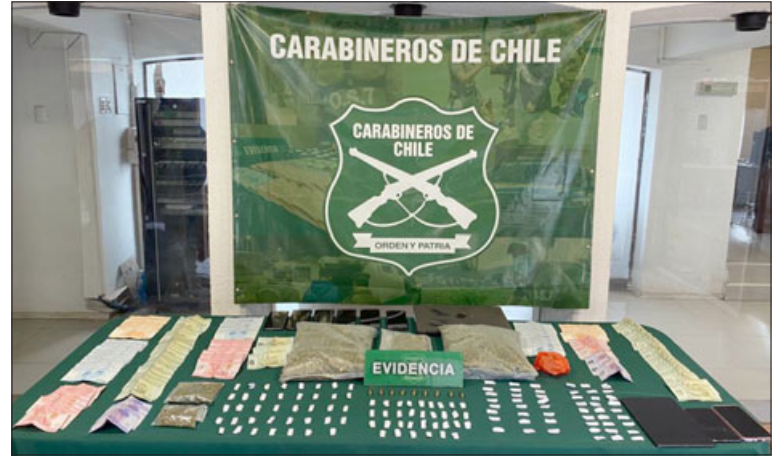
Esta es la droga, municiones y dinero en efectivo incautado en el allanamiento masivo en San Felipe.

«Las diligencias desarrolladas con la Fiscalía local de San Felipe, permitieron el ingreso a 7 inmuebles, terminó con la detención de estas cuatro personas, además de la incautación de la droga,