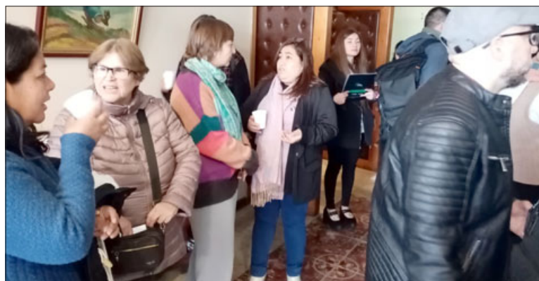
Las familias beneficiadas compartieron un pequeño coctel en el Teatro Municipal.

«Nosotros desarrollamos otros proyectos, pero que no son de integración, los cuales son en Coquimbo, en la playa La Herradura, pero estamos ahora en proceso también de buscar otros proyectos de integración, porque para nosotros también es un compromiso el déficit habitacional de Chile, porque efectivamente no es solo San Felipe, en verdad a lo lar-