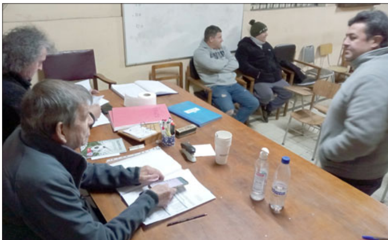
Finalmente los directivos del balompié aficionado local se pusieron de acuerdo.