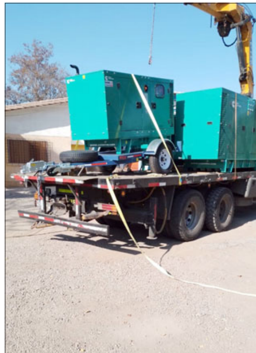
Este es el generador móvil que llegó para el APR de La Troya.