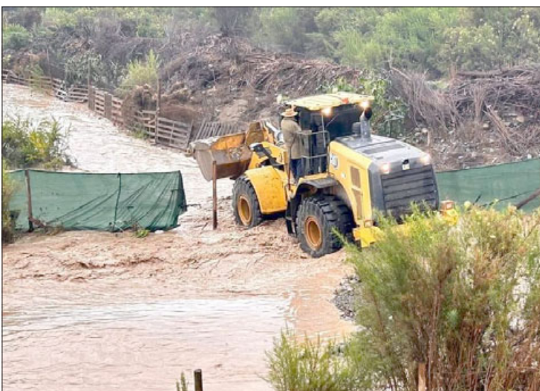
Con maquinaria pesada se realizaron trabajos para superar las distintas emergencias.