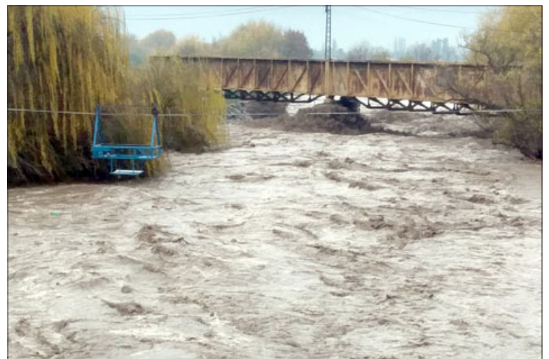
Este era el caudal del río Aconcagua en el sector del Puente El Rey.

Caudal generó socavón y caída de un poste en San Esteban.