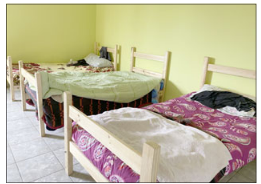
Un nuevo albergue se habilitó en calle Abran Ahumada N°99 para dar alojamiento y alimentación a 20 personas. (Foto albergue Dardignac #113).

días complejos de temporales creo que esta es una muy buena noticia que nos ha entregado el Gobierno a través del Ministerio de Desarrollo Social y la Familia. Agradecer el trabajo que se ha hecho por parte de la Delegación y de la Municipalidad de San Felipe. Esta es una muy buena noticia ya que se esperan bajas de temperatura y algunas lluvias en los próximos días, y esperamos que el albergue esté disponi-