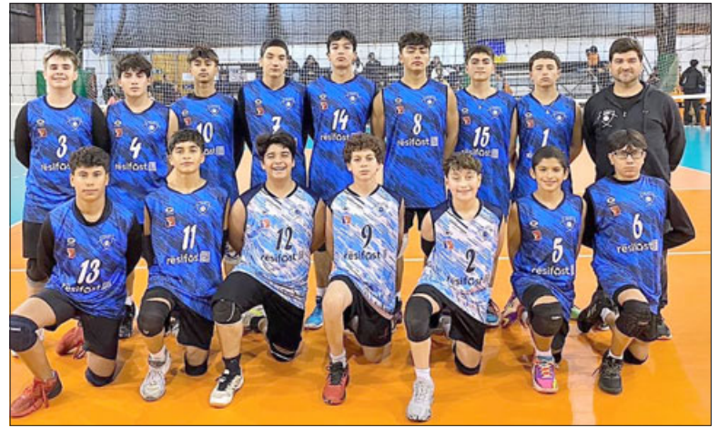
De forma invicta Unión Volley se tituló campeón nacional de voleibol en la categoría U-15.

2-0 y 2-0 a Club Manquehue 2-0 y 2-0 a Full Volley de Villa Alemana 2-1 y 2-0 a Stadio