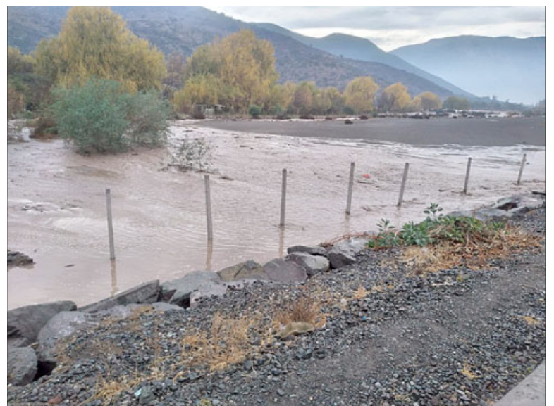
Aquí se desbordó el río Aconcagua a la altura de la toma en San Felipe.

blemas que generó la lluvia, fue el socavamiento de la ruta internacional que da hacia el paso Los Libertadores. Asimismo, Yanino Riquelme señaló que « la evaluación en general nuestra en materia de infraestructura es bastante óptima, de vialidad, de puentes, de cauces, en general se ha portado bien; igualmente tenemos una situación en la ruta 60 CH en el camino