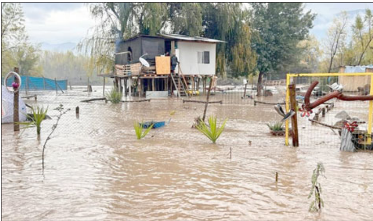
Así quedaron algunas viviendas en Panquehue.