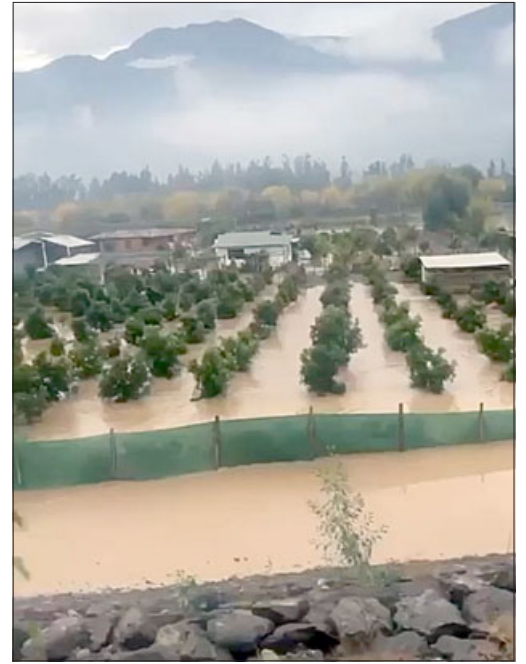
Así quedaron algunos cultivos tras el desborde del río Aconcagua.