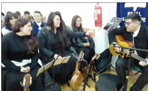
El coro preparando una alabanza.