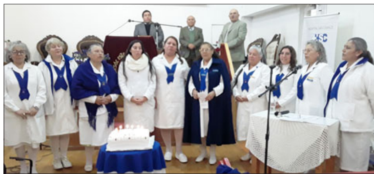
Todas las integrantes de Damas de Blanco San Felipe frente a la tradicional torta.

- Yo, feliz, es una filial muy hermosa que siempre está dispuesta a colaborar, a apoyar. Así