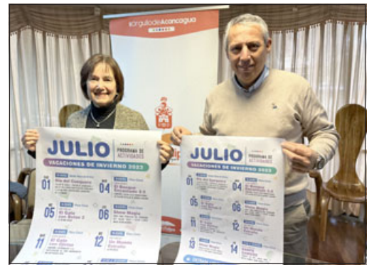
Dos semanas repletas de actividades contempla el programa elaborado por el municipio para vacaciones de invierno.