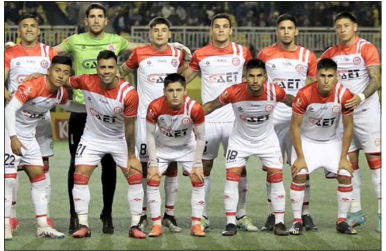
Mañana los albirrojos jugarán el partido contra Everton en Viña del Mar.

La definición de la otra llave (UC- Santiago Wanderers) cla-