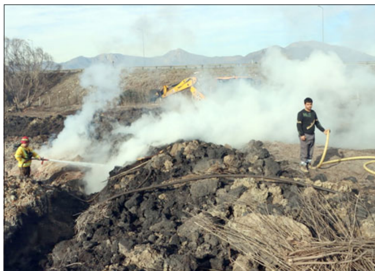
Con maquinaria pesada se trabaja para poder extinguir totalmente este incendio.

Es así que para este viernes se anunció el trabajo con maquinaria pesada para remover todo lo que existe en el lugar, principalmente material orgánico seco que arde con facilidad. Lo que ha generado el humo que ha afectado a toda la comunidad de Llay Llay.