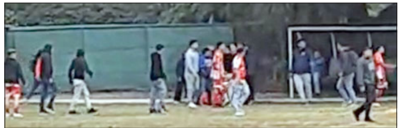
Los incidentes en la final del torneo Valle de Aconcagua no quedaron impunes.

ejemplificadoras ya que el club Independiente