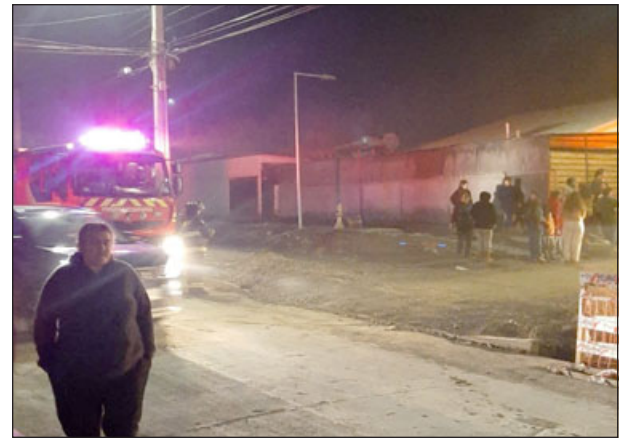
Sobre carga de estufas a leña generó dos alarmas de incendio en San Felipe. (Imagen archivo).

to, es que Herrera explicó que, si bien es difícil que estos sistemas de calefacción puedan explotar, siempre hay que realizar las limpiezas y mantenencias correspondientes para evitar este tipo de emergencias.