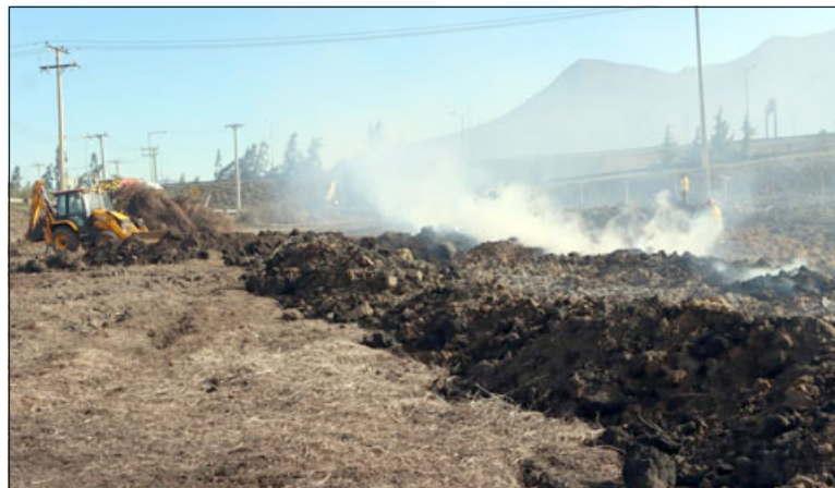
El Humo aún emana desde el lugar del siniestro.

agregó que «eso es lo que nos preocupa y nos lleva a tomar medidas extraordinarias en torno a poder apagar este incendio que ya lleva mucho tiempo. En algún momento las autoridades de gobierno y Conaf nos habían indicado que se iba a