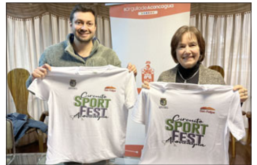
Este domingo 2 de julio, a las 10 de la mañana y con las mismas características anunciadas anteriormente, se estará realizando la media maratón que debió postergarse el pasado fin de semana por el sistema frontal.