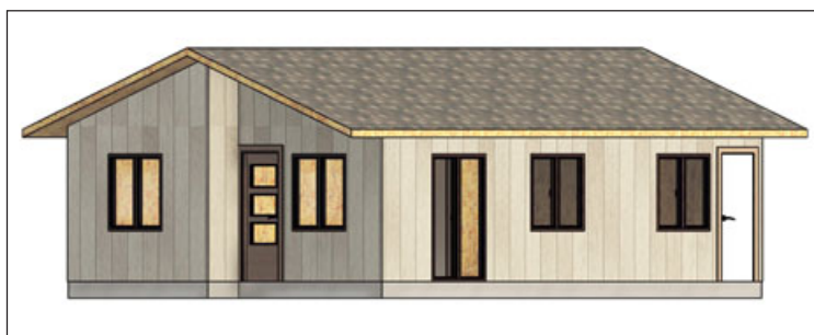
'Bermarg' se concentra en brindar soluciones constructivas que sean eficientes para enfrentar el déficit habitacional, optimizando la rapidez y la calidad tanto de los procesos como de los productos.

'Bermarg' se concentra en brindar soluciones constructivas que sean eficientes para enfrentar el déficit habitacional, por lo que esta convocatoria generó un excelente espacio colaborativo que permitió a la compañía profundizar la innovación en soluciones constructivas industrializadas, para así optimizar la rapidez y la calidad tanto de