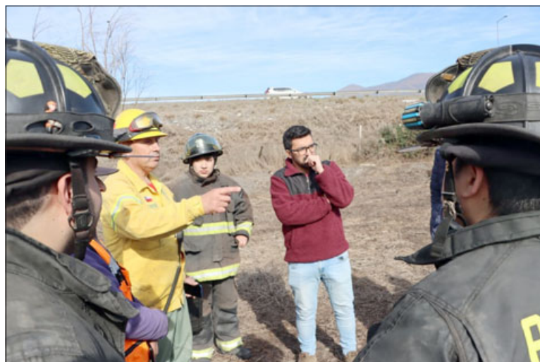
Autoridades en terreno analizaron la situación en la Punta de Diamantes.