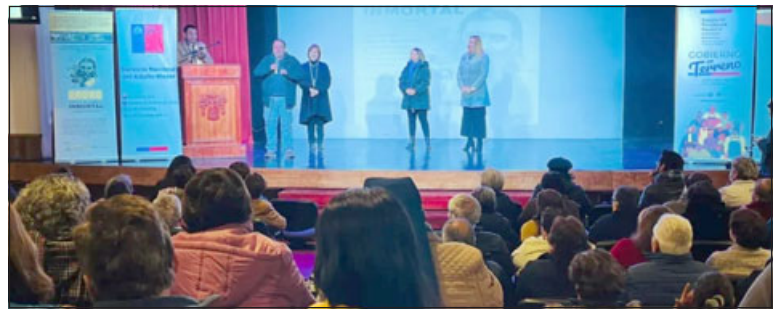
Decenas de adultos mayores participaron de esta actividad en el Teatro Municipal de San Felipe.

Es así que durante la mañana del jueves la cita fue en el Teatro Municipal, en donde los adultos mayores pudieron