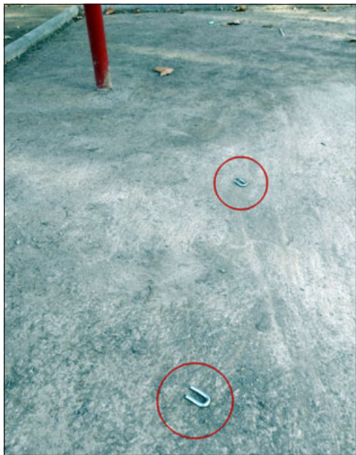
Los delincuentes cortaron las cadenas para robar los juegos infantiles.

mentó que «tenemos varios ya instalados, pero que aún no están inaugurados, por lo que consideramos que es una situación grave y que tenemos que tener, ojalá, la complicidad con nuestros vecinos y vecinas para que habilitar juegos para nuestros niños, viene una persona o más de uno, delincuentes, porque realmente eso es, y se los llevan completos, cortando cadenas y todo lo que es la habilitación de estos columpios para niños», señaló.