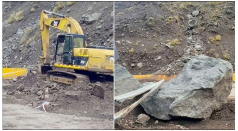
Trabajos en la ruta continúan para poder habilitarla en un cien por ciento.

Respecto de los trabajos y las evaluaciones al estado de la ruta que se han realizado, el delegado sostuvo que «se han hecho diversas pruebas en tanto a lo que es el peso de los camioneros por los socavones, aún cuando se habiliten las dos pistas, los cuales se está trabajando y van a tener una duración