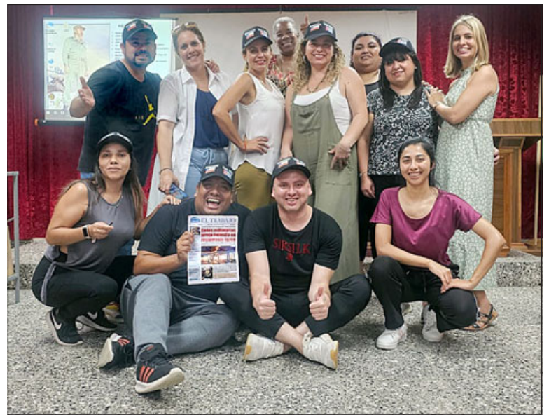
Profesores en perfeccionamiento docente en Cuba, quienes llevaron cuatro ejemplares de 'Diario El Trabajo' para entregarlos a la Universidad.

El cerebro arcaico de los más pequeños. Se dice que el cerebro de un niño menor de seis años es 'arcaico': está controlado por la espontaneidad, la impulsividad, la falta de objetividad. No está maduro. Los circuitos, que conectan la parte emocional y la parte superior de su sistema cerebral, aún no están construidos.