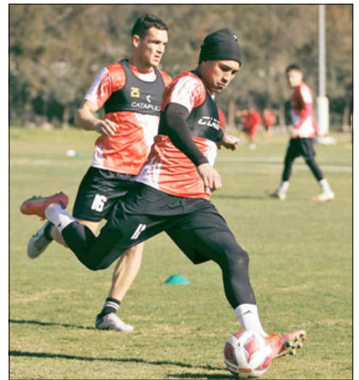
Unión San Felipe cargará con la obligación de hacer pesar la condición de local.