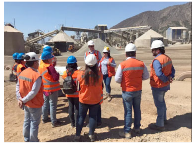
Más de 1.200 personas podrían perder sus puestos de trabajo si se concreta el cierre de la planta 'Amalia' de la comuna de Catemu.

«Hoy el tema es, si se rechaza, a fines de julio