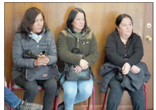
Vecinas de la Villa Altos del Mirador, cuyas viviendas registran problemas estructurales, fueron informadas oficialmente que sus casas serán reparadas íntegramente.

«Por fin estamos encontrando soluciones concretas a las viviendas del sector Villa Altos del Mirador. Para los trabajos tenemos un proceso de dos partes, las primeras enfocadas en tres viviendas que cuentan con sus respectivas ampliaciones y otras tres que corresponden solo a viviendas.