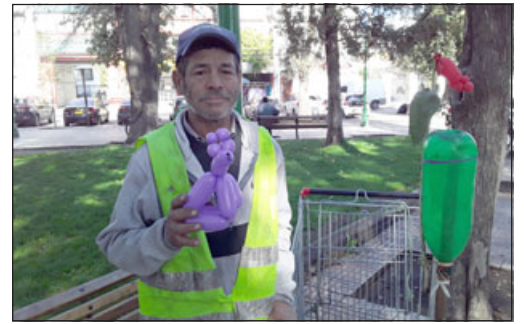
El comerciante ambulante conocido como 'Algodón de Azúcar', junto a su carro y globos recorriendo la Plaza.

- Hay veces que, digamos, aunque le vaya mal a uno, siempre tiene que decirlo de corazón... bien, y palabra de hombre, es la verdad; respetar, querer, adorar. Si yo no vendo un globito, si no tienen una monedita, porque yo no