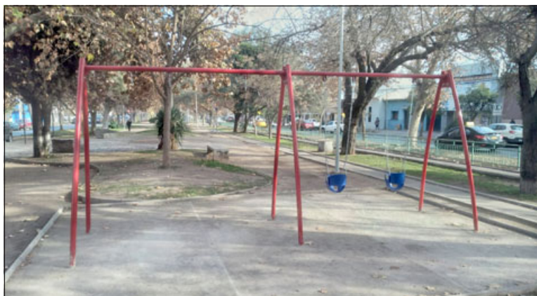
Desconocidos robaron dos columpios de juegos recientemente instalados en la Aveniuda O' Higgins.