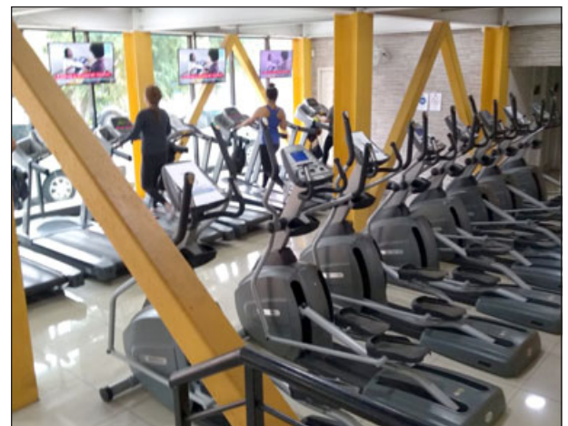
'Gimnasios Pacific' se comprometió públicamente a dar respuesta a todos los socios afectados por el cierre de la sucursal local.

«Ante cualquier cliente que tenga duda, tenemos