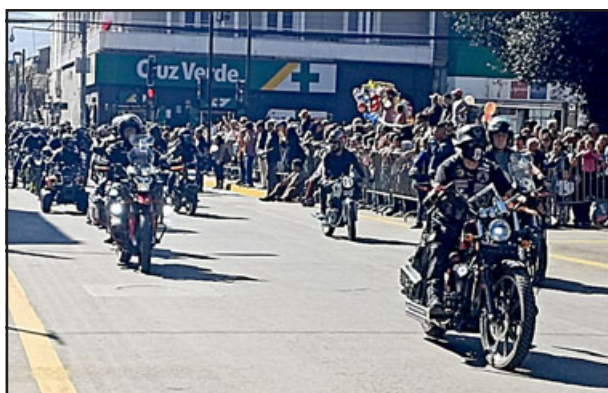
Los motoqueros también dijeron presente en el desfile.