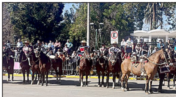
Los huasos cerraron el desfile con el tradicional esquinzazo a las autoridades.

‘chinchineros’ « que llenaron de magia y nostalgia a todos los presentes con su música y piruetas, ‘Los Chinchineros’ de Cartagena se lucieron, las colegias de los colegios, los colegios en sí, el Orfeón de Aconcagua, todos se lucieron en un día tan importante », cerró la edil.