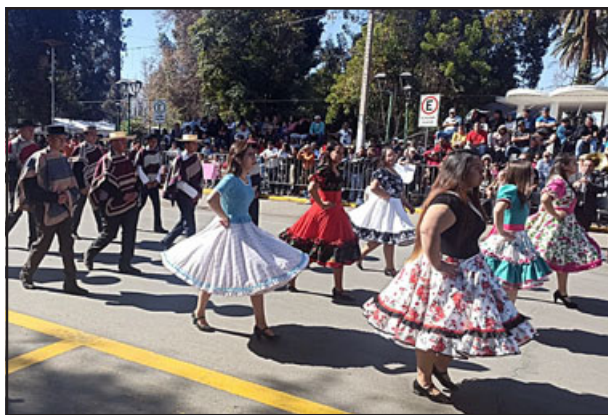
Parejas rumbo a los tradicionales pies de cuecas.

reas que cumplir, pero lo estamos haciendo con mucha transparencia y seriedad que es lo que siempre le decimos a la comunidad, sin falsas esperanzas, sino que es darle todo lo que queremos con realidad y manos limpias».