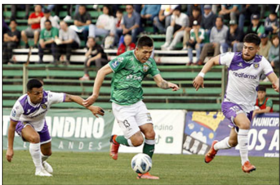
Los andinos ya no tienen margen para seguir errando.