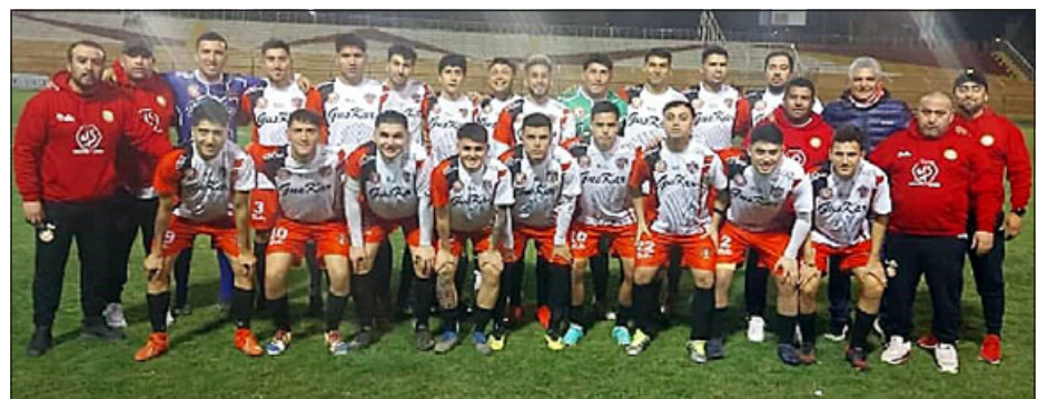
La selección de Honor de San Felipe una vez más será local en el Municipal.