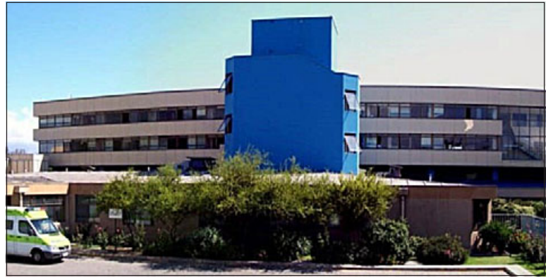
Desde el lunes se retoman las visitas al Hospital San Camilo.

subdirectora de Gestión del Cuidado del Hospital San Camilo reiteró que el uso de mascarillas al interior del recinto se mantiene en carácter de obligatorio.