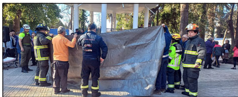
Momentos de incertidumbre se vivieron luego que un músico del Orfeón de Melipilla sufriera un paro cardiorrespiratorio en plena presentación.