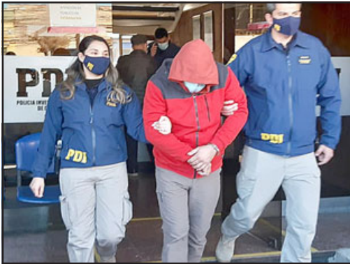
El imputado saliendo de la PDI cuando fue detenido y enviado a prisión preventiva.

Reiteramos que son 10 días de corridos, a partir del miércoles, para ver si la defensa luego de analizar el fallo, decide presentar un recurso de nulidad.