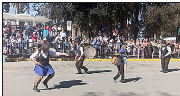
Los ‘chinchineros’ se lucieron en el desfile.

Asimismo, y respecto de sus palabras en el discurso oficial, la edil indicó que « tenemos muchas ta-