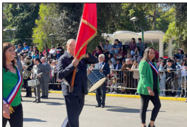
Organizaciones sociales desfilaron en este nuevo 3 de agosto.