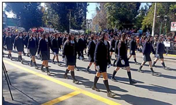
Delegaciones de los colegios rindieron honor a la ciudad.