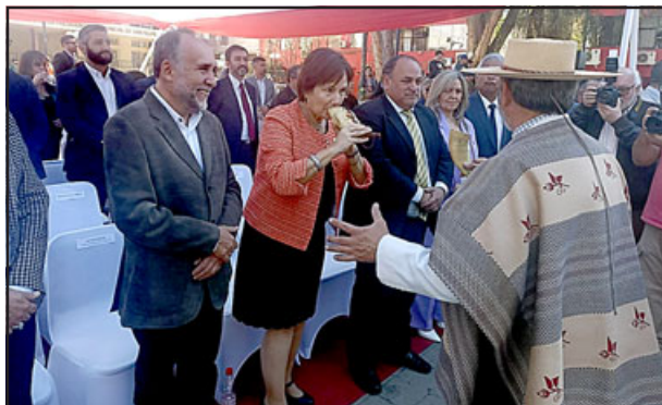
Autoridades degustaron un clásico de los desfiles, el tradicional ‘cacho’ de chicha.