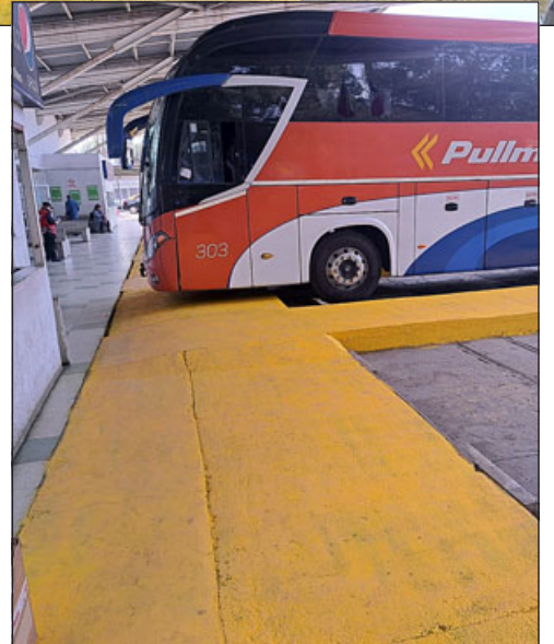
Acá se aprecian los andenes recién pintados.

les para el funcionamiento de un recinto de estas características», señaló.