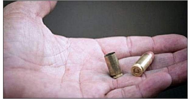
'Bala loca' dejó sin agua a vecinos de los departamentos Sargento Aldea. (Referencial)

empresa sanitaria que provee el servicio, no puede prestar servicios por cuanto se encuentran dentro de una co-propiedad, en este caso, de un block de departamentos, lo que afectó a alrededor de 80 familias que estuvieron sin suministro, por lo que el municipio concurre con el camión aljibe a objeto de poder prestar el vital elemento y posteriormente ver cómo podemos colaborar en la reparación de estos daños que se ocasionan