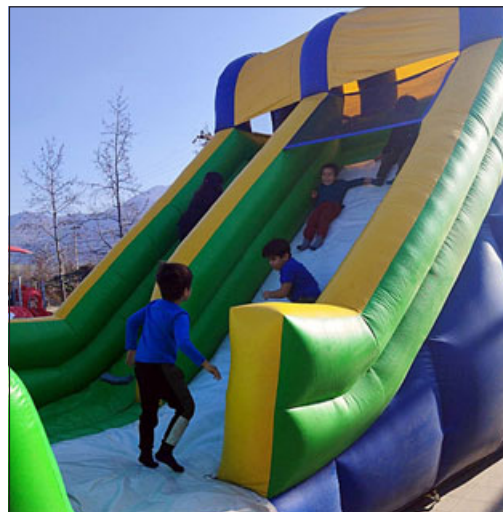
Pequeños disfrutando de los juegos inflables.