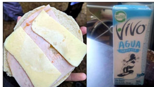
Este fue el ‘almuerzo’ entregado a los estudiantes del Liceo Rinconada de Silva.

«No obstante a ello, le hemos solicitado al director regional de la Junaeb que se haga pre-