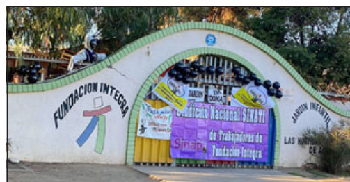
Fundación Integra realiza paro indefinido exigiendo se cumplan los compromisos establecidos.

Junto con esto llamaron y esperan que desde el nivel central se les pueda dar una respuesta clara a sus demandas; «tuvimos hace dos semanas un paro de advertencia, nos llamaron a un paro de 48 ho-