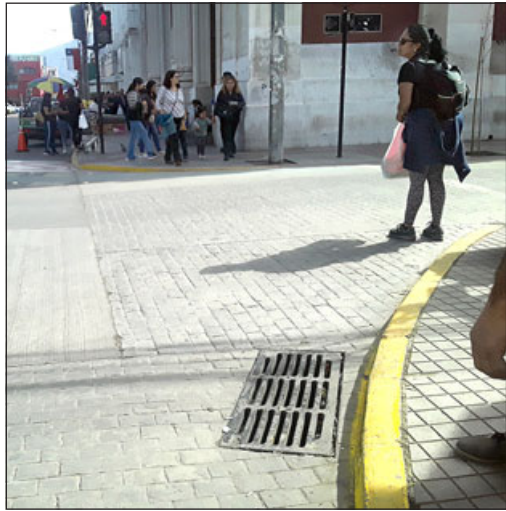
Intersección de las calles Prat con Coimas, pleno centro de San Felipe.

Se está transformando en un clásico del centro de San Felipe, la hediondez