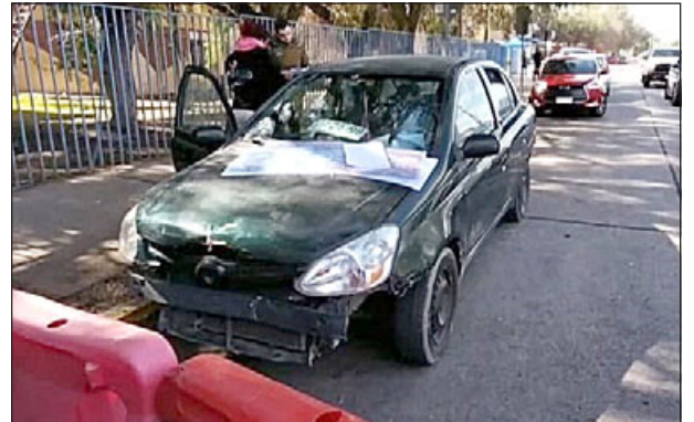
Otro vehículo con encargo por robo fue recuperado por personal del OS14.

vecinas en el sentido de mejorar la sensación de seguridad, esto, insisto, el convenio colaborativo entre Carabineros y el municipio a través del convenio OS14 ha dado buenos frutos en las primeras semanas de evaluación», destacó Hernán Herrera .