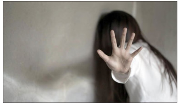
Fue la propia víctima quien años después y apoyada por su pololo, realizó la denuncia formalmente.

- Exactamente, el tribunal escuchó las distintas versiones que dieron los funcionarios policiales. Esta joven prestó declaración varias veces; declaró primero al hacer la primera denuncia en la Brigada de Delitos Sexuales, luego ante la unidad de Carabineros de Chinchorro, después en virtud de una orden de investigar volvió a prestar declaración ante la PDI de Arica. Esas tres versiones fueron expuestas por los funcionarios policiales, consignando que las tres eran consistentes entre sí,