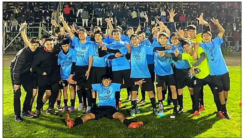
La selección de Panquehue celebra su triunfo en la serie U17.

Otros seleccionados que también se vieron sólidos y contundentes fueron los representantes de la Asociación de Panquehue, los que sin mayores contratiempos doblegaron a sus iguales de Calle Larga, en los juegos disputados en el estadio Ejército Libertador.