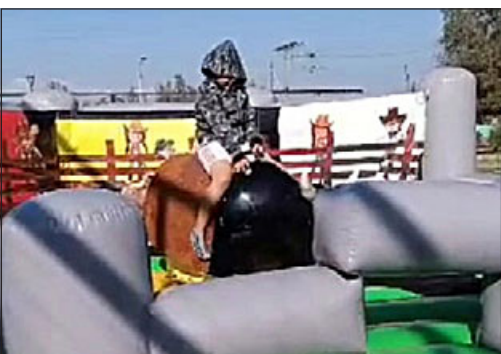
El toro mecánico fue una de las atracciones más disfrutadas por los niños.