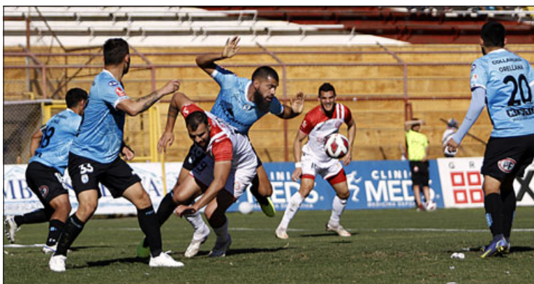
Cuatro encuentros de local e igual cantidad como forastero son los que les quedan por delante al Uní Uní.

Claramente los últimos dos resultados (0-1 y 1-1) de Unión San Felipe , estuvieron por debajo de lo esperado. Los albirrojos se habían puesto como objetivo capturar 10 de los 12 puntos que estaban en juego en los cuatro partidos seguidos que jugaron como locales en el estadio Municipal. La realidad indicó que solo debieron conformarse con 7.