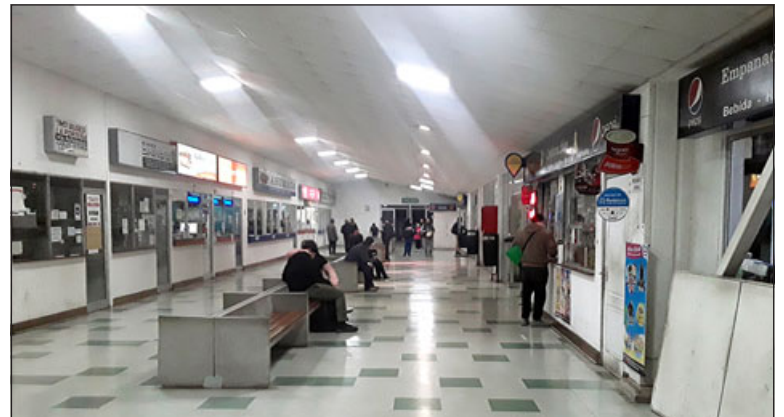
El interior donde se ubican las oficinas de ventas de pasajes.