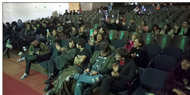
El público disfrutó los diversos estilos musicales del encuentro de bandas.