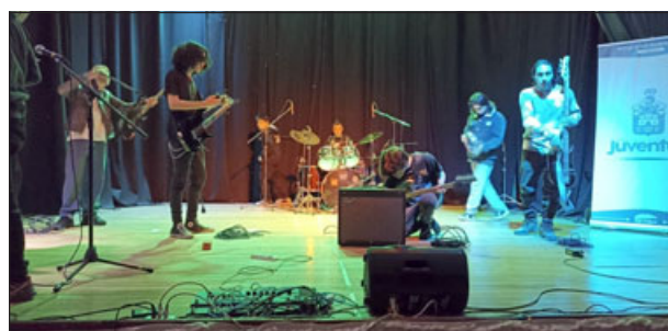
Banda preparándose para presentarse ante el público del Teatro Roberto Barraza Moreno.

También detalló los alumnos que estuvo acompañando en la jornada. « En este caso vengo acompañando al Liceo Max Salas, donde vinimos con ocho estudiantes, más un par de ex alumnos que también apoyan a los grupos y el Liceo Amancay que tam-