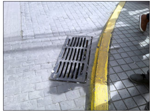
Acá estaría el meollo del mal olor.

mal olor que sale de repente, que se siente muy fuerte a veces», señala otra persona.