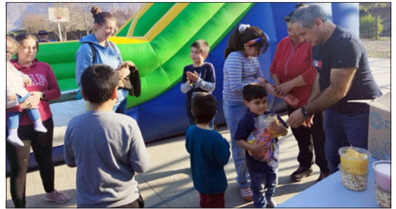
Entrega de bolsa de dulces, potes de cabritas y de algodón de azúcar.

También se refirió a los recursos que necesitaron para la realización de esta jornada, en donde destacaron los propios locatarios, además de explicar las razones de una actividad que beneficie a los menores. «La verdad que este año fue netamente aporte de los mismos locatarios, de los locales que tenemos nosotros ahí a la mano, como fue la ‘Botillería Gato’s’, la ‘Amasandería ‘Recortes