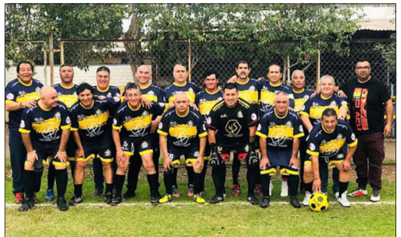
Tsunami es uno de los llamados a poner en riesgo el poderío de Los Amigos.