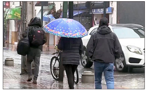
Escasos 2 a 3 mm de lluvia dejaría este frente de mal tiempo que se inició hace unas horas.

«Desde esta noche de miércoles, en la madrugada del día jueves, un par de milímetros; 3 milímetros podrían caer, no más que eso. Los días siguientes van a predominar las nubes, lunes y martes con bastantes horas con el cielo despejado, y recién el próximo miércoles y jueves aparece una precipitación que hoy día se ve bastante abundante; 10 a 15 milímetros podrían caer, pero en lo inmediato no tenemos en nuestras fuentes, precipitaciones interesantes para el Valle del Aconcagua. No así para la Cordillera, donde ya esta tarde de jueves se esperan precipitaciones sólidas sin nieve, que podría complicar una vez