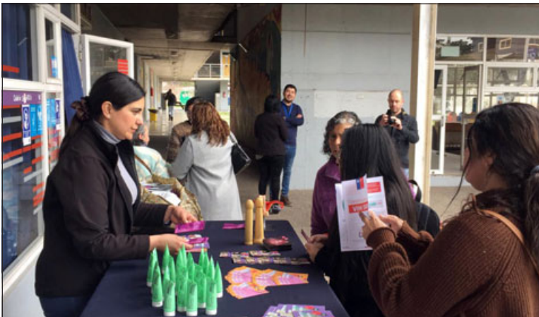
Equipos de salud realizaron campaña educativa en torno al VIH Sida.

estos exámenes preventivos; «consultar luego de la realización de este en un dispositivo de salud de atención primaria para poder continuar con el tratamiento o seguimiento de esta enfermedad», cerró.