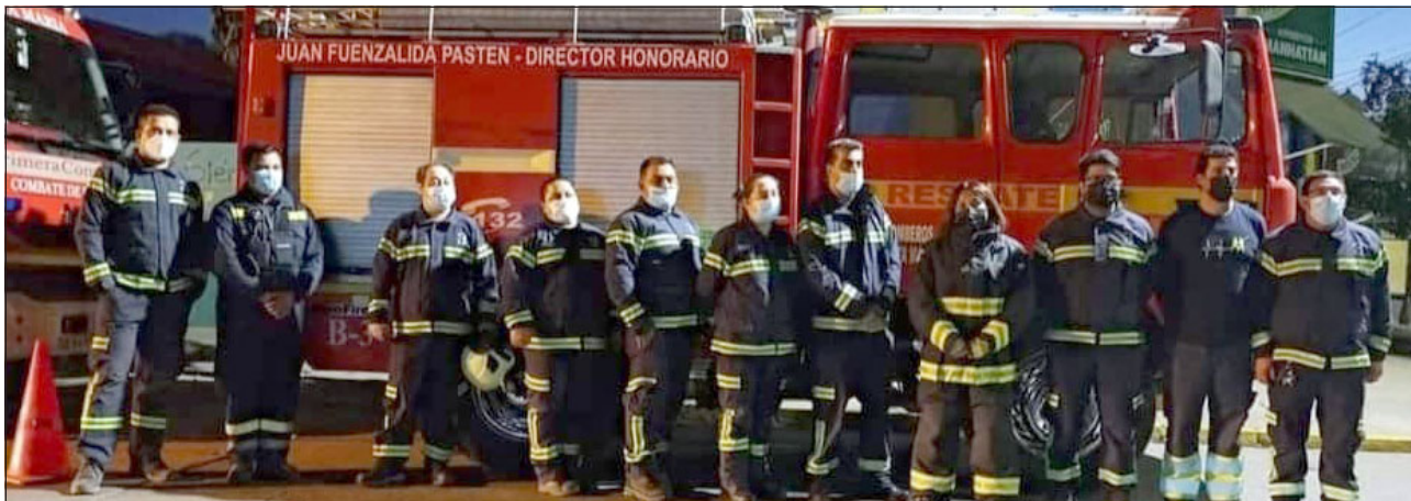
Parte de los voluntarios de la Tercera Compañía 'Bomba Tocornal', quienes están celebrando 5 años de existencia.