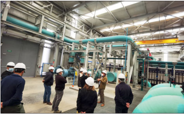
La planta desaladora produce 250 litros por segundo de agua potable, la que es almacenada en copas igual como se hace acá, y luego distribuida a los hogares.