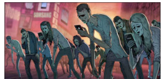
Generación de Zombis digitales.

Una dictadura perfecta tendrá la apariencia de una democracia, pero sería básicamente una prisión sin muros en la que los presos ni siquiera soñarían con escapar. Sería esencialmente un sistema de esclavitud, en el que, gracias al consumo y al entretenimiento, los esclavos amarían su servidumbre. «Un mundo feliz» (1932) ALDOUS HUXLEY.