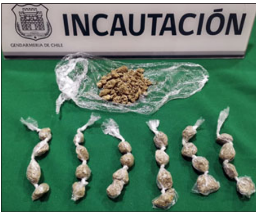
El pasado sábado se logró incautar una importante cantidad de marihuana, la que estaba escondida en el techo del baño del sector de la multicancha.

nes, gracias a un actuar oportuno, detectaron elementos prohibidos, los cuales, al ser registrados, se detectó que eran municiones. Obviamente que si hubiera ingresado este elemento, hubiera puesto en serio riesgo y peligro la seguridad del recinto. Nuestras unidades cuentan con cir-