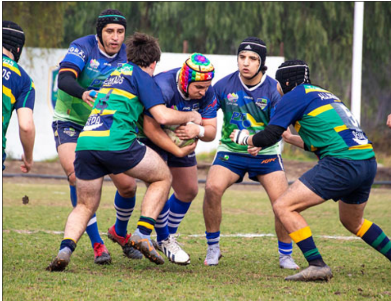
Halcones RC tiene como objetivo mayor terminar segundo en su serie de la Arusa.

Con la ilusión y responsabilidad por dejar atrás la sorprendente caída de la fecha pasada ante UST, este sábado, el quince Los Halcones de Aconcagua intentarán volver al triunfo frente a Gauchos RC .