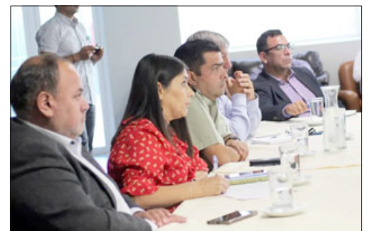
Una nueva disminución en la ocurrencia de delitos en el valle del Aconcagua reveló la última reunión del Sistema Táctico Operativo Policial (STOP).

Asimismo, y en el marco de la baja, el delito que sigue preponderando en San Felipe sigue siendo el robo en lugar no habitado, «el delito que sigue impactando es el delito de robo en lugar no habitado, asociado dentro de las cuatro alamedas, no obstante a ello, hay delitos que em-