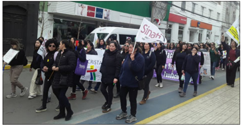
Las tías de jardines de Fundación Integra manifestándose por San Felipe.

- Esa cifra exacta no le podría decir, pero sí lo que le puedo decir es que nosotros como trabajadoras de Integra no estamos pidiendo más dinero del que tene-