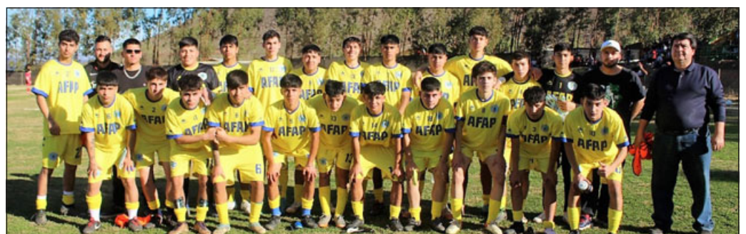
Selección sub – 17 de Putaendo.