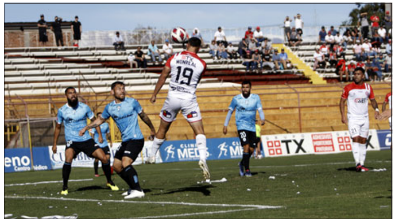
FUERA DE CASA.- Este domingo el Uní Uní volverá a ser forastero.