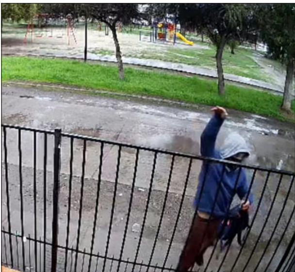
El hombre lanzó una piedra, rompió un vidrio y rápidamente huyó del lugar.

ORACIÓN A SAN JUDAS TADEO.- Patrón de los casos difíciles, ¡oh, gloriosísimo Apóstol San Judas Tadeo! Siervo fiel y amigo de Jesús, con el nombre del traidor que entregó a nuestro querido Maestro en manos de sus enemigos; ésta ha sido la causa de que muchos os hayan olvidado, pero la Iglesia os honra e invoca universalmente como patrón de los casos difíciles y desesperados. Rogad por mí, que soy tan miserable y haced uso, os ruego, de ese privilegio especial a vos concedido de socorrer visible y prontamente cuando casi se ha perdido toda esperanza. Venid en mi ayuda en esta gran necesidad para que reciba los consuelos y socorros del cielo en todas mis necesidades, tribulaciones y sufrimientos, particularmente (haga aquí la súplica que desee obtener, con fe y devoción, y repita esta oración durante 9 días, prometiendo publicarla en el 8º día y por difícil e imposible, se le concederá). Y para que bendiga a Dios con vos y con todos los escogidos por toda la eternidad. Amén E.L.