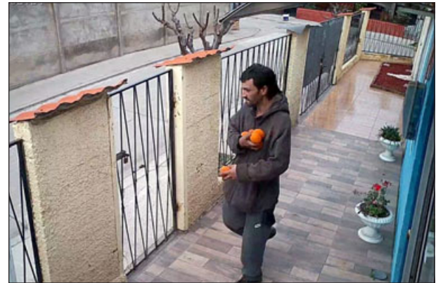
Según información de los vecinos, este registro lo muestra saliendo con naranjas de una vivienda en la Villa Cordillera. Se ve como la reja está con candado puesto.