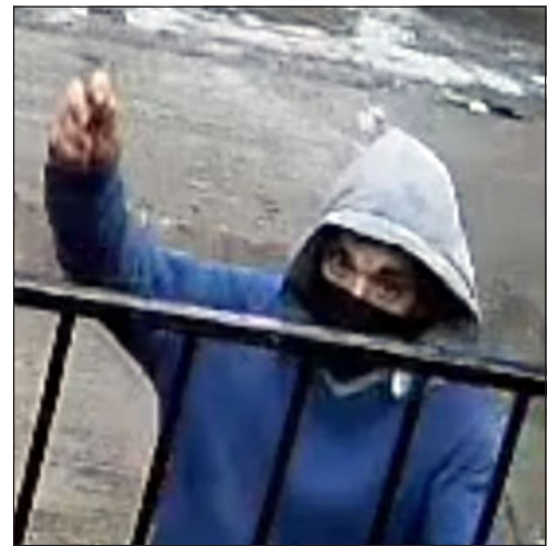
Momento exacto en el que va lanzar una piedra hacia un domicilio.