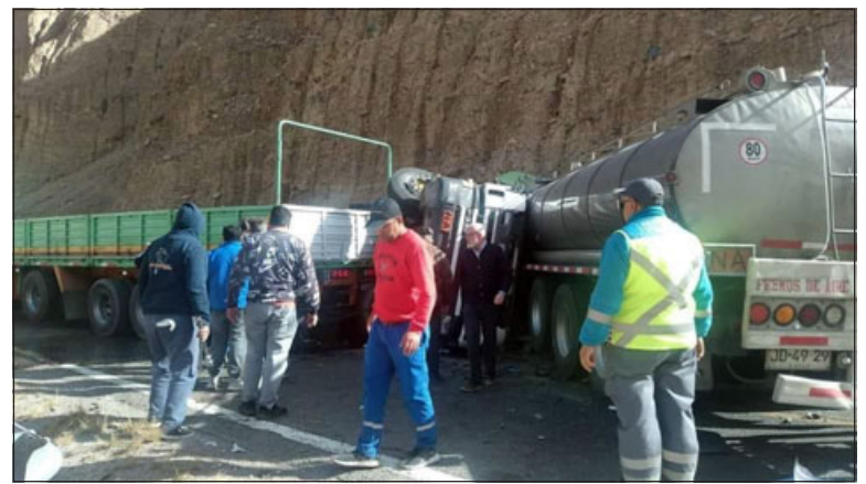
Camionero de Putaendo falleció en accidente en Argentina.

En este sentido, Méndez explicó que «los trámites de internación de cadáveres desde el extranjero obligan que éste se realice con una resolución sanitaria que autorice su ingreso, una resolución sanitaria chilena. Nosotros tenemos un disposi-