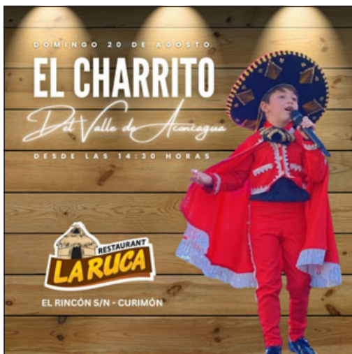
Este es el afiche promocionando la presentación de 'El Charrito' del Valle de Aconcagua.

Nos cuenta que canta alrededor de tres canciones. También llamó a que la gente confíe en los artistas locales.