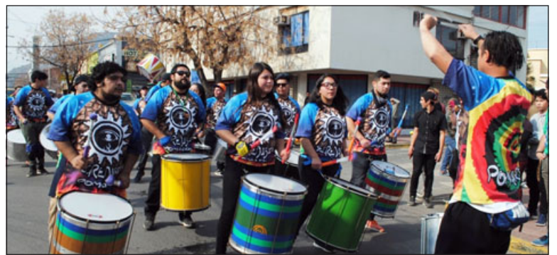
Los carnavales nuevamente se tomarán las calles de Los Andes, en la cuarta versión del Carnaval Antü Yampai, a realizarse hoy viernes 18 y mañana sábado 19 de agosto.

se dará un vuelco, saliendo del centro de la comuna para ir a los barrios. « Nuestra motivación es más que nada para dar alegría, y el pasacalle principal del día sábado se hará por los siguientes sectores: Villa Los Acacios, Elías Foncea hasta Raúl Vargas, avanzando al parque por calle Guayanah hasta llegar a Tucapel y Avda. Perú. En el Gimnasio Centenario tendremos un work-