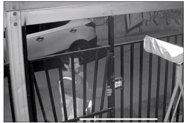
El sujeto llamando a una casa en horas de la tarde.

Finalmente, se refirió al tiempo que llevan lidiando con esta situación, el temor que sienten como comunidad, además de la necesidad de que este hombre sea ayudado por profesionales. «Desde hace bastante rato que empecé a hacer daños, serán unos cuatro meses aproximadamente, donde nos sentimos atemorizados, los niños ya no juegan en las plazuelas por miedo a que aparezca; los adultos mayores sienten miedo de verlo, y lo ideal sería que lo ayudaran con alguna rehabilitación, que lo internen, ya que la verdad como vecinos estamos más que nada angustiados, con miedo y rabia a la vez, porque nadie responde por los daños que provoca y cada día esto empeora», cerró.