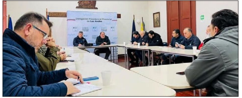
Realizan Comité de Gestión de Riesgo de Desastres biprovincial previo al arribo de un nuevo sistema frontal.

Respecto de la situación en el camino internacional, Aravena indicó que « el camino internacional en este momento está habilitado hasta 'Juncalillo', ya que hay nieve en el resto de la zona, pero también en la reunión