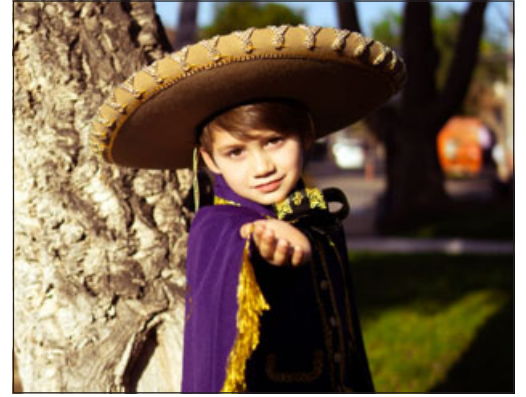
'El Charrito del Valle' se presentará este domingo en el restorán 'La Ruca'.