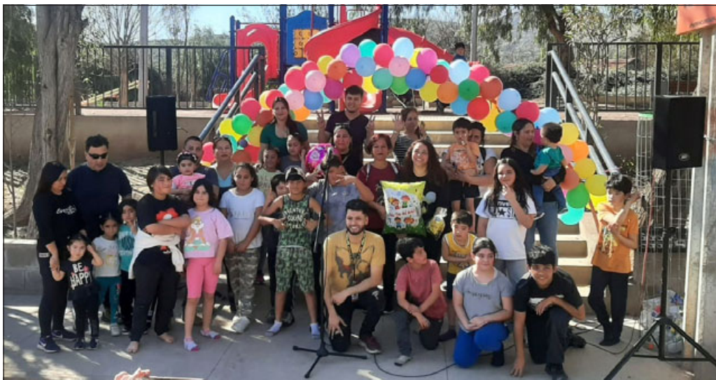
La celebración se llevó a cabo el pasado domingo 13 de agosto