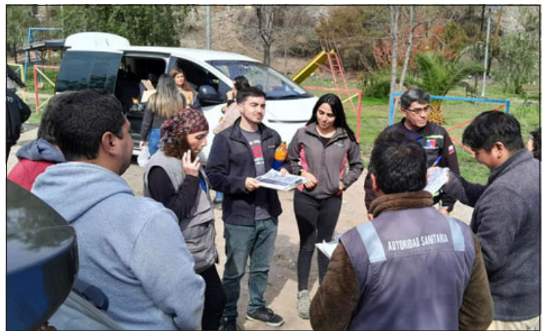
Trabajo de aplicación de químicos se extenderá hasta el 25 de agosto.

Junto con esto, el jefe de la Autoridad Sanitaria de Aconcagua enfatizó que en nuestra zona no se han detectado brotes de estas enfermedades propiamente tal, sólo han existido dos pacientes extranjeros que han ingresado a