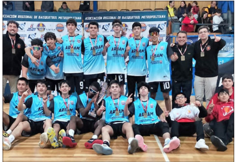
San Felipe Basket es el monarca de la serie U-15 de la Libcentro Menores.

Lo hecho por este conjunto U-15 tiene dimensiones mayores, si se tiene en cuenta que este club no tiene un gimnasio propio, y constantemente debe lidiar con la carencia de recintos que en la actualidad tiene la ciudad de