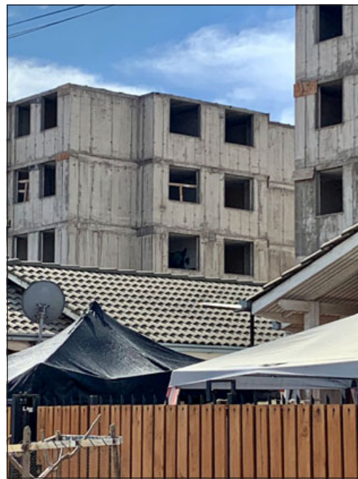
Estos son los departamentos abandonados desde donde se producen todos estos problemas.

Estos hechos ya se registran desde bastante tiempo y