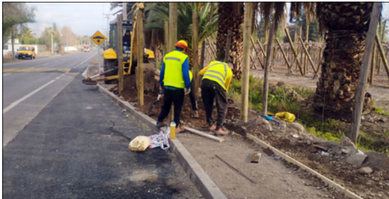
Los trabajos corresponden a un proyecto de seguridad vial orientado a reducir la velocidad de los vehículos y dar mayor seguridad a los transeúntes.