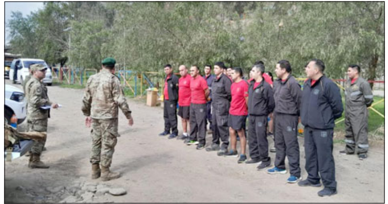
Con el apoyo del ejército de Chile, se comenzaron las labores de fumigación en el sector de El Sauce.

En concreto, la aplicación de estos productos químicos elimina estos insectos y tiene todo un protocolo en su aplicación para también resguardar la salud de las personas que viven en este sector. «Se utiliza este sistema rápido, pero requiere que los vecinos salgan del hogar por dos horas más una ventilación de una hora y después pueden regresar», precisó.