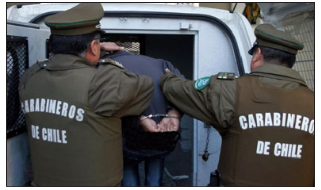
El imputado fue detenido en las inmediaciones luego de ser denunciado a Carabineros. (Imagen referencial)

Posteriormente Carabineros logró su detención en las inmediaciones, recuperando el dine-