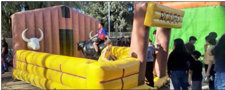
Pequeños disfrutaban del toro mecánico.

Finalmente, la presidenta de la Villa El Canelo indicó que la idea de esta celebración fue motivar a la comunidad para la realización de más actividades, así como conocerse y compartir entre todos. «Es algo de que estaba tan apagada la villa y ahora con esto se ve el entusiasmo de la gente, quiere participar, hay motivación ahora. La idea es unirnos entre todos; o sea, compartir entre todos los vecinos, conocernos y participar entre todos, donde la idea es seguir haciendo actividades para la villa; ahora para Navidad también seguir haciendo cosas, lo estamos programando», cerró.