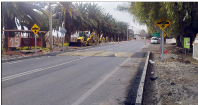
Un 'lomo de toro' o reductor de velocidad fue instalado en la ruta donde tantas muertes se han registrado.