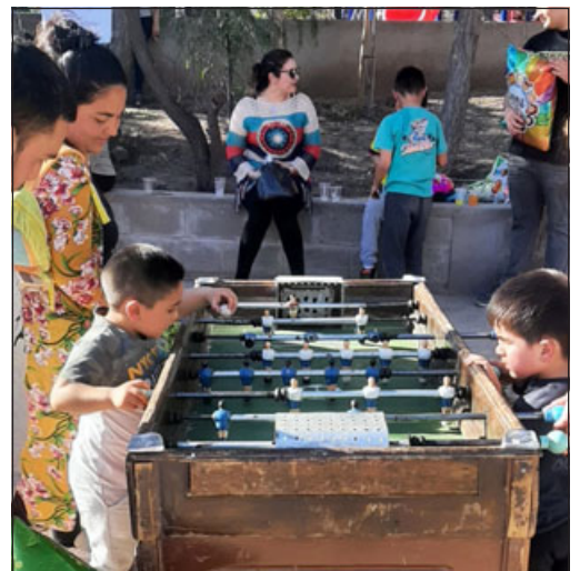
El taca-taca, una de las grandes atracciones para grandes y pequeños.