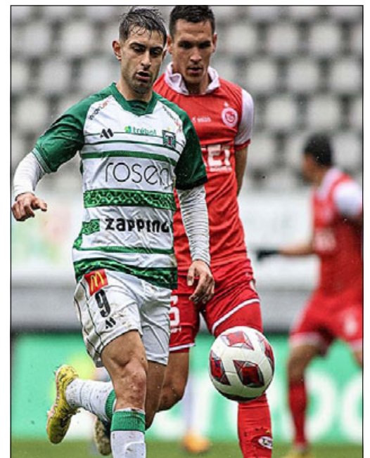
Unión San Felipe no pudo sumar puntos ante Deportes Temuco.

La arremetida albirroja no fue suficiente, pero al menos encontró un premio de consuelo en el golazo de Gonzalo