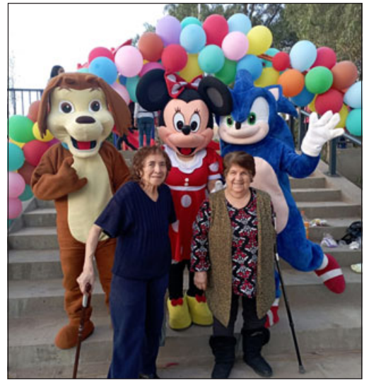
Adultas mayores también fueron parte de esta celebración, junto a los personajes animados: 'El Perro Chocoloro', 'Minnie' y 'Sonic'.

alta cooperación de los vecinos en cuanto a esta jornada, puesto que llevaron sus propios comestibles para compartir. «Lo que me gustó harto fue que la gente trajo, cooperó con bebidas, además de lo que teníamos nosotros, ellos traían; o sea, ellos traían su bebida, papas fritas, ramitas, para picar, para compartir entre todos. Participaron hartos vecinos, fue todo muy bonito», manifestó.