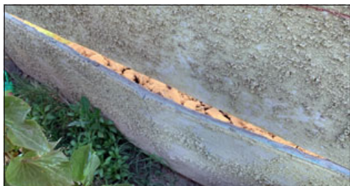
Esta es la pandeleta dañada que denuncia uno de los vecinos.