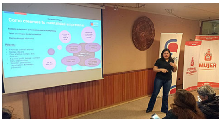
Las clases de la Escuela de Fortalecimiento Empresarial Femenino comenzaron el pasado miércoles y terminarán este jueves.

También Núñez detalló el número de participantes en este programa y la inscripción previa que realizaron. «Tenemos inscritas 45 mujeres, por cierto, hoy (miércoles) es un día de lluvia, que es más complicado, hay una merma de asistentes,