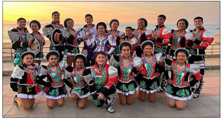
Acá los integrantes del Ballet Folklórico Parroquial Pangue de Panquehue.

- Sí, es mucha logística, porque tú tienes que atender a los bailarines, tenerles su camarín, sus colaciones, toda la implementación, el mobiliario, a como poder atenderlos. Además para esta ocasión vamos a tener, a partir del día jueves, alojados acá en nuestra zona a 40 personas de Aysén, porque como tenemos este intercambio con ellos, los tenemos que atender acá, primero nosotros de local y luego ellos en noviembre de visita ya en Cochrane en Caleta Tortel.