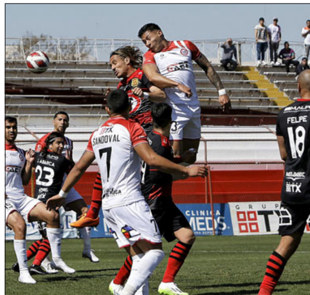
Unión San Felipe superó a Rangers en todas las facetas del juego.

camiseta de sus jugadores, algunos miembros de ella violentaron una puerta para hacer ingreso al campo de juego con el objetivo de 'apretar' al plantel. Acción repudiable, que no debe ser aceptada ni respaldada por nadie, por más que haya desesperación al ver que el club de sus amores empieza a hundirse en el fango.