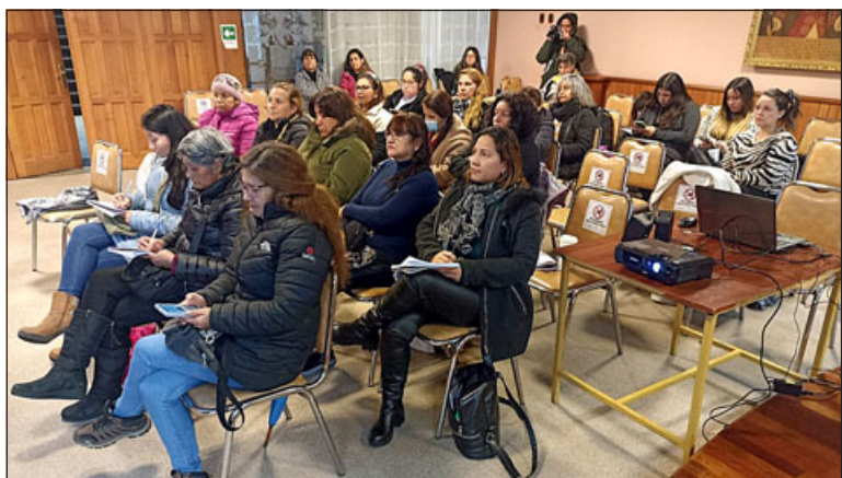
En la primera sesión se registró una participación de 25 emprendedoras, de un total de 45 inscritas.

«Hoy (miércoles) hay alrededor de 25, 30 mujeres que vinieron, de las cuales la mayoría y un grupo importante son de Panquehue, que son de las Mujeres Jefas de Hogar, que trabajan, además, con nuestras compañeras de ese programa en la comuna de Panquehue. Puede que abran algunos cupos, a lo mejor para las sesiones que siguen, que son mañana (jueves) y la próxima semana (presente) que se puedan incorporar a los nuevos cursos, que lo pueden hacer a través de la página de Sercotec o directamente en Fomento Productivo», cerró la coordinadora.