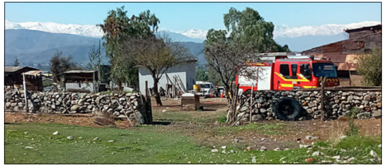
Una persona con movilidad reducida falleció al incendiarse su vivienda en el sector El Asiento.