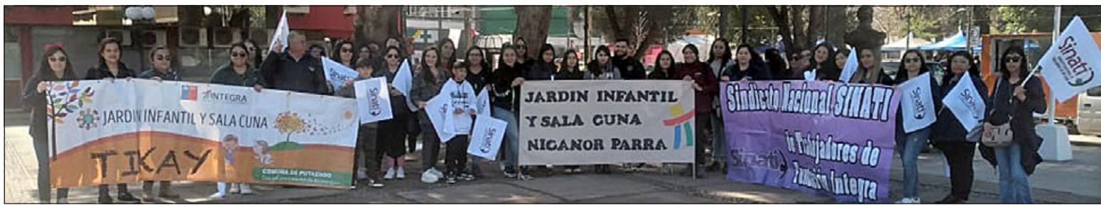
Más de una veintena de trabajadoras de Integra marcharon nuevamente en San Felipe.