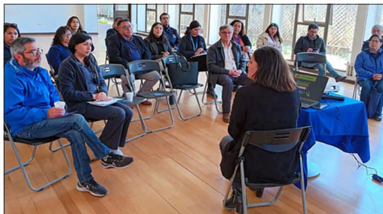
Subsecretaría de Prevención del Delito dio a conocer su oferta programática a equipos de seguridad de los seis municipios de la Provincia de San Felipe.

A través de este programa, la ciudadanía puede denunciar delitos como tráfico de drogas, tenencia, fabricación y contrabando de armas, violencia intrafamiliar, bandas o personas dedicadas al robo, comercio y recepción de bienes robados, delitos sexuales contra menores, robo de vehículos, placas patentes adulteradas, homicidios, trata de personas y tráfico de