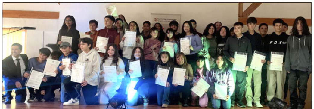
En total fueron certificados 70 estudiantes de inglés de todo el valle de Aconcagua.

les permite, especialmente a los niveles más altos, estudiar en el extranjero y recorrer el mundo con mayor facilidad al contar con un segundo idioma.