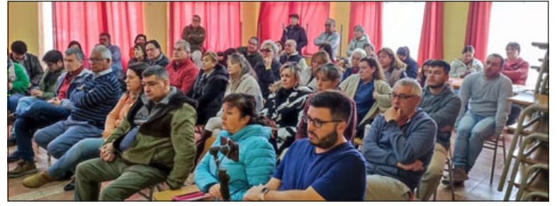
Una panorámica general de la reunión.

- Yo diría que en un 60%, no 100% conforme, por lo menos la Municipa-