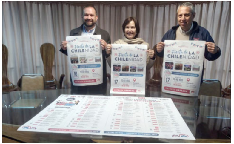
Municipio lanzó el programa de actividades del mes de Fiestas Patrias.

«Agregamos una fiesta de la chilenidad que por mucho tiempo no se había efectuado, estamos hablando del 16 y 17 de septiembre, vamos a tener actividades familiares en el palacio de la hacienda de Quilpué, en forma gratuita, áreas de artesanías, foodtruck, juegos típicos ade-