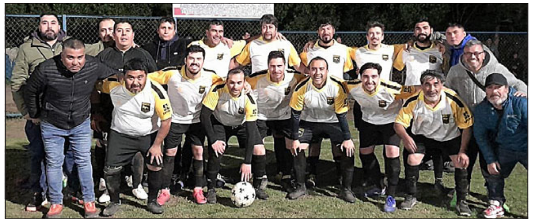
El Pentzke será finalista del Play Offs en la serie Sub-35 de la Asociación de Fútbol de San Felipe.

Pentzke empataron a 1, mismo resultado y marcador que arrojó el lance entre Ulises Vera y Juventud La Troya .