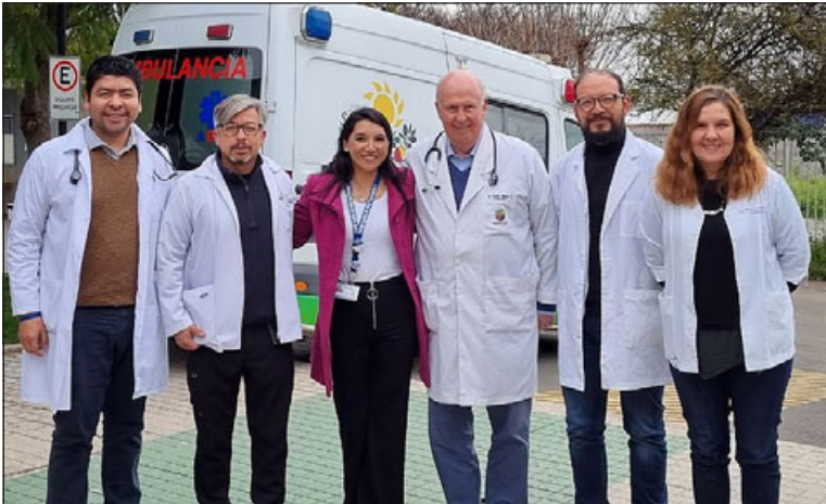
Tres cardiólogos y dos psiquiatras atendieron durante toda la mañana del sábado a 44 pacientes de la comuna de Santa María.

«Ser médico implica estar con nuestros pacientes, implica estar al servicio de nuestras comunidades y es un rol que el Colegio Médico Aconcagua ha ocupado y quiere seguir ocupando. Por supuesto nosotros somos un colegio profesional, sin embargo nuestro rol como agentes sociales no ha estado nunca de lado, hemos participado en múltiples campañas y esta es una instancia que estamos inaugurando en Santa María, esperamos poder seguir replicando e invitando a los demás colegas del valle que nos sigamos organizando, participando y gestionando este tipo de operativo en los distintos territorios».