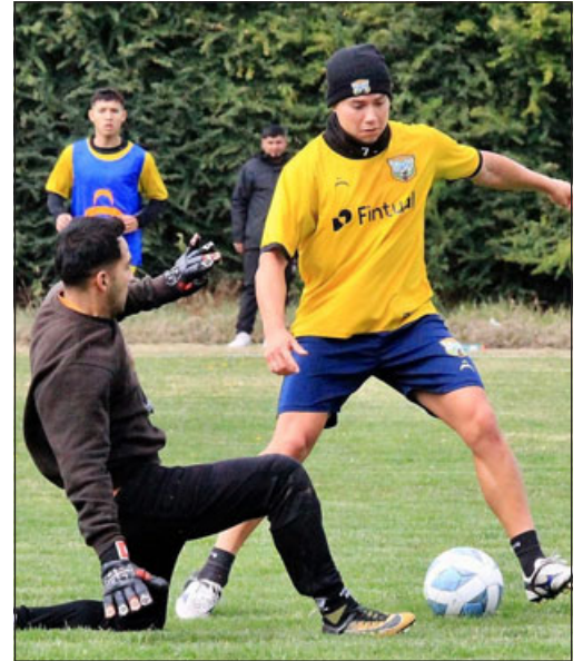
Trasandino en uno de sus entrenamientos de la semana pasada.

Al cierre de la presente edición de El Trabajo Deportivo , la ANFP aún no daba señales respecto al día y hora en el cual tendrán que medirse Trasandino y General Velásquez.