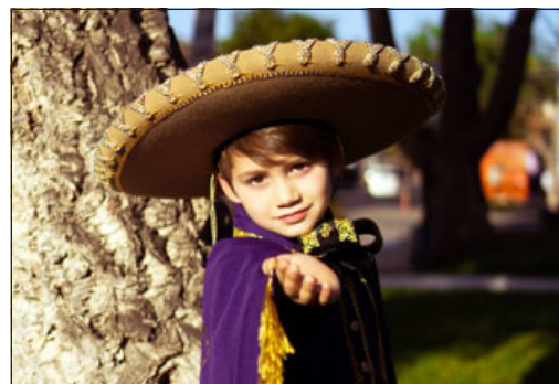
El 'Charrito del Valle'.