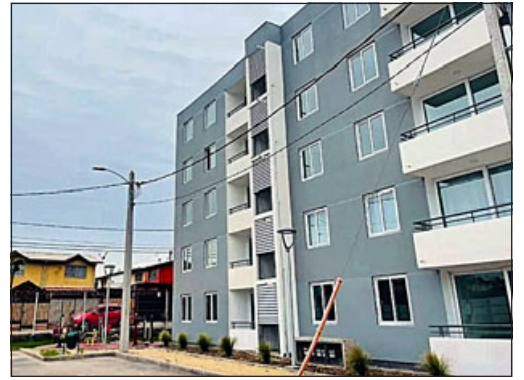
Estos son los departamentos entregados a estas 14 familias.