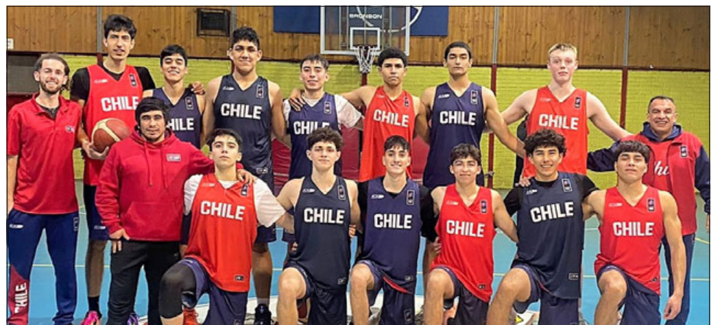
La Selección Chilena U-17 fue la gran atracción de la segunda versión de la 'Copa Dante Rodríguez'.