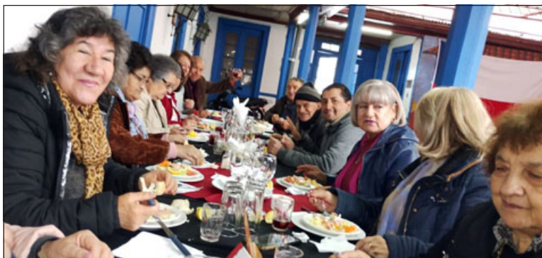
Los integrantes disfrutando del almuerzo.

Cabe destacar que en la actualidad la organización está formada por 30 dirigentes.