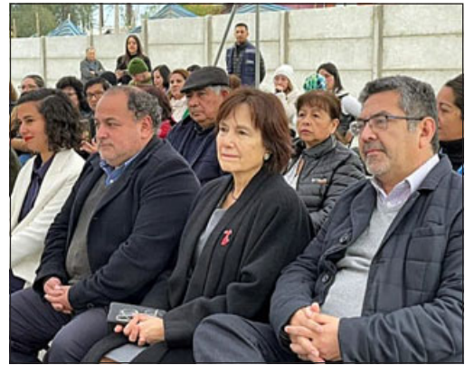
Con la presencia de diversas autoridades, las 14 familias recibieron las llaves de su casa propia.