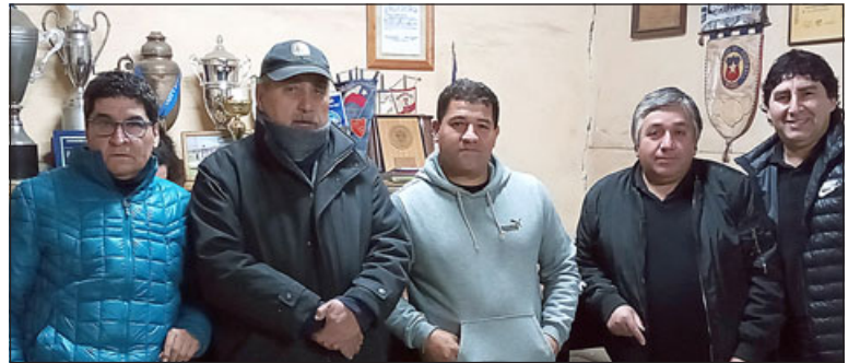
El 21 de septiembre asumirá el nuevo directorio de la Asociación de Fútbol de San Felipe.