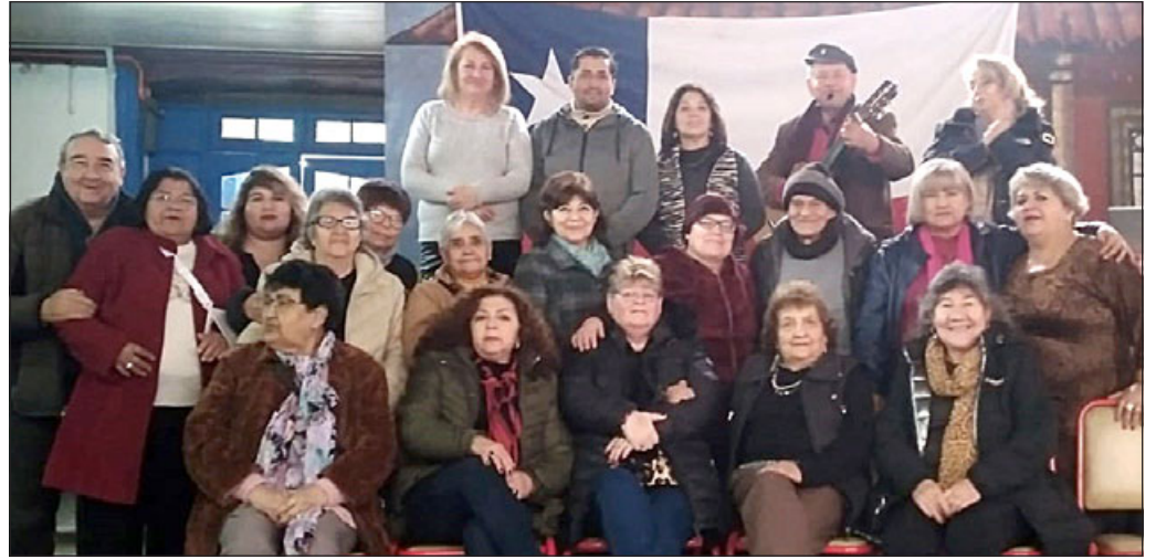
Integrantes de la escuela disfrutando de una reunión de camaradería, celebrando el Día del Dirigente y 'Pasamos Agosto'.

- ¿Cuál es la misión de la escuela 'La Razón