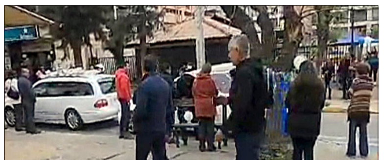
La pompa fúnebre pasando frente a su quiosco.