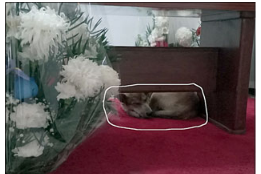
Su perro fiel 'Calambres' acompañando a su amo, como se ve en el círculo.

cortejo fúnebre enfiló por calle Merced pasando frente a su quiosco donde atendió a tantas personas, para luego llevarlo hasta el Cementerio de Catemu donde descansa en paz.