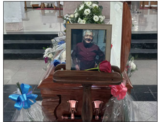
Un retrato en su urna con su sonrisa.