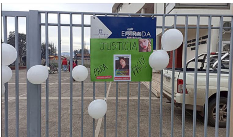
Con diferentes pancartas, la madre y amigas de Francisca esperaron la resolución de este caso.

«Como madre, cómo me siento yo al saber esta resolución, siendo que yo perdí a mi hija, lo más preciado y él en la calle, libre y firmando; es una injusticia, creo que no fue lo que yo esperaba, ya que yo esperaba cárcel para él y que los dos pagaran, tanto como ella (acompañante del conductor), que encubrió evidencia y tanto como él, que mató a mi hija», cerró.