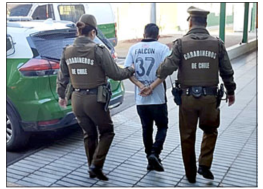
Sujeto fue detenido gracias a diligencias realizadas por personal de la SIP.

Asimismo, el Comisario precisó que «es una persona adulta, mayor de edad, con antecedentes policiales por lo que fue de