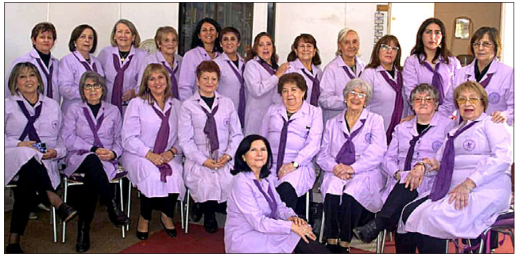
Las Damas de Lila cuentan con 25 voluntarias, de las cuales 22 están activas.

Un refrigerador, una lavadora, un juego de comedor, un televisor HD de 32 pulgadas, una reposera con quitasol, una