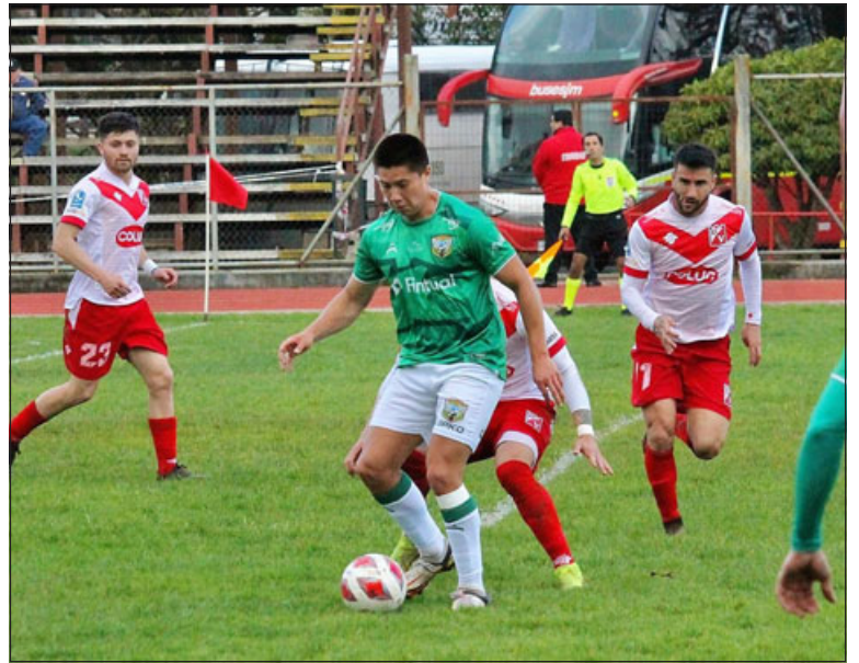
Puntos de oro son los que se jugará Trasandino en sus duelos recientemente reprogramados.