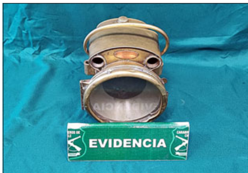
Carabineros recuperó farol de más de cien años robado desde el Museo Histórico de San Felipe.