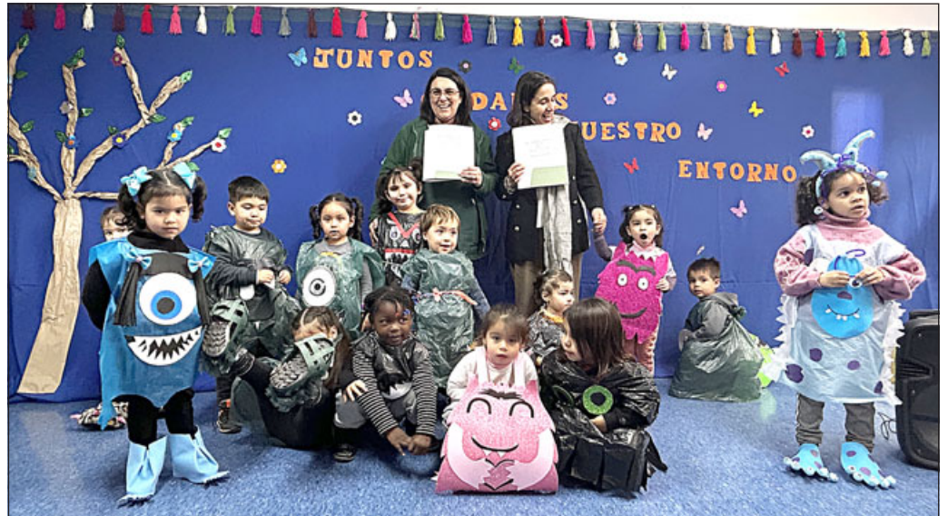
El Programa Vivo Curimón de Fundación Lepe, y Jardín Infantil Conejitos Saltarines, trabajarán en conjunto en la educación ambiental y el modelo de enseñanza 'aula al aire libre'.