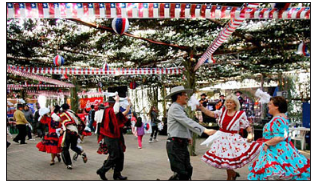
Las fondas y ramadas deben contar con todas sus autorizaciones para poder funcionar.

Además, uno de los llamados que realizó Méndez, tiene que ver con las solicitudes para eventos masivos, en donde expresó que «las solicitudes son todas electrónicas hoy en día y también las respuestas nuestras son rápidas en ese sentido, pero si es el llamado de que lo hagan a tiempo, estamos ya con los límites para poder recibir las solicitudes, no queremos solicitudes en el último minuto, porque no vamos a tener la capacidad para poder pronunciarnos nosotros como Autoridad Sanitaria para dar un sí o un no a ciertos establecimientos, locales o recintos donde se van a desarrollar estos eventos masivos de Fiestas Patrias, donde eso lo tenemos bastante coordinado, estamos ya evaluando las distintas comunas, de las 10 comunas, los recintos a través de las exigencias documentales primero y después en lo que se autoricen,