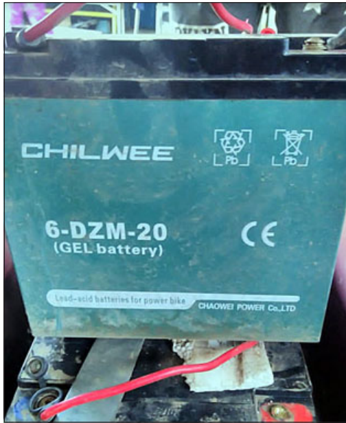
Este es el modelo de batería que necesita.

Sí hay alguna persona interesada en ayudarlo, puede dirigirse al frontis del Liceo de Hombres, ubicado en calle Santo Domingo.