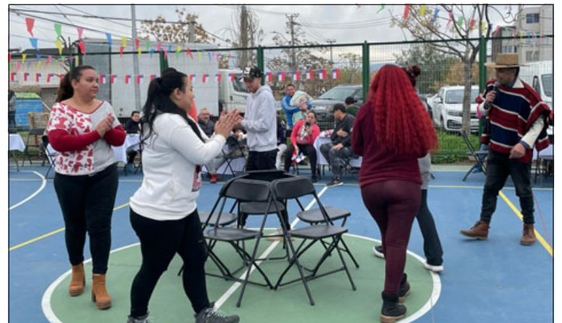
Antiguas y casi olvidados juegos tradicionales como tirar la cuerda o la sillita musical, cobraron vida en esta fiesta de la chilenidad.

les , presidenta de la Junta de Vecinos de Villa Hermanos Maristas, declaró que «la jornada estuvo súper entretenida y me parece emocionante que se hagan este tipo de actividades, además, es una instancia para unir a los vecinos con juegos tradicionales que se perdieron en el tiempo».