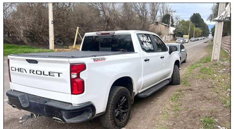
Esta es la camioneta en la que se movilizaba la persona herida de bala.