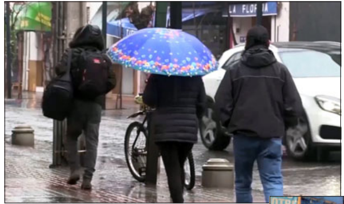
Entre 18 y 28 milímetros de agua dejó el sistema frontal en Aconcagua.

Respecto del pronóstico para los próximos días y si