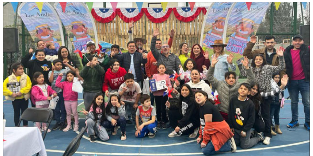
En la villa Hermanos Maristas se realizó la primera 'Revanca del Guatón Loyola', actividad que se estará replicando en otros barrios andinos.

les , presidenta de la Junta de Vecinos de Villa Hermanos Maristas, declaró que «la jornada estuvo súper entretenida y me parece emocionante que se hagan este tipo de actividades, además, es una instancia para unir a los vecinos con juegos tradicionales que se perdieron en el tiempo».