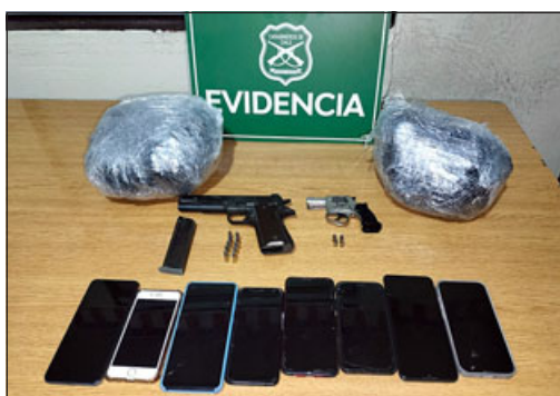
Esta es la droga y las armas incautadas a estos extranjeros.

Los sujetos, cuatro colombianos y un venezolano, fueron detenidos y registran domicilio en la comuna de La Ligua.