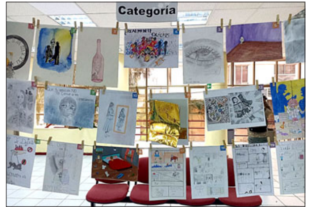
Los dibujos y cómics están siendo expuestos en la Tesorería Municipal de San Felipe.