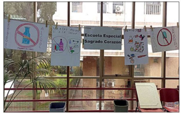
Categoría especial de dibujos Escuela Sagrado Corazón.