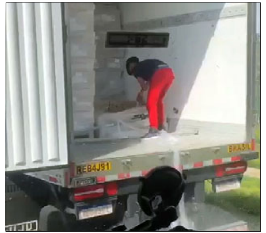
A plena luz del día, los antisociales robaron parte de la carga de este camión.

transportaba carne de cerdo, de procedencia brasileña, y lograron sustraer un pallet de carga, esto generó que llegara personal policial al lugar y se lograra la dispersión de estos sujetos, huyendo en distintas direcciones, puntualmente a la población Alto Aconcagua».