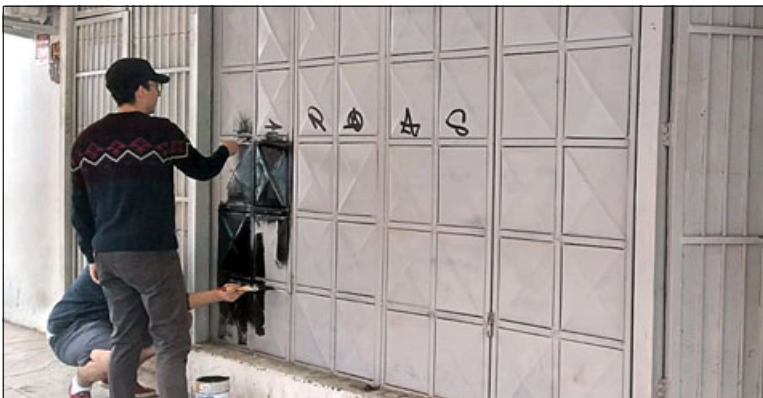
Estos son los rayados que indican fueron el 'marcaje' que hicieron los delincuentes.

Asimismo, Ángelo Miranda precisó que «en joyas aproximadamente unos 5 millones y en dinero otros 5 millones, que eran ahorros de toda la vida de mis papás y los dejó super mal económicamente eso. Mi tío comentó que eran chilenos, totalmente 'flaites', eran sujetos malos», cerró.