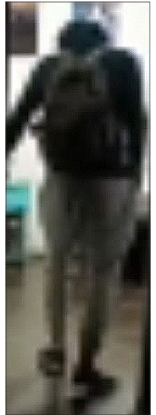
Acá la imagen del solitario delincuente que tiene de casero a vecinos de Rinconada de Silva y sus alrededores.

Recordar que días atrás en la comuna de Putaendo se supo de la llegada de una camioneta para prestar vigilancia y apoyo a Carabineros en el combate contra la delincuencia.