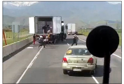
Momento en el que un grupo de delincuentes saqueó este camión.

Es así que «estos individuos lograron abrir un camión que