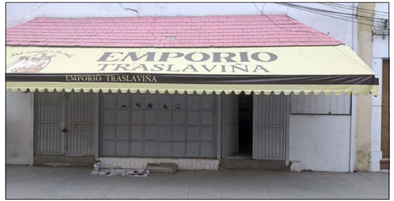
Millonario robo afectó al 'Emporio Traslaviña' durante la madrugada del jueves.

afecta y que los obliga a tener que invertir nuevamente en seguridad, «ahora nos vamos a ver enfrentados a la obligación de colocar cámaras y poner mayor seguridad, estamos hace 2 meses en el local y no pensábamos que nos íbamos a encontrar con la brutalidad de este tipo de hechos», sostuvo el dueño del 'Emporio Traslaviña'.