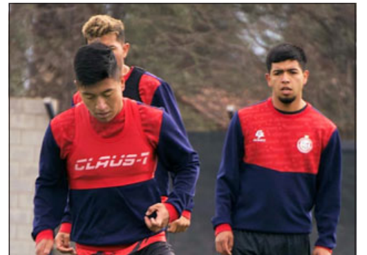
Unión San Felipe está obligado a sumar en Calama para no poner en riesgo sus opciones de postemporada.