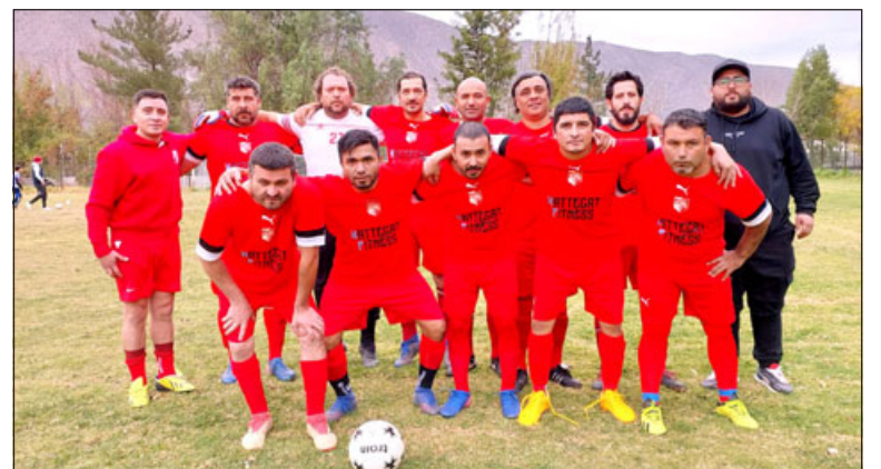
Dos Amigos de Putaendo será local frente a la Villa Minera Andina.

El resto de la fecha en la que intervendrán los otros conjuntos aconcagüinos, es la siguiente: