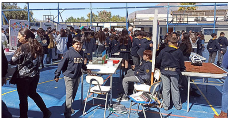
La instancia reunió a una gran cantidad de alumnos de distintos colegios, más los 120 alumnos exponentes.

29 años de esta actividad que hace nuestro colegio. Lo que podemos hacer, es que los científicos del futuro se proyecten, para que más adelante puedan pensar más estas cosas, como investigar, tener más ideas sobre lo que es y que no se queden solamente con una materia, sino que puedan crecer, que eso es algo en lo que nos ayudan mucho los profesores aportando algo a nuestras personalidades, en donde por lo menos a mí desde chica siempre me gustó mucho la muestra científica, y gracias a eso sé que me gustan las carreras que tienen que ver con el lado de la medicina, quizás con laboratorios», cerró.