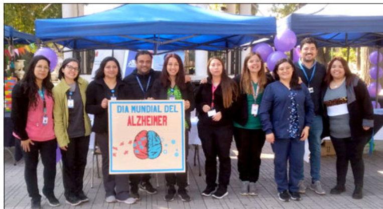
Profesionales de la Unidad de la Memoria del SSA realizaron campaña educativa en la Plaza de Armas de San Felipe.

«En la Unidad de Memoria lo que vemos es la sobrecarga del cuidador, es una enfermedad que transcurre desde el tiempo en que se diagnostica al paciente, hasta que fallece a quien cuidamos, lo hemos visto bien se-