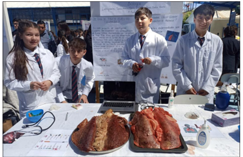
Exposición respecto al daño que causa el tabaco en los pulmones.

En relación al tiempo que se lleva realizando esta actividad, la cual cumple 29 años en esta edición, estableció que «ha sido muy potente justamente, porque hay varios exalumnos en este minuto, ahora como apoderados y que recuerdan su paso, donde imagínate, después de 29 años realizando este tema, donde hemos tenido lapsos de tiempo que no se ha podido realizar, por ejemplo, en la época de pandemia, pero aún así se ha mantenido en el tiempo y ha sido una experiencia muy enriquecedora, tanto para los niños como para los futuros profesionales, que después llegan contando que gracias a es-