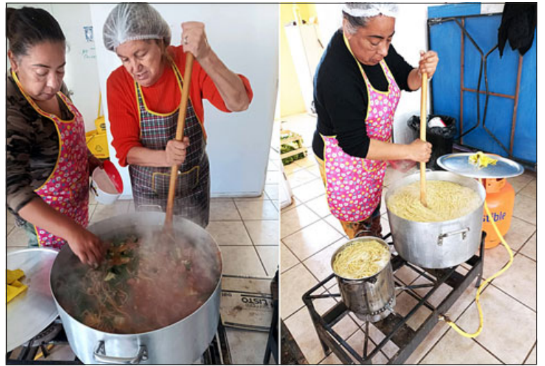
Los Regalones de la Olla repartieron cerca de cuatro mil almuerzos esta temporada.