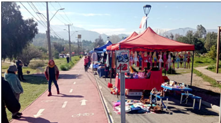
Son 50 locatarios quienes ofrecerán sus productos en el inicio de esta feria.

«Con esta oportunidad que me da Diario El Trabajo , quiero informarle a toda la comunidad de Putaendo y alrededores, para que se acerque al Parque Puente Cimbra a una nueva feria de emprendimiento de Putaendo, donde están los locatarios esperando para darles la mejor atención y los mejores precios para los productos que ellos tienen», cerró.