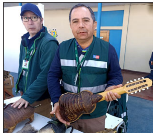
El SAG concientizó a los alumnos respecto de las prendas y elementos que contengan partes animales, tal como este charango de Quirquincho.