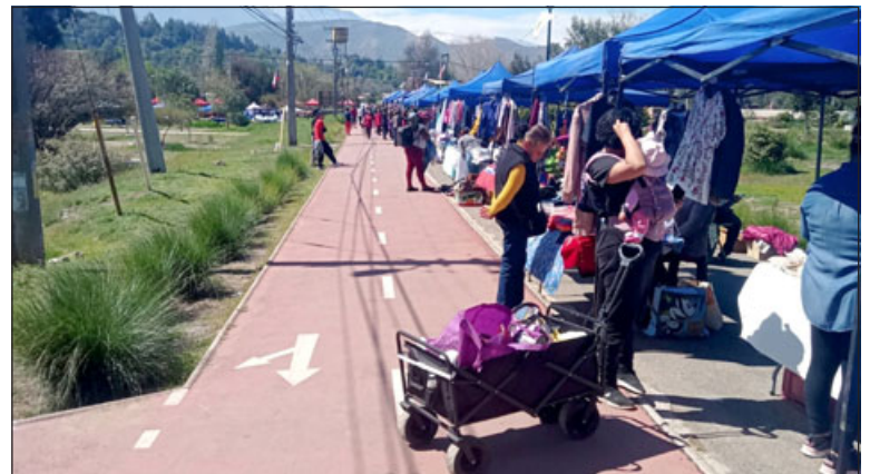
Luego de unas semanas de marcha blanca, la feria comienza de manera oficial este domingo.