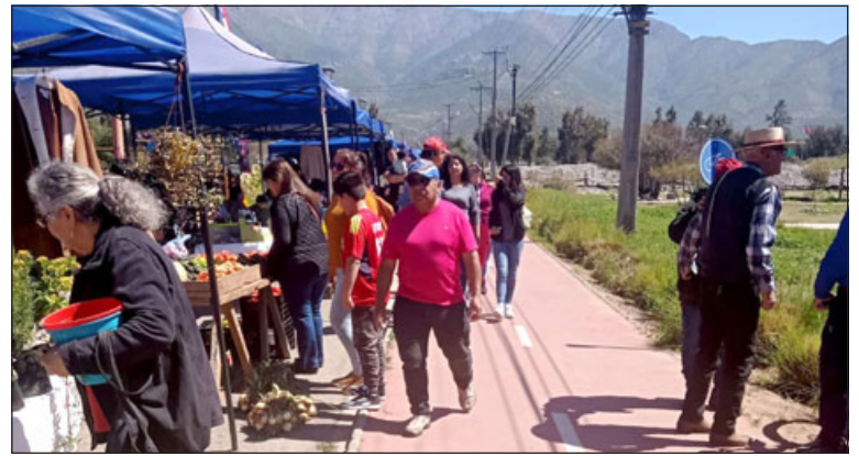
La nueva Feria de Emprendedores de Putaendo, se instalará este domingo en el Parque Puente Cimbre.

También indicó en donde estarán ofreciendo sus productos a la comunidad. «Claro, se van a vender todos los artículos que se puedan necesitar para lavar, también verduras, ropa, productos de aseo, productos para las mascotas, flores, todo eso y no es Feria de las Pulgas, es feria libre, donde no se va a usar nada en el suelo.