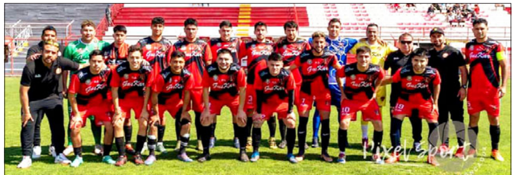
Uno de los representantes de San Felipe en los Regionales de la ARFA.