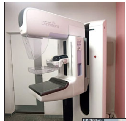
Máquina mamógrafo con el que se realiza este importante examen.

«Esas son las principales características, ahora, el dolor también es importante, pero muchas veces es necesarios el tener una mamografía precoz, en mujeres de 50 a 69 y también de 40 años, o cuando la