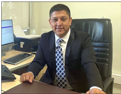
El aconcagüino fue uno de los 30 ganadores, entre más de 1.000 nominados.

«Lo que más me deja tranquilo, más que el premio en sí, que obviamente se agradece, es que durante 9 años hemos cambiado la manera de hacer clases y eso significa cambiar la vida de algunos estudiantes; estudiantes de colegios municipales que a lo mejor no tienen acceso a otras cosas, pero el hecho de que tú le des una educación distinta, con las tecnologías, con una metodología distinta o diferente, a ellos los potencia», cerró.