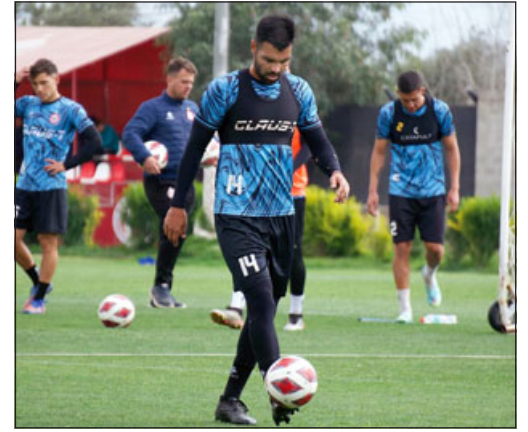
Un mal resultado puede poner en serio riesgo la clasificación de los albirrojos a la postemporada.