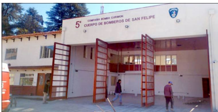
En la imagen se puede apreciar el frontis del nuevo cuartel de Bomberos de Curimón.

cambios de fachada, donde hay que hacer aumentos y disminuciones de obras que arrojan ciertos diferenciales, y este diferencial hoy día es de alrededor de los 29 millones de pesos, los que han sido solicitados al Gobierno Regional el día 27 de septiembre para su apro-