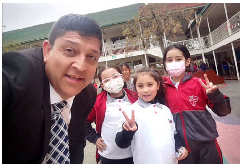
El director del Colegio San Fernando junto a algunos de los estudiantes.

En relación a la innovación tecnológica detalló que «ellos (jueces) evalúan todos los aspectos que tienen que ver en como los directores propician para los profesores y estudiantes, mejoras o proyectos tecnológicos. En el caso particular mío, yo estuve seis años en el Liceo América haciendo innovaciones y dentro de eso creamos un laboratorio de fabricación digital y el Liceo América obviamente después de seis años repuntó muchísimo. Posteriormente me fui a Catemu, al Liceo de Catemu y también hicimos un laboratorio de fabricación digital, también desarrollamos tecnología y en el colegio donde estoy actualmente estamos haciendo dos laboratorios de fabricación digital, más algunas asignaturas que tienen que ver con la innovación tecnológica. En el caso particular mío, ellos miran mucho mi trayecto-