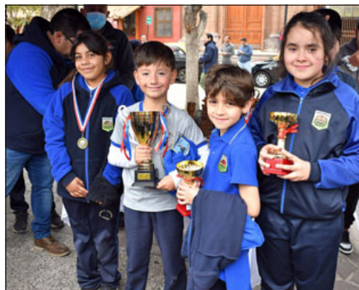
Jugadores con sus respectivos premios.