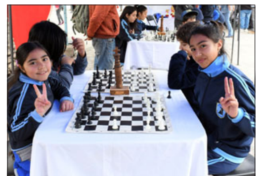
Dos jugadoras saludando a nuestro medio.