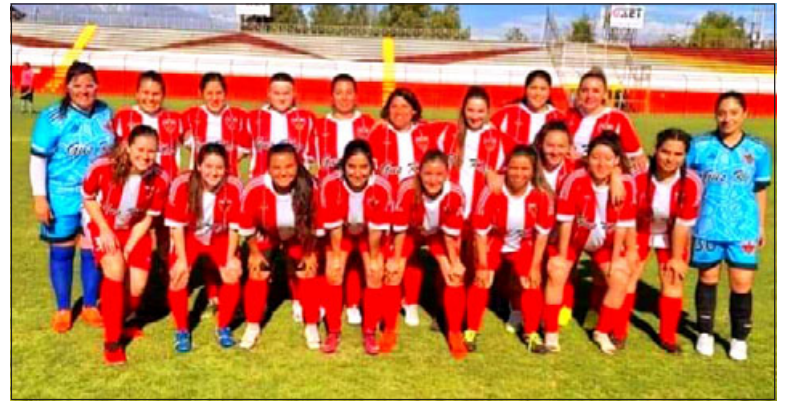
San Felipe se impuso claramente a su similar de Santa María.