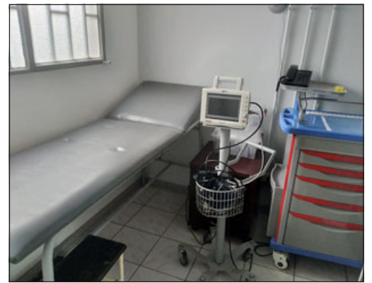
Estas son parte de las nuevas instalaciones del Hospital de Día.