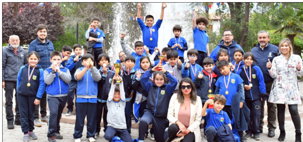
Triunfadores junto a concejales de Putaendo.