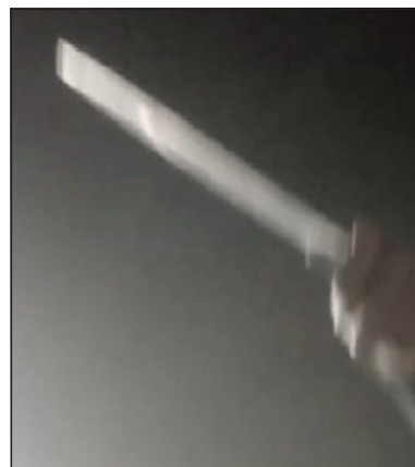
Esta es una de las armas blancas utilizadas en el momento de la riña.

Asimismo, y a raíz de este hecho, tres personas resultaron detenidas cuando llegaron al recinto hospitalario de San Felipe a cons-