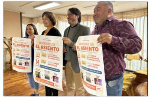
Municipio y dirigentes vecinales en lanzamiento del show artístico por nuevo aniversario de El Asiento.

Respecto del show preparado para este sábado, «la fiesta va a ser maravillosa que se ha organizado y estamos felices porque el trabajo serio está rindiendo frutos, la invitación para toda la comunidad para disfrutar en familia, conocer un lugar maravilloso