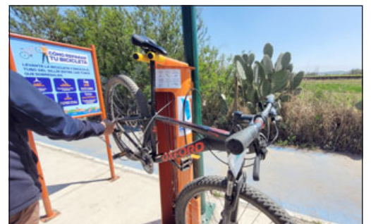
La útil y práctica estación de reparación será de gran utilidad para ciclistas, de ahí el llamado a cuidarla.

Finalmente, el directivo hizo un llamado a la conciencia y a