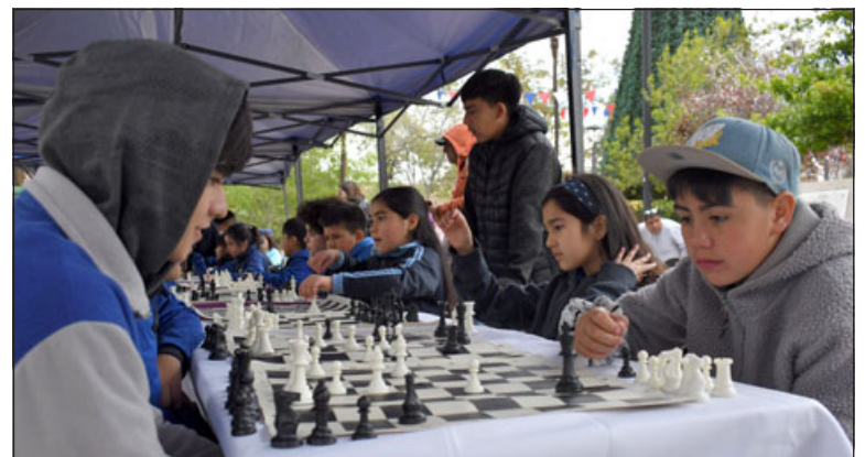
Acá uno de los jugadores con la mirada atenta para ver qué jugada hará su contrincante.