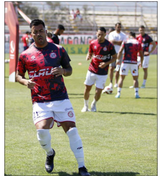
Unión San Felipe deberá jugarse sus opciones de liguilla frente al colista Puerto Montt.

Felipe – Puerto Montt Universidad de Concepción