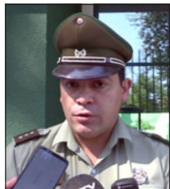
Capitán Rafael Ramírez.

SIAT a realizar las diligencias y se realiza la denuncia respectiva al Ministerio Público », cerró.