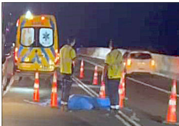
El cruzar la ruta en un sector indebido habría causado el accidente que costó la vida a un hombre en la Ruta 60 CH la madrugada de este domingo.

esto ocurrió en la ruta frente a la Toma Yevide, en donde un peatón cruza la autopista en un paso no habilitado y lamentablemente se origina este accidente vehicular, este atropello, donde el conductor de este vehículo, por la oscuridad, no se percata de la presencia del peatón en la autopista ».