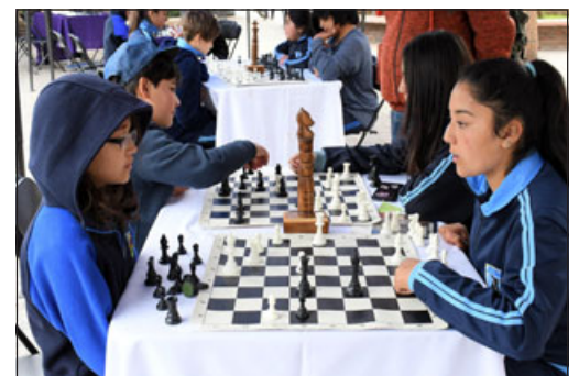
Jugadores presentes también en un cara a cara.