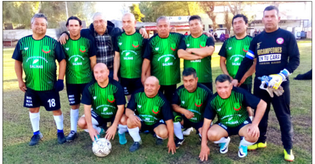
Andacollo está ubicado en el quinto puesto con 12 puntos.

Villa Argelia 2 – Aconcagua 1; Barcelona 2 – Resto del Mundo 1; Los Amigos 2 – Pedro Aguirre Cerda 0; Unión Esperanza 2 – Carlos Barrera 0; Andacollo 3 – Hernán Pérez Quijanes 1;