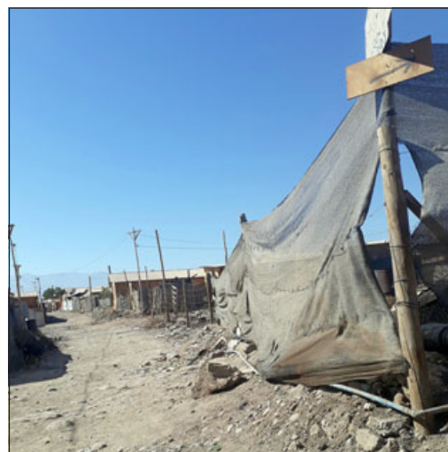
La Toma Yevide, desde sus inicios, ha registrado una gran cantidad de incendios estructurales, además de otras problemáticas asociadas a hechos delictivos.

«En esta segunda reunión, también abordamos las coordinacio-