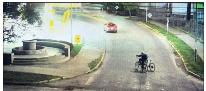
Recuperan dos bicicletas robadas en San Felipe.

Asimismo, Olivares destacó que este trabajo se desarrolló con « las cámaras de la central de nuestro municipio, la