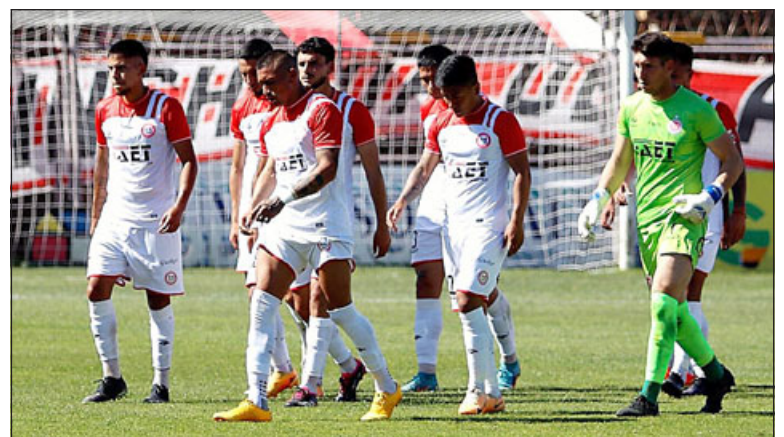
La dirigencia albirroja solicitó que todos los equipos con opciones de liguilla jueguen de manera simultánea.

El reclamo de los albirrojos tiene que ver con el hecho que el partido entre Deportes La Serena y Deportes Antofagasta, no se programó de manera simultánea al que sostendrá el Uní Uní con Deportes Puerto Montt. «Deportes La Serena, involucrado directamente en la definición de cupos para la Liguilla, jugará su partido un día después de los otros tres equipos en disputa, con una evidente e injustificada ventaja deportiva», dice parte del texto que la tarde del lunes recién pasado se hizo llegar al presidente de la