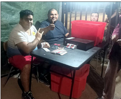
Atentos en la entrada cobrando los cartones.