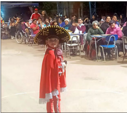
'El Charrito' del Valle de Aconcagua deleitando con su voz a los presentes.

así porque ese mismo año me detectaron cáncer de mamas, después de quimios, radios, me vino esto ahora. Entonces uno le da gracias al Señor día a día por un día más, y que le gente joven se cuide, que no tomen las cosas a la ligera porque todos vamos para allá. Mis hijos son trabajadores, mi familia, mi hermano. Mi viejo se va a las seis de la mañana y llega a las siete de la tarde de vuelta y me quedo todo el día sola. Uno cuando va al hospital y ve gente que está peor que uno y dice «bueno, Dios ha sido generoso conmigo». Le doy gracias al Señor, no soy evangélica ni católica, pero aprendí a conocer a Dios, al Señor, porque uno en estos momentos se aferra a él y gracias a toda la gente de buen corazón, los que aportaron, los que fueron a mi vecina que estoy súper agradecida de mi nuera, mis hijos, ese día trabajaron todos, andaban corriendo, mi viejo, así es que muchas gracias, muchas, muchas gracias.