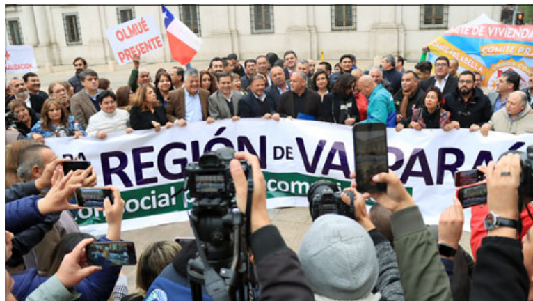
Alcaldes de Aconcagua llegaron a Santiago para ser parte de esta manifestación.

Respecto de cuándo podría haber una respuesta de parte del Gobierno, Díaz sostuvo que «estamos esperando