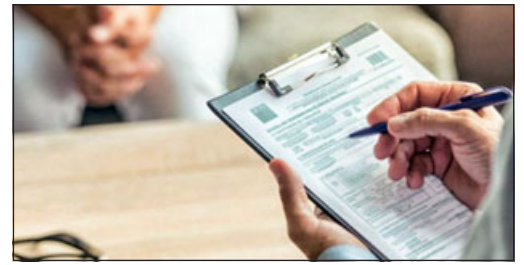
La fiscalía local formalizó investigación contra un médico por la emisión de más de mil licencias médicas presuntamente falsas.

otra cautelar más, pero el tribunal solamente fijó el arraigo nacional.