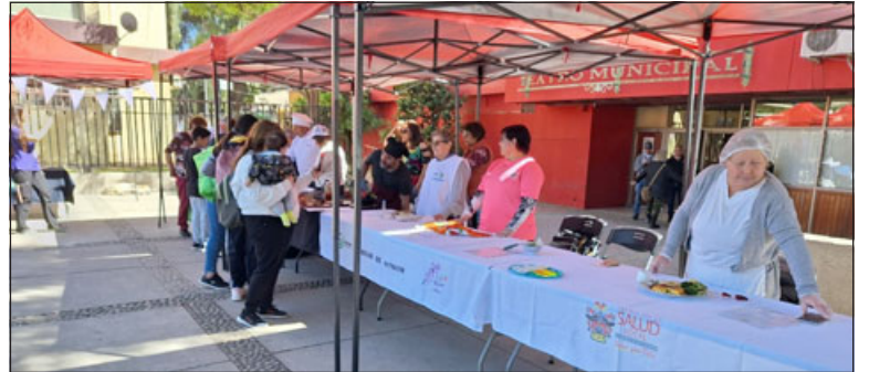
Algunos de los presentes degustaron las preparaciones saludables.