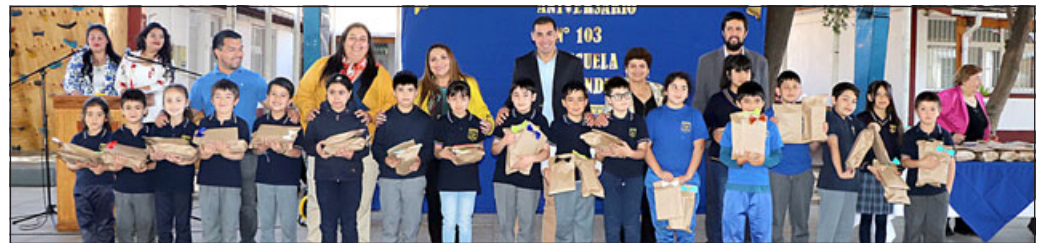
La Escuela Independencia de La Pirca, en Panquehue, estuvo celebrando su 103º aniversario, culminando las actividades con una ceremonia de distinciones a alumnos y profesores.