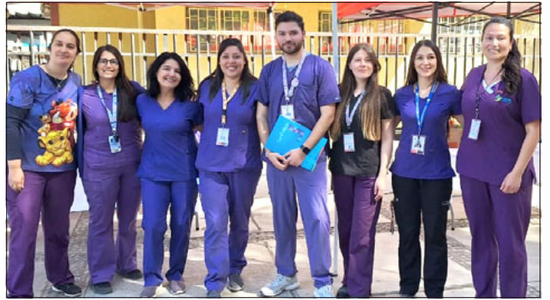
Equipos del Cesfam Segismundo Iturra y del Cesfam de Curimón presentes en esta actividad.

«Como unidad siempre incentivamos la alimentación saludable, el entorno saludable, esto fue una instancia para compartir con toda la comuni-