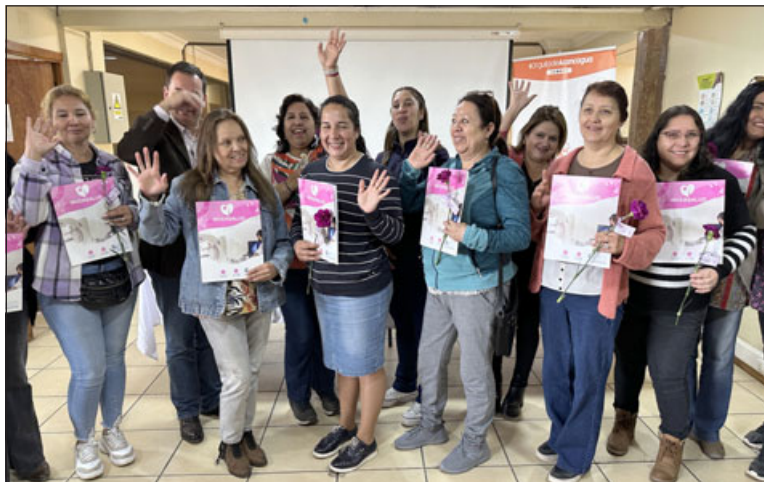
Las beneficiarias pertenecen al Programa Seguridades y Oportunidades, y a distintos talleres femeninos.

res que por motivos económicos no han podido someterse a este importante procedimiento médico.