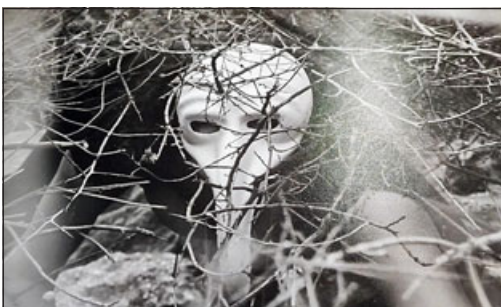
Con un concepto místico retratado en Las Coimas, Putaendo.

rar sus redes sociales, donde tenemos Instagram, que es @bibliotecasmunisanelipe, que es donde vamos a estar sufriendo toda la información de próximas actividades que estamos realizando, para que nos puedan seguir todos los que estén interesados en actividades culturales, de fomento lector y de todo tipo de actividades que tengan que ver con el desarrollo de la cultura y el patrimonio en el Valle del Aconcagua», concluyó.