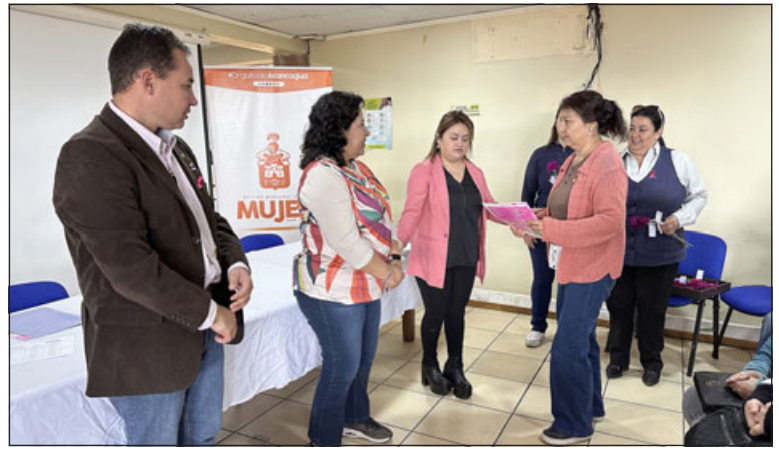
Un total de 16 sanfelipeñas fueron beneficiadas con exámenes gratuitos de mamografía, quienes recibieron sus resultados en una sencilla ceremonia realizada para el efecto.

que este beneficio se enmarca dentro del Mes de la Prevención del Cáncer de Mamas y tiene por objetivo sensibilizar a la población femenina sobre la importancia de realizarse este examen, además de colaborar con aquellas muje-