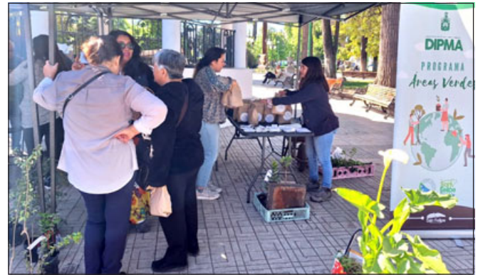
Vecinos en el intercambio de semillas y plantas.

Cientos de personas llegaron hasta la Plaza de Armas para