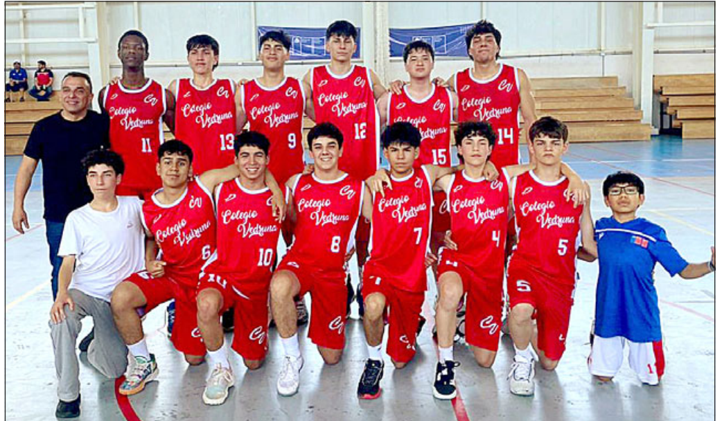
El Colegio Vedruna es el flamante campeón regional de básquetbol en la serie Sub-17.