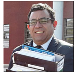
Fiscal Benjamín Santibáñez Contreras, a cargo del caso.

encima, se empujan entre ellos y mi representado para golpearlo. Uno de ellos comienza a golpear una mochila al piso y luego de ello se produce el ingreso, golpeándolo a lo menos 6 veces en la cara, provocándole lesiones que no sé por qué no están en el informe de la BH, tampoco están las fotografías donde se ven las lesiones de mi representado, por lo tanto lo desestabilizan porque son golpes certeros en su cien, nariz, en su ojo izquierdo, y en esas circunstancias, sabiendo estas personas que tiene el arma, estando a lo menos sobre 20-25 metros en el interior de la propiedad de él, pasado ya la esfera de custodia del cierre perimetral, se le abalanzan después de haberlo golpeado, y él en ese momento saca su arma, la prepara y como puede, golpeado, dispara en 3 ó 4 ocasiones, no lo recuerdo en este momento», indica.