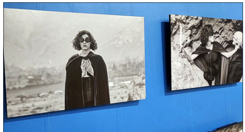
La exposición fotográfica estará hasta este 31 de octubre.