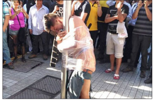
El ciudadano boliviano fue detenido por transeúntes y atado a un poste para que no escapara. (Imagen referencial)

En ese sentido el juez acogió la petición de la fiscalía y se amplió la detención del imputado hasta el 19 de octubre de 2023, oportunidad en la que será formalizado.