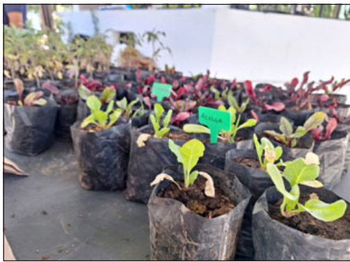
Almácigos de vegetales también se entregaron.

hacer este intercambio de especies, en donde, además, el equipo de la Dipma entregó semillas de diversos vegetales a quienes concurren a la actividad.