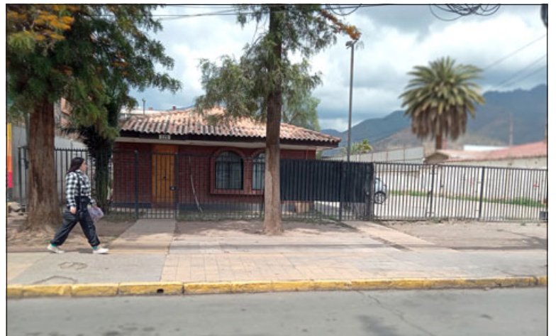
En calle Merced había un paradero donde las personas esperaban la locomoción a Los Andes, el cual fue retirado del lugar.

- Sólo Los Andes. Recordar que el Plan de Gestión de Tránsito se implementó a mediados del año 2019, generando un tremendo impacto con el cambio de sentido de algunas calles, lo que hasta el día de hoy se ha mantenido pese a los graves trastornos y mayor congestión de tránsito que genera.