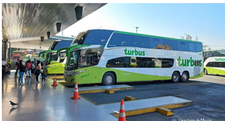
Próximamente veremos una de estas máquinas de Turbus posada en uno de los andenes del terminal de San Felipe.

Las Becas Deportivas nacen durante la administración de la alcaldesa Carmen Castillo Taucher, como un beneficio económico destinado a deportistas destacados de la comuna de San Felipe, que practican disciplinas de manera sistemática de alta exigencia, distintas al deporte recreativo, y que no poseen los recursos necesarios para cubrir los gastos de indumentaria, traslados, suplementación nutricional, inscripción en competencias, entre otros gastos que implica el desarrollo de sus respectivas disciplinas.