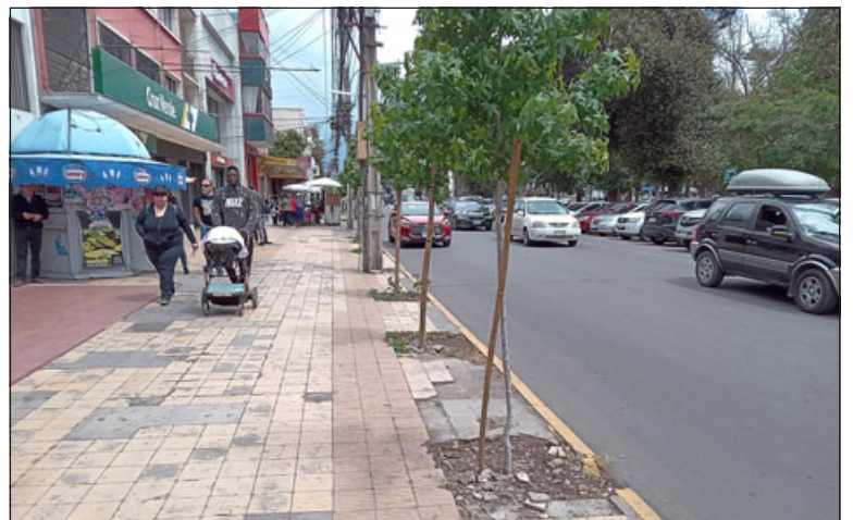
Calle Merced, arteria por donde añoran volver a pasar los buses a Los Andes.