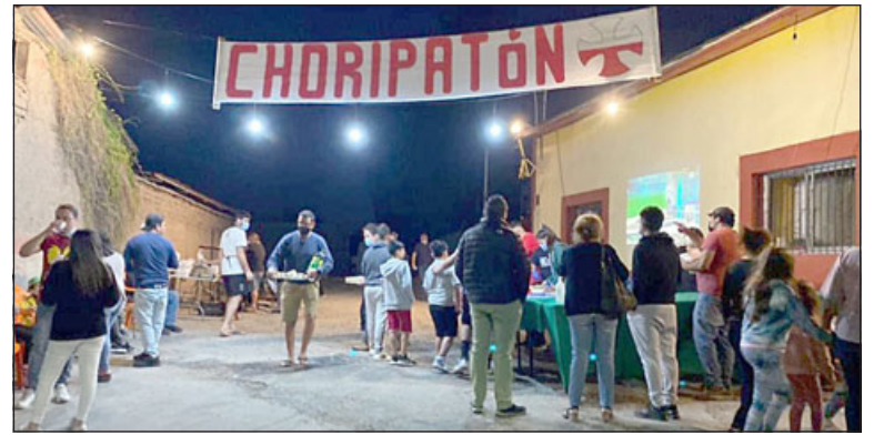
La 'Choripatón' lleva cerca de 10 años realizándose en Belisario Montenegro N°189, sector de Almendral Alto.

En cuanto a la expectativa que se tiene de recaudación para este 2023 y el mecanismo que tienen para donar los fondos recaudados, indicó que «el año pasado se recaudó un millón y fracción, un millón cien o doscientos (mil pesos). Nosotros tenemos carnicería aparte, tenemos la Carnicería de Santa María, que es la Aconcagua, pero la de Santa María, no la de San Felipe, entonces, nuestra familia y la otra familia del socio de mi tío, igualan siempre el monto. El año pasado fueron un millón doscientos