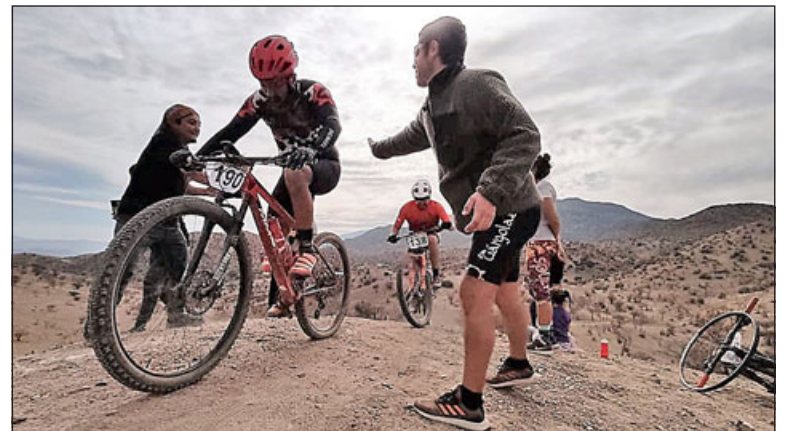
Con la presencia de destacados exponentes, este domingo llegará a su fin el XCM Quinta Cordillera.

El evento deportivo con el que el Quinta Cordillera cerrará el 2023, se iniciará a las 8 de la mañana, teniendo previsto finalizar a las 4 de la tarde.