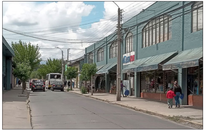
Un bus de la empresa Puma al fondo pasando por calle Freire, hasta donde llegan muy pocos pasajeros a Los Andes, según señalan desde la empresa.

- Sólo Los Andes. Recordar que el Plan de Gestión de Tránsito se implementó a mediados del año 2019, generando un tremendo impacto con el cambio de sentido de algunas calles, lo que hasta el día de hoy se ha mantenido pese a los graves trastornos y mayor congestión de tránsito que genera.