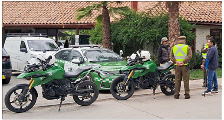
Carabineros estuvo desplegado en los cementerios de la zona.

Asimismo, y en cuanto a los servicios desplegados en los cementerios por el día de todos los santos y considerando la gran con-