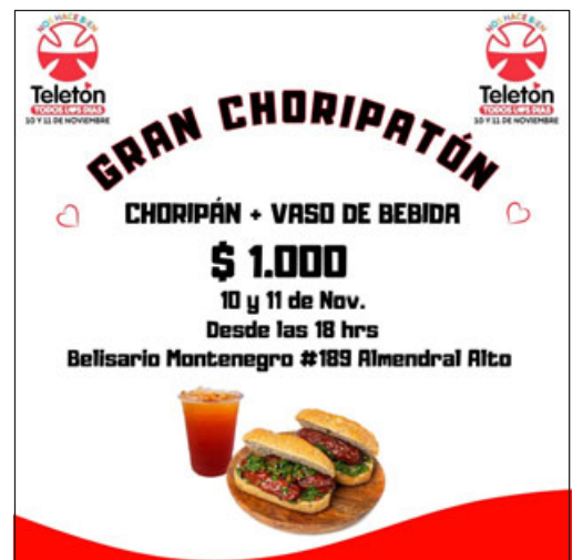
La 'Choripatón' se realizará el viernes 10 y sábado 11 de noviembre.