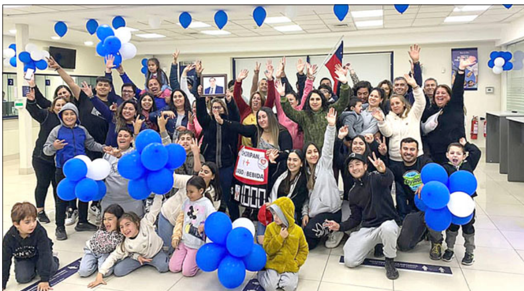
El clan familiar llegando a donar lo recaudado, este pasado 2022.

dejo a todos cordialmente invitados a visitarnos en Almendral Alto N°189, con el fin de ayudar y cooperar con la Teletón, en una gran 'Choripatón', la cual organiza mi familia todos los años, así que los esperamos para poder superar el monto del año pasado y que todos podamos llegar a la meta, que es lo más importante», cerró.