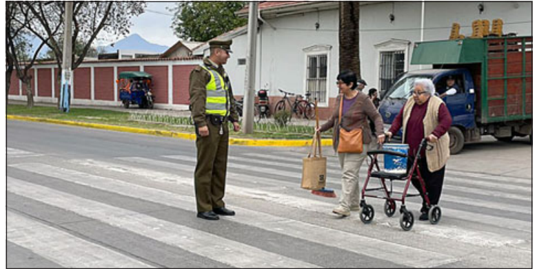
Personal policial controló el tránsito para evitar accidentes.

currencia de personas a los camposantos, el Comisario de Carabineros sostuvo que «el 1 de noviembre, tuvimos una gran llegada