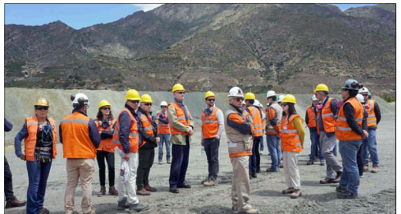
Diversas autoridades locales y regionales visitaron la mañana de este jueves las instalaciones de la Planta Catemu del holding minero Cemin.

El recorrido por la Planta Catemu fue guiado por representantes de la compañía minera, y las autoridades pudieron visitar la zona de chancado y aglomerado, que actualmente cuenta con un encapsulado de sus chancadores primarios y filtros de polvo, que permiten tener un eficaz control de las emisiones de material particulado