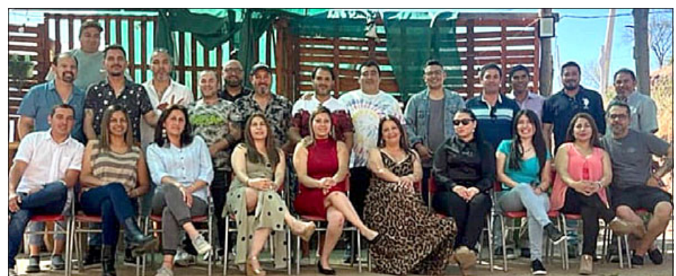
Tras 25 años, se volvieron a juntar para compartir.