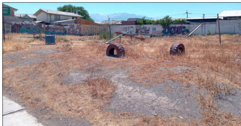
En este lugar y después de 20 años de espera, se supone que ahora sí va la sede comunitaria de Villa La Estancia.

- Es todos los días, además el acceso de camiones que llevan trigo ahí al molino, son camiones con acoplados que estamos viendo que están haciendo tira lo que es la calle, la calzada; los buses