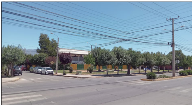
Jardín Infantil 'Burbujitas de Colores' de Villa La Estancia.

Al finalizar dice que los vecinos que todas estas situaciones son molestas para tener una buena calidad de vida; « la bulla sobre todo es muy molesta », concluye.