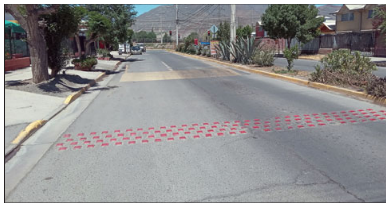
Estos son los lomos de toro instalados en la avenida principal.

también y bueno, por lo general en las noches son más los ruidos molestos de esos autos enchulados, que no es tanta la velocidad que llevan para el ruido que meten.