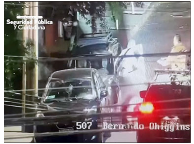
Detienen a dos delincuentes cuando robaban un auto en calle Salinas.