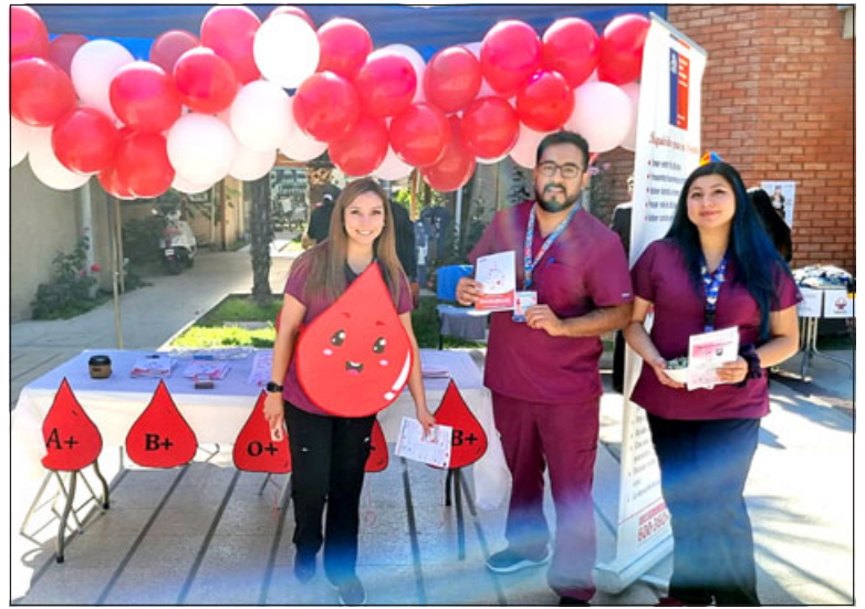
Hospital San Camilo realizó campaña para fomentar la donación de sangre.

tecnólogo médico supervisor de la unidad de medicina de transfusión del Hospital San Camilo, explicó que «la intención de esta actividad, es un stand informativo que quisimos hacer para informar a la gente, como derribando mitos, y la idea es captar nuevos donantes para aumentar nuestra base de datos y tener un stock de unidades de sangre para los requerimientos del establecimiento».