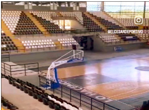
En este espectacular coliseo se jugará el Sudamericano U-17.

Más de cien competidores reunió la última fecha del Quinta Cordillera en Santa María.