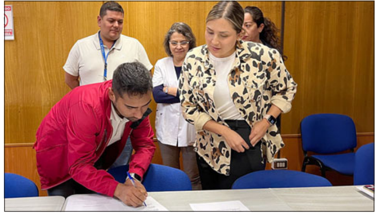
Gremios de la salud y autoridades llegaron a acuerdo por el paro del Cosam de San Felipe.