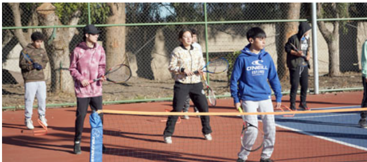
Las primeras clases se impartirán este viernes 10 y sábado 11 de noviembre, en la cancha de tenis ubicada al interior del Estadio Municipal Los Libertadores de La Pirca.

Quienes deseen ser un donante altruista, se pueden contactar a través de las redes sociales 'Dona Sangra San Felipe' en Instagram, o bien llamando al número 342-492332, ó al whatsapp +569 40241739.