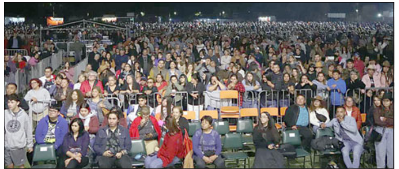
El evento se realizará los días viernes 05 y sábado 06 de enero de 2024, en las instalaciones del estadio Municipal Los Libertadores del sector La Pirca. (Foto archivo).

Podrán participar en este certamen, todos los intérpretes de género internacional en idioma español, sin restricciones de tema, ni estilo, quienes deberán tener un mínimo de 18 años, sin tope de edad. Los intérpretes deberán