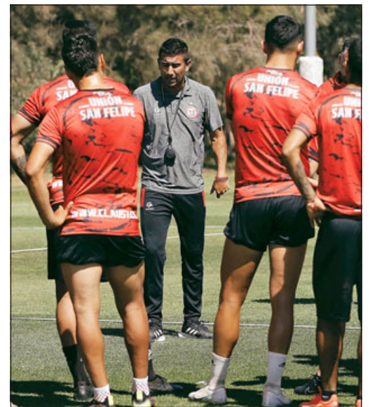
El estratega no dudó en afirmar que el equipo albirrojo recuperó la competitividad.

nos alcances de lo que ha sido este periodo de preparación. El estratega hizo un balance muy positivo de estas semanas. «Pudimos tra-