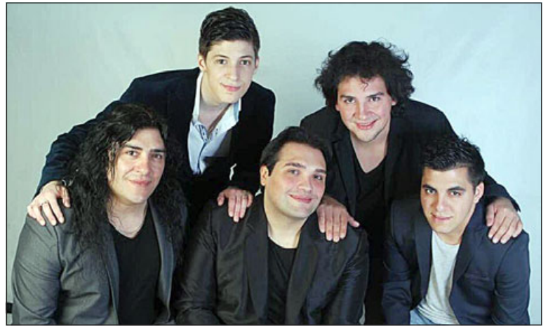
Aunque sin su vocalista Cristián Rodríguez, fallecido en junio, ‘Garras de Amor’ será el plato fuerte del show Teletón.

Es así como «el municipio con diversos actores de la ciudadanía, han organizado un evento con el objeto de que los artistas locales participen, artistas