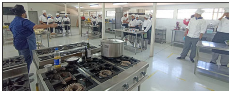
Se impartirán cursos de capacitación, entrega de nuevos productos y la posibilidad de práctica para los estudiantes.

Finalmente, el director destacó el nuevo convenio, así como las gestiones de Rotary Club San Felipe. «Me alegra mucho que Rotary, que también es parte de mi vida, haya pensado en nuestra escuela para lograr concretar algún tipo de convenio, que permita matizar más todavía lo que es el trabajo que hacen nuestros profesores, para lograr que se formen apropiadamente, de tal manera que sean jóvenes ordenados, disciplinados, respetuosos, amantes de Dios, amantes de la patria, preocupados por hacer las cosas cada día mejor y buscar la forma de insertarse en la sociedad para poder aportar», concluyó.