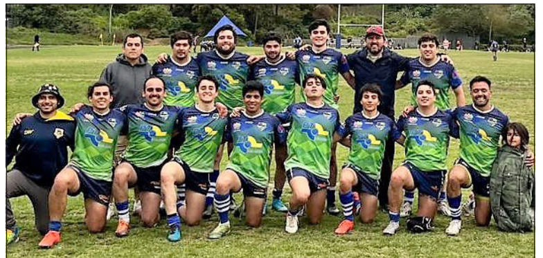
Los Halcones están teniendo una gran campaña en el torneo Carudes.

mana, el quince callelargo deberá enfrenar a los All Brads , en un duelo que con toda seguridad estará agendado para las cinco de la tarde de este sábado en el estadio Municipal de Calle Larga, recinto que probablemente también albergue otro encuentro de la ovalada.