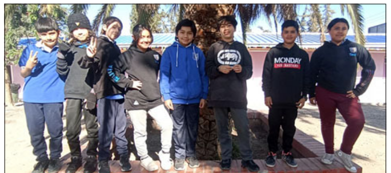
Los pequeños estudiantes del taller de teatro.