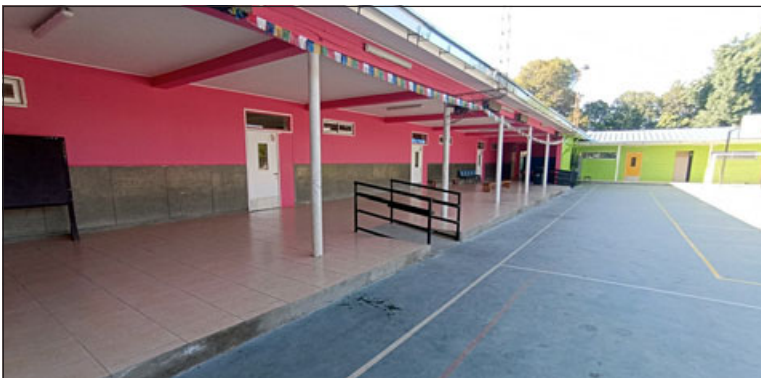
El establecimiento sanfelipeño reconoció un crecimiento en las áreas artísticas, acompañada de la remodelación en su infraestructura y fachada.