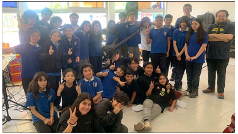
La delegación de los talleres de teatro y música está compuesta por 31 alumnos.