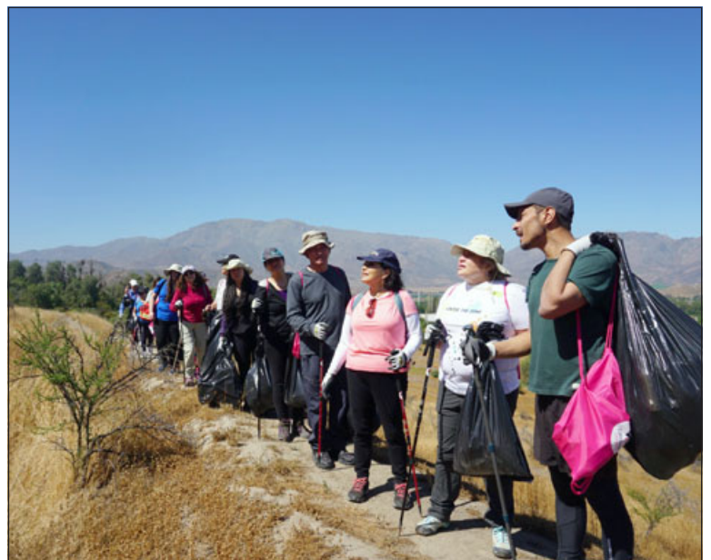
Salir a caminar al aire libre y aprovechar de recoger basura, es sin duda una actividad que beneficia doblemente a residentes del sector.