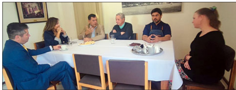
En reunión de este miércoles, se hizo oficial el convenio de la Escuela Agrícola y la empresa 'Puratos'.

«Para las capacitaciones que se realizarán el día 15 y 24 de noviembre, desde las 09:00 de la mañana hasta las 13:00 horas, asistirán dos técnicos de la empresa 'Puratos' en cada uno, como encargados de dichas capacitaciones. En estos cursos, los chicos podrán conocer productos nuevos, innovadores, tales como queque de pascua, donde les van a