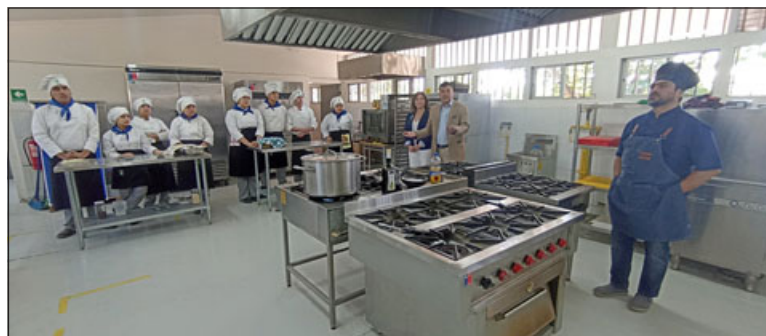
Serán más de 70 alumnos los beneficiados con este convenio.