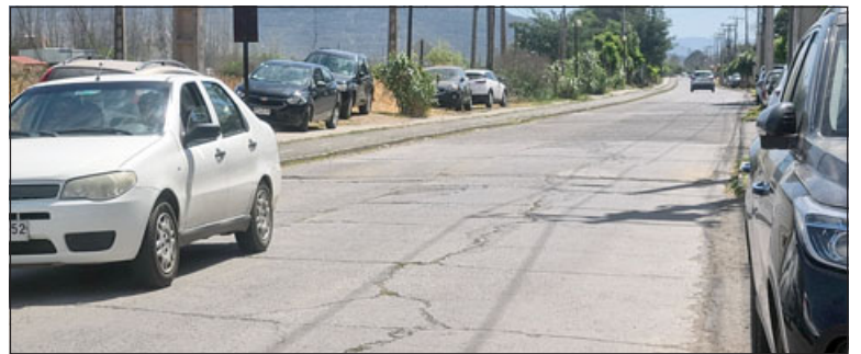
Llay Llay ha desarrollado una ambiciosa cartera de proyectos para mejorar el estado de a lo menos cinco arterias muy transitadas en la comuna.

varias líneas de financiamiento, para ejecutar el año 2024. Son cinco iniciativas distintas, que suman un monto cercano a los 3 mil millones de pesos, que involucran distintas arterias principales de la comuna como Manuel Rodríguez; O'Higgins; Callejón San Jesús; Avenida Costanera, Avenida Balmaceda en el Puente Merino, la Intersección de Santiago Bueras con Ignacio Carrera Pinto y otras iniciativas que se encuentran en desarrollo, pero que en definitiva, buscan dar solución a problemas rea-