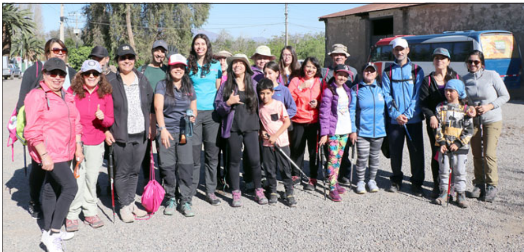
Grandes y chicos disfrutaron de la actividad organizada entre el Cesfam José Joaquín Aguirre y las oficinas municipales de Turismo y Medioambiente.

«Pueden caminar, andar en canoa, paseo en patineta, montar bicicleta, cualquier forma que elijan para salir y moverse», detallaron en su sitio web.