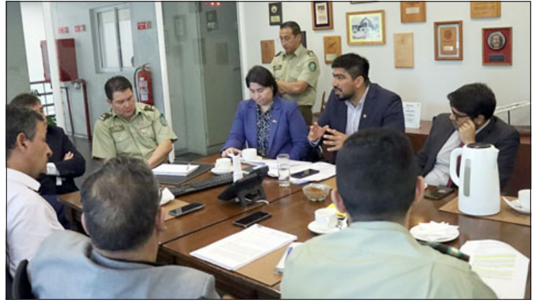
Encargada nacional del Plan Estadio Seguro sostuvo reunión por duelo entre Unión San Felipe y Santiago Wanderers.

Finalmente, desde Carabineros aseguraron que ya está dis-