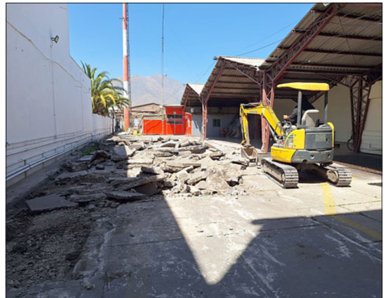
Comenzaron obras de mejoramiento en el cuartel de la Primera Compañía de Bomberos.

Trabajos que involucrarán en algún momento alguna « molestia » en la vía pública; « ofrecer de inmediato las disculpas a la comunidad que circula por la Plaza de San Felipe, donde en algunos momentos vamos a ocupar