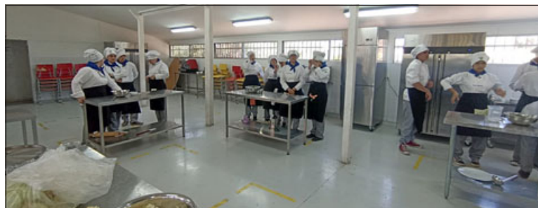
Alumnos de Gastronomía de la Escuela Agrícola en una de sus clases.

incorporar cremas, coberturas, algunas premezclas, relleno, con el fin de ayudar en sus técnicas, además de lograr la mejor versión del producto. Esto los llevará a conocer técnicas innovadoras, para que al salir de su etapa de estudio e incorporarse al mundo laboral, puedan conocer los productos de vanguardia y un sinfín de elaboraciones que pueden lograr con ello.