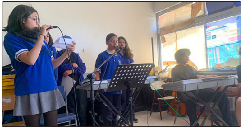
Ambos talleres realizan sus últimos ensayos antes de emprender su viaje a la Región de Los Lagos.

es ir creciendo y potenciar todo el talento del valle, porque acá hay niños muy talentosos, y la idea siempre sería hacer un liceo artístico, con enseñanza media, porque claramente después de octavo, qué pasa con todo este talento también», cerró.