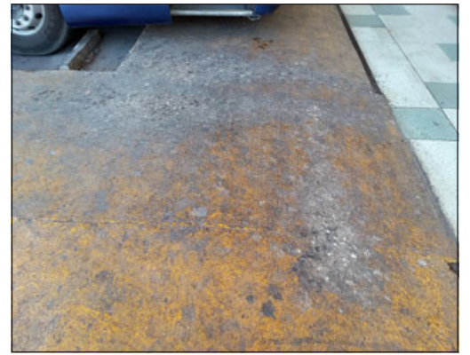
Acá una muestra de las fecas en el piso del terminal.

- Generalmente hay reclamos, pero aquí tú ves que hay un servicio de aseo, tratan de lidiar con mucha gente que también no bota la basura donde corresponde. El servicio acá es continuo 24/7, hay otro que es prestado por la empresa Veolia que tiene un funcionario en un horario determinado; hay lugares donde pueden depo-