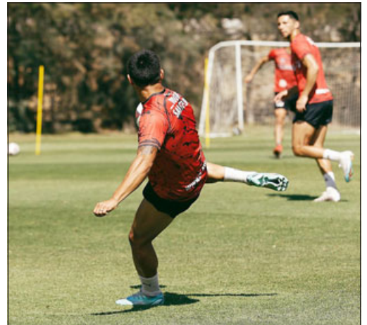
Los sanfelipeños están obligados a ganar si quieren llegar con opciones a la revancha.

En el mini torneo todos parten de cero, por lo que está muy claro que si las declaraciones de Víctor Rivero están en lo correcto, el Uní Uní habrá vuel-