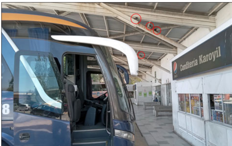
Palomas en el techo presenciando el día en el terminal.