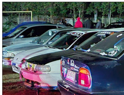
Alrededor de 30 automóviles llegaron a participar en este evento.

se las dependencias del estadio Ejército Libertador de Curimón, ya que es muy lindo un evento en cancha, los autos se veían espectaculares ahí. Al recibir los niños era otra cosa, podían jugar, saltar, correr sin peligro alguno; una experiencia muy linda trabajar con niños, hacerles actividades, se agradece mucho. Espero que apoyen el deporte del Tuning, la gente del Valle del Aconcagua, a los niños. También dar los agradecimientos a la Federación Tuning Chile, de la cual nosotros somos el único club del Valle del Aconcagua que somos federados, y ahora activando Met Aconcagua somos 14 clubes que nos estamos uniendo para seguir trabajando con niños, en su beneficio, haciendo eventos para que la gente vea que el Tuning es un mundo, pero de fierros, pero es uno maravilloso, más que los fierros... una familia. Se agradece con el alma todo lo que han hecho y muchas gracias se despiden Car Tuning», concluye.