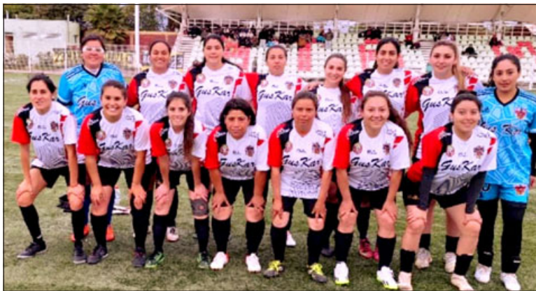
La selección de San Felipe es protagonista en el Regional femenino.