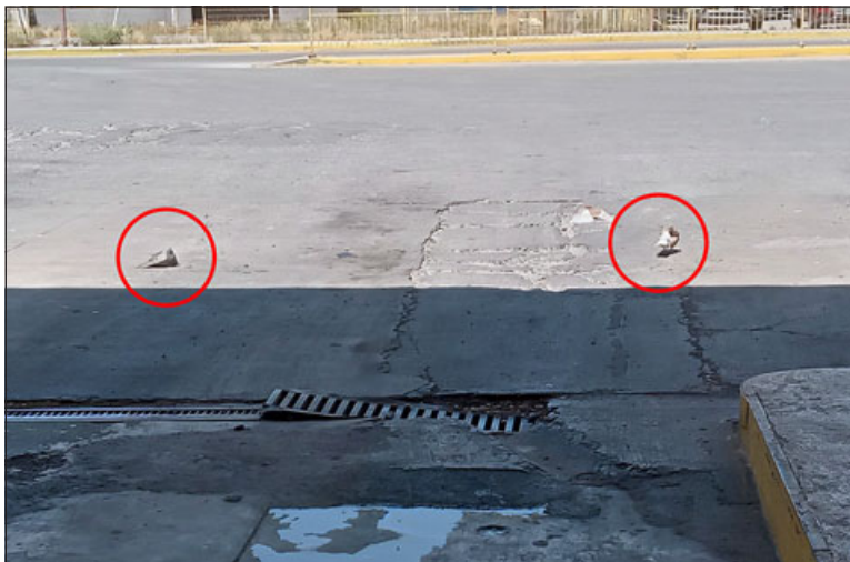
Dos plumíferas en uno de los andenes del terminal de buses de San Felipe.

- Hace 3 años. Es una rejilla con malla que tiene menos de 1 mm y eso es importante porque la paloma es muy flexible, es como un ratón; o sea, se puede meter en cualquier parte donde haya un espacio ella se introduce, y eso nos pasaba anteriormente y era más grave que ahora, por eso te digo que generalmente la gente las alimentan y han aumentado, que se acerquen acá y la gente les tira migas, restos de alimentos, y eso también es malo, pero la gente lo hace en forma de poder alimentar a los animalitos.