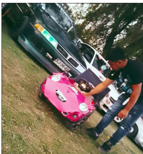
Un mini auto Tuning también presente en este evento.