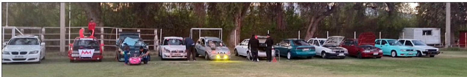
Una panorámica general de los autos participantes en la actividad realizada en el Estadio Ejército Libertador de Curimón.