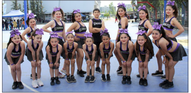
Las integrantes del club 'Gargolas Electric Black'.