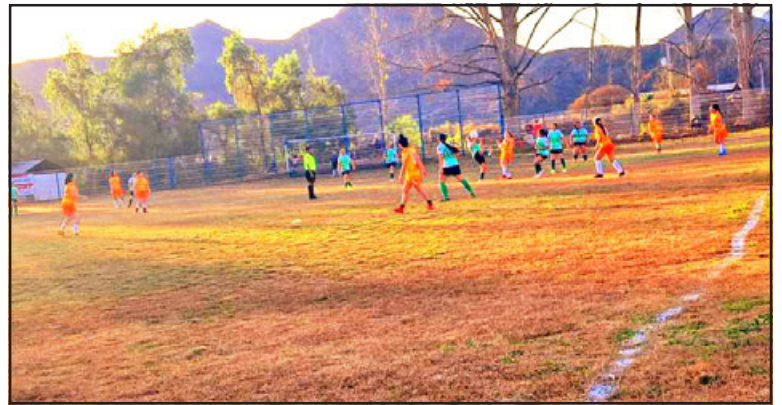
Por ahora el balompié de San Esteban seguirá fuera de los distintos torneos ARFA.

yor apoyo por parte del resto de las asociaciones, incluso las del valle de Aconcagua. Prueba de eso fue que una de las mayores críticas vino precisamente del presidente de una asociación del valle, cosa que ciertamente los descolocó al ver que no existe mayor solidaridad entre sus pares. Los andinos entienden y comprenden esas actitudes, debido a que observan un miedo por parte de esos dirigentes de la