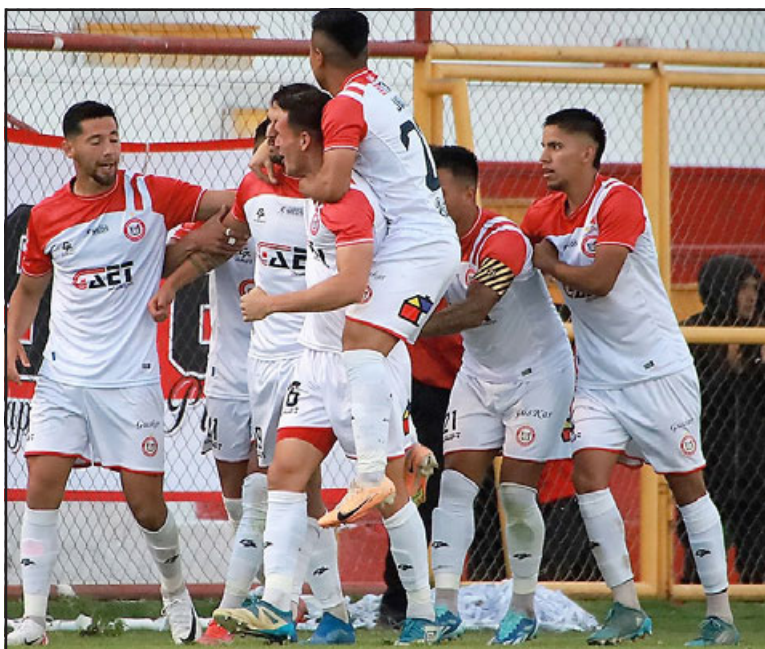
Unión San Felipe tiene buenas chances de seguir en carrera por el segundo cupo a la Primera A.

Para el juego agendado para las siete de la tarde de hoy en el Lucio Fariña de Quillota, Unión San Felipe no podrá contar con el defensa Yerko González y el goleador Mario Briçño , quienes fueron amonestados en el partido anterior.