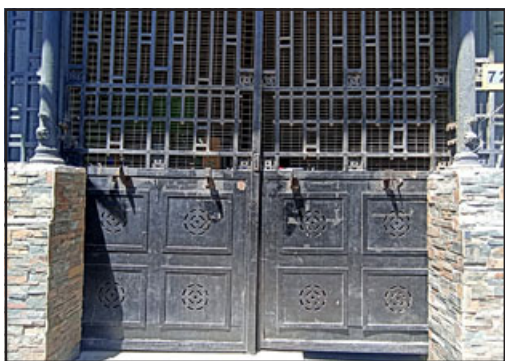
El punto comercial sanfelipeño se mantuvo con cierre indefinido durante tres días y medio.

«Tendríamos que hablar con la municipalidad de cuánto, es más o menos costoso lo que nos salió, cerca de un millón y medio de pesos más o menos, que es entre el hidrojet, el limpiefosas, que estuvieron dos días que se actuó con ellos. A esperar que la municipalidad nos pueda apoyar, ahí tendríamos que ver», concluyó.