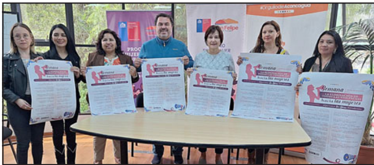
Municipio en compañía de SernamEG, lanzó actividades en el marco de la semana de la NO violencia contra las mujeres.

mos a hacer este trabajo, quisimos que fuera pensado y sentido, visibilizando todos los tipos de violencia. Cada actividad va a reflejar un tipo de violencia, entregando herramientas para salir del círculo de la violencia. Lo que queremos lograr es que la gente sea consciente de que no es sólo la violencia física, existe la violencia psicológica, institucional, el acoso callejero, son diferentes manifestaciones de violencia que vivimos las mujeres a diario», cerró.