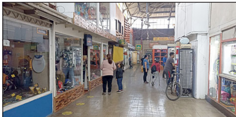
El Mercado Municipal abrió sus puertas a la comunidad pasado el mediodía del lunes, luego de subsanar el colapso de la red interna del alcantarillado.

En cuanto a lo que se señaló la reciente semana, donde el problema se atribuye a grasas y aceites que obstruían el alcantarillado, Gaete estableció que «todas las fuentes de soda y los restaurantes tienen la doble cámara, las revisaron y están todas okey, ya hacen la limpieza cada tres, cuatro días, según corresponde. Está todo okey eso, no hay drama, no sabemos de dónde viene (origen del colapso). Hace tres o cuatro años se hizo ese trabajo afuera (repavimentación Traslaviña) y desde ahí que cada tres o cuatro meses se