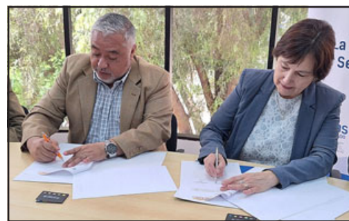
Municipio y el CFT de la PUCV en la firma del acuerdo.

En este sentido, el directivo señaló que este trabajo se enmarca en una política de alcanzar a todos los sectores de la región; «dentro de la misión institucional, es lograr una cobertura regional que vaya más allá de lo que es Valparaíso y Viña del Mar. La región de Valparaíso tiene rincones a los cuales nosotros queremos marcar esa presencia».