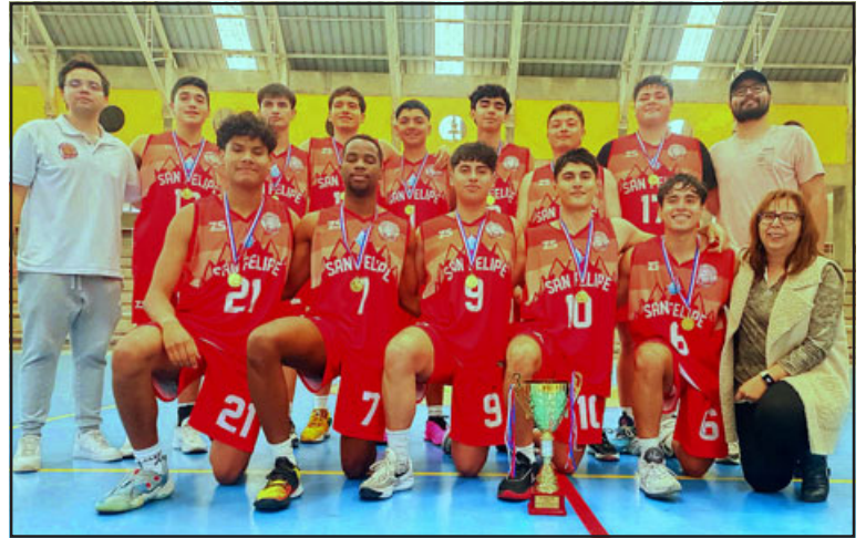
El joven equipo de San Felipe Basket ganó la primera edición de la Copa 'Juan Carlos Acuña'.