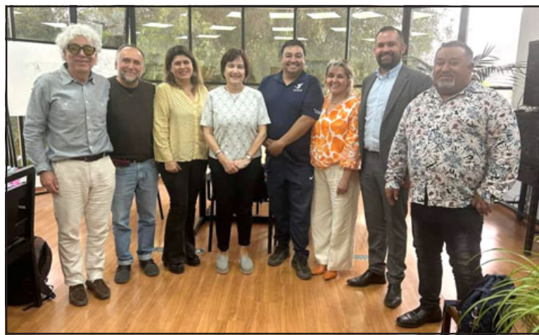
Concejo Municipal aprobó compromiso de compraventa de terreno para comités habitacionales de Curimón.

Ante la consulta de qué trata propiamente tal este compromiso, Castillo