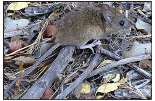
Oligoryzomys longicaudatus o ratón de cola larga de campo, el cual transmite el Virus Hanta.

Respecto a las recomendaciones que se entregan a la