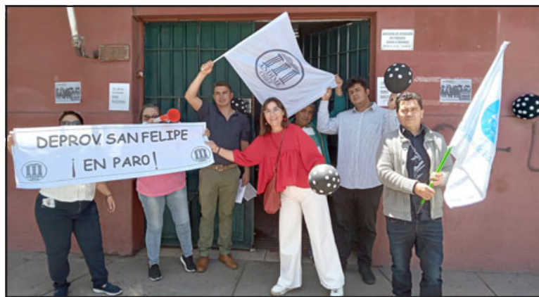
Los funcionarios de la Deprov manifestándose frente a las oficinas.

viajes, giras de estudios, además de eso tenemos un equipo de profesionales, de supervisores, que trabajan en el territorio con los establecimientos, bajando las políticas ministeriales.