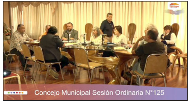
Los concejales en sesión de este martes.