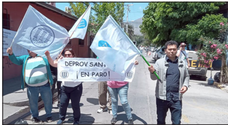
Los funcionarios de la Dirección de Educación Provincial, protestan en el centro de la calzada. En todo caso no hubo corte de tránsito, al contrario, los automovilistas les tocaban la bocina en señal de apoyo.

- Nosotros somos el reflejo territorial del Ministerio de Educación, los que bajamos las políticas ministeriales. Hoy día tenemos oficina 600 que tiene que ver con migrantes, validación de estudios, exámenes libres, denuncias, que por lo tanto no las toman, en este caso no se resuelven en el DAEM. La gente acude a nuestra oficina, acá se ven todos los