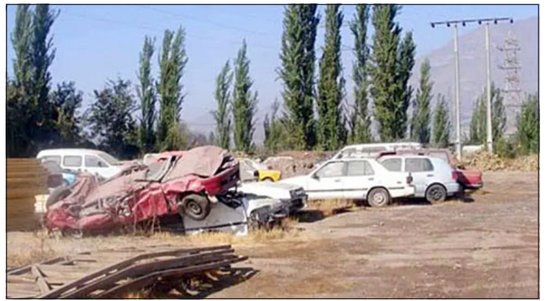
Concejales piden se entregue información por eventuales irregularidades en los corrales municipales.

Asimismo, la situación que motivó dicha solicitud, se registró hace unos días cuando un vecino, que tiene su vehículo en el corral municipal, llegó hasta el edi-