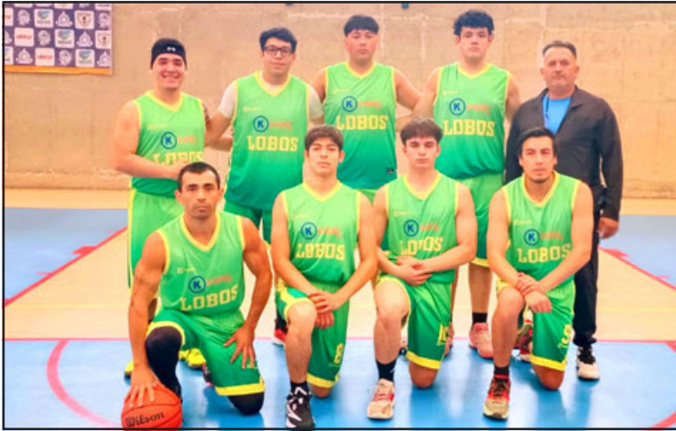
Desde la comuna de Calle Larga, Lobos vino a jugar para homenajear al recordado directivo.