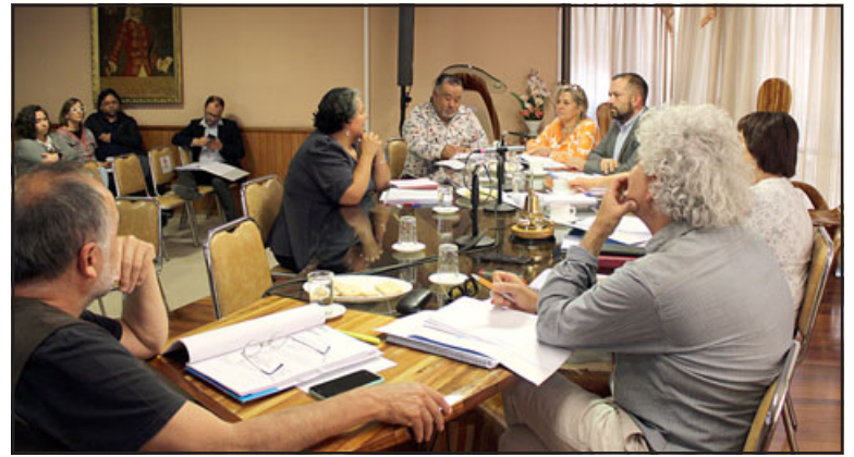
El Concejo Municipal aprobó el Plan de Desarrollo de la Educación Municipal (Padem) 2024.

Por su parte, y en cuanto a la inversión en proyectos de infraestructura para los establecimientos edu-