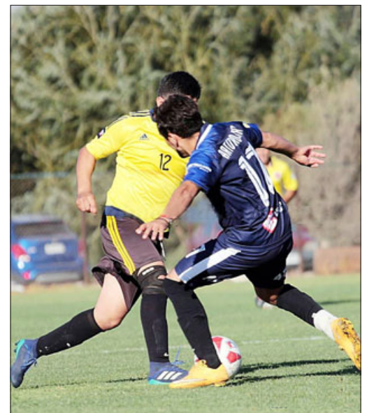
Aun no hay claridad respecto al torneo Afava 2024.