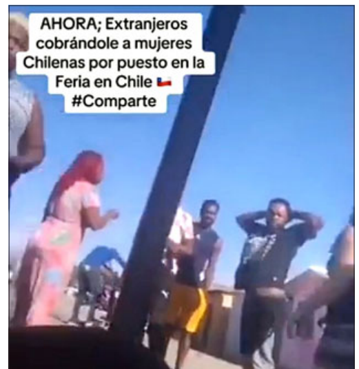
Este es parte del registro que se va viralizado en redes sociales.

Es por esto que, tras una instancia de diálogo, se realizó la labor de ‘copiamiento’ del sector,