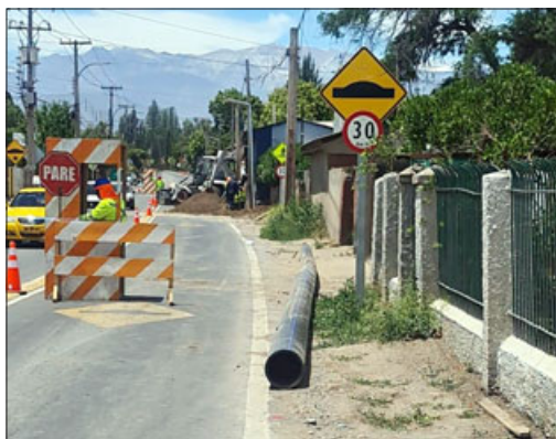
Los trabajos permitirán seguir modernizando la infraestructura sanitaria en esta localidad.

EsvaI estima que, de no presentarse inconvenientes, la renovación de los tramos de Teniente Merino y Nury López, concluyan antes de fin de año. En tanto, los trabajos en Santiago Buevas y Callejón Cifuentes, tienen fecha de término estimada para febrero de 2024.