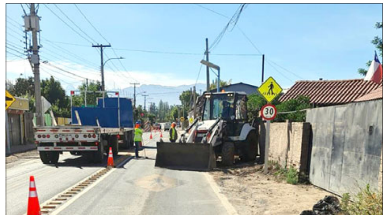
Partió la ejecución de la segunda etapa del proyecto de renovación de redes de agua potable en Curimón, inversión de EsvaI que bordea los $400 millones.

Junto con el recambio de tuberías, la iniciativa considera la