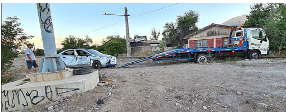
El auto a punto de ser retirado del lugar del accidente.