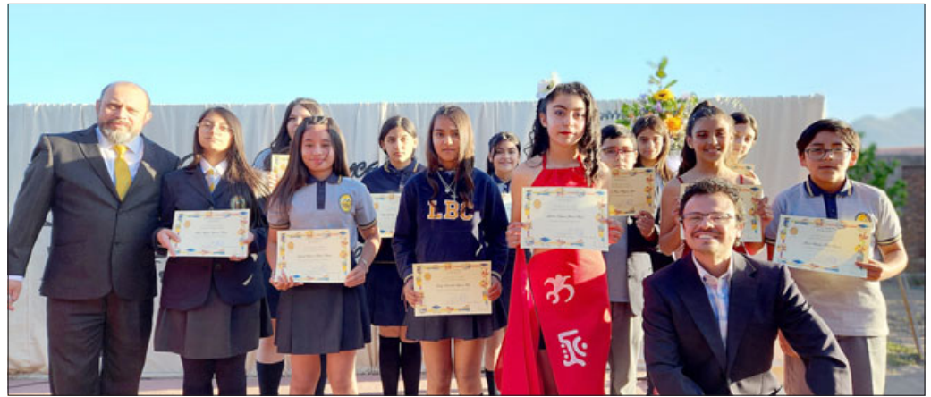
El Liceo Bicentenario Cordillera confirmó la realización del 'Concurso de Dibujo y Pintura Infantil - Juvenil' para el primer semestre de este 2024.

Cabe recalcar que al reverso de la obra se debe indicar el