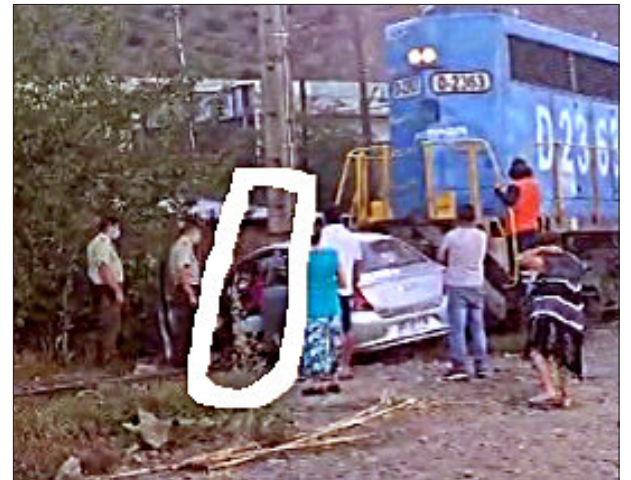
En el círculo el profesor dentro del auto hablando con Carabineros.