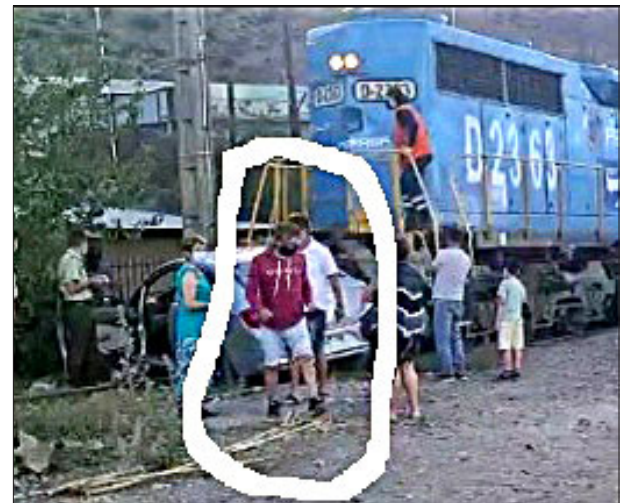
Recién se viene bajando del auto chocado.