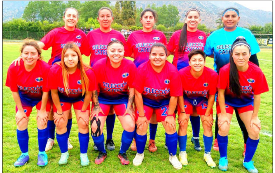
La selección de Catemu no pudo acceder a la fase de semifinales del Regional de mujeres.

De acuerdo a los cuadros, los cruces serán: Puerta del Pacífico – Los Placeres;