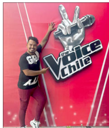
El joven artista aconcagüino también participó en The Voice Chile.

como el festival de Panquehue, Los Vilos, Chile Chico, en Pancahue, en Tomé, festival de la Cecilia. Luego vino mi aparición en ‘The Voice Chile’, así es que la verdad ha sido un año espectacular, no me puedo quejar.