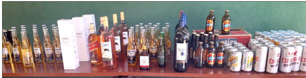
Una gran cantidad de alcohol fue decomisado en operativo en la Toma.