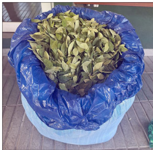
Estas son las hojas de coca incautadas por Carabineros, las cuales en nuestro país son consideradas por la Ley 20.000 como un sicotrópico.

que una de las personas que fue controlada, se encontraba además vendiendo cigarrillos de contrabando, como, asimismo, se logra establecer que mantenían una venta de hojas de coca, la cual en Chile está prohibida, tanto su ingreso como la comercialización, ya que es la materia prima para elevar dro-