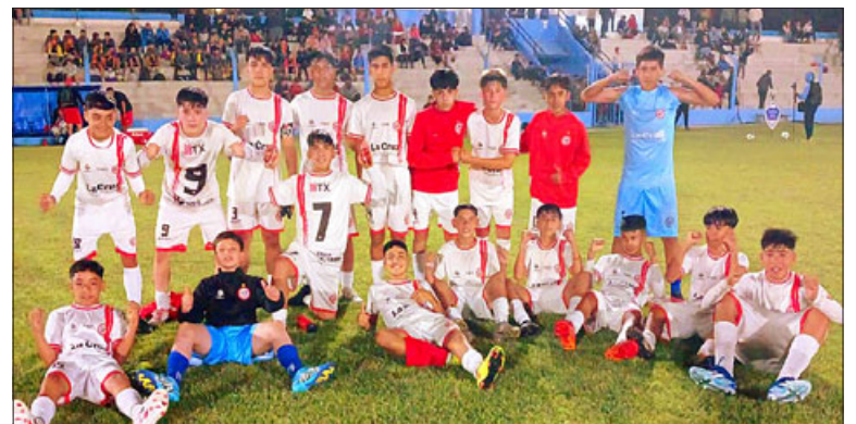
El conjunto Sub-13 de Unión San Felipe tras el debut en la Copa Caí Aimar.

Colo, Sporting, de Córdoba, cagua y Newell's Old Boys. Talleres O'Higgins de Ran-