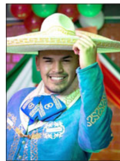
De charro para algunas serenatas que lo contratan.

- Tengo una tienda de calzado en el centro de Llay Llay, donde estamos trabajando ahora y ahí emprendimos, pero mi trabajo a full es el tema de la serenata, velorios, en los cumpleaños, aniversarios