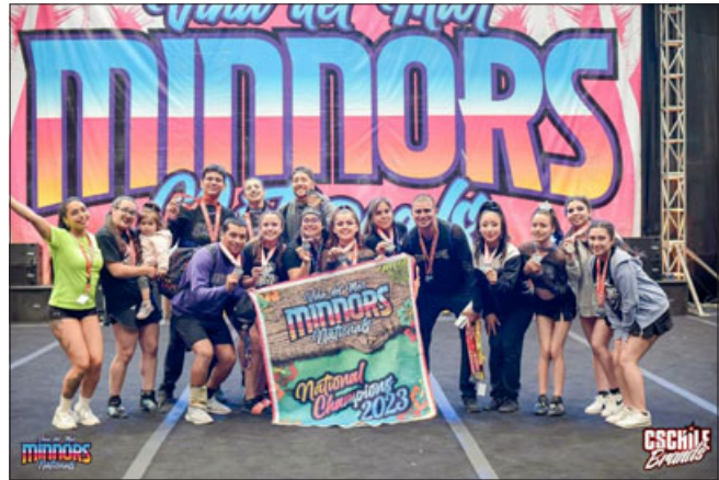
'Black Army' consiguió el primer lugar 'Viña Open Nationals Minnors 2023'.

Por otro lado, no ocultó su emoción por los recientes logros que han obtenido, señalándolos como historia para el Valle del Aconcagua. «Como club estamos ultra felices, venimos haciendo un trabajo de muchos años, comenzamos en San Felipe el año 2007 y por motivos de trabajo yo me trasladé a Los Andes, donde continué con el club depor-