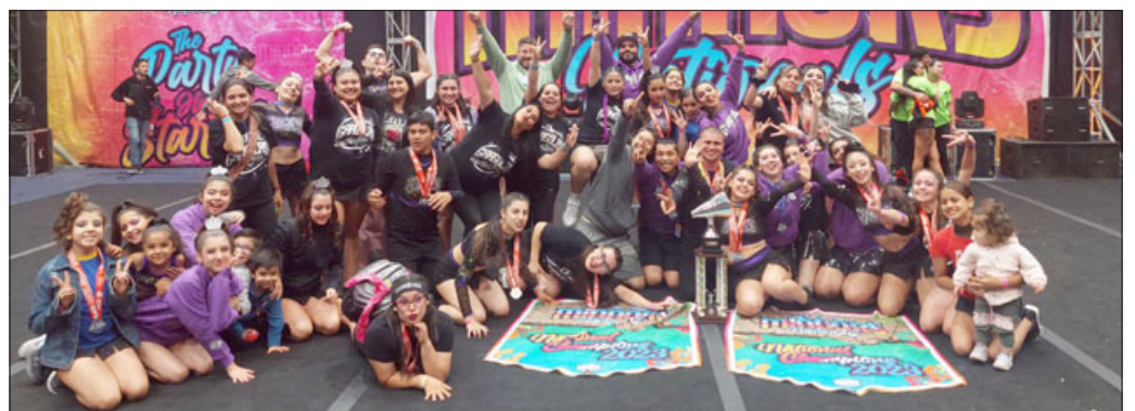
La delegación de deportistas aconcagüinos también se llevó el título de 'Campeón de Campeones'.