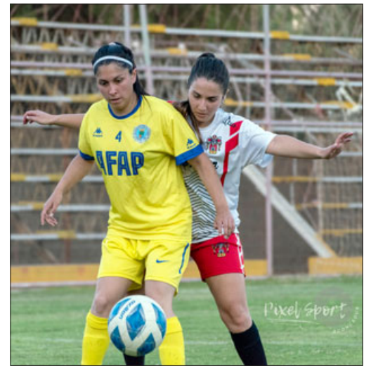
La selección de Putaendo aspira a meterse en la gran final del Regional Femenino.