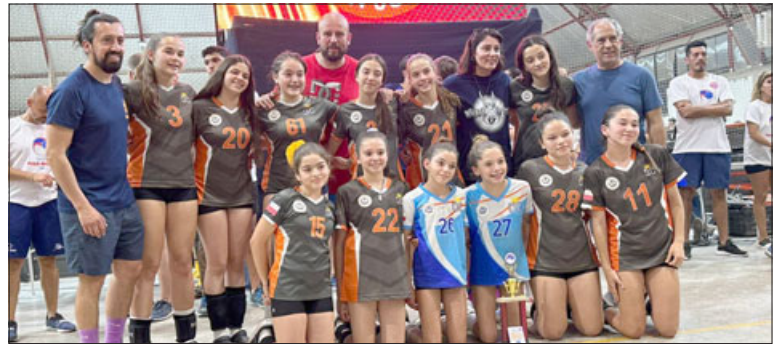
La delegación sub 13 del Colegio Curimón junto a la copa del tercer lugar.

También se refirió al logro que significó su participación en el torneo argentino, así como el gran nivel del vóley sanfelipeño. « Es una oportunidad tremenda para las niñas, primera vez que salíamos al extranjero como colegio, donde si bien el colegio nos dio toda la facilidad de las opciones de ayuda para poder viajar al igual que los apoderados, es súper importante que las niñas puedan tener este tipo de experiencia. Hemos competido a nivel nacional en otras ciudades, generalmente en