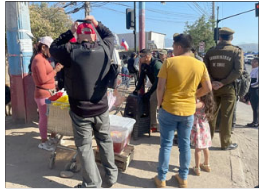
Locatarios de la Feria de Diego de Almagro piden que se intensifiquen las fiscalizaciones.

Es por esto que las locatarias de la Feria de Diego de Almagro piden que se intensifiquen estas fiscalizaciones para «limpiar» la feria, como lo han dicho, «nos acercamos para que haya una coordinación para la fiscalización, creemos que hay recursos, pueden contratar gente externa para que puedan fiscalizar la Feria de Diego de Almagro», cerraron.