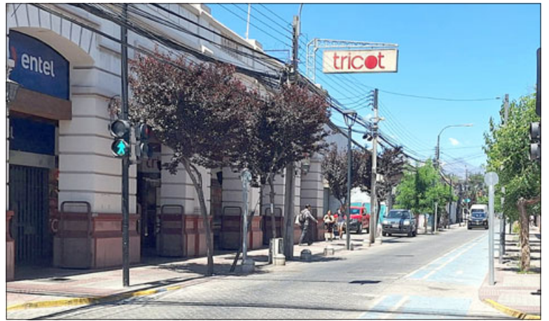
A partir de este viernes habilitarán los ‘boulevares’ en calle Prat, entre Yungay y Portus.

«El cierre de la calle Prat es una realidad que se va a efectuar, va a ser desde el 8 de diciembre, desde