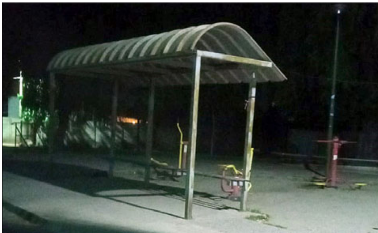
El paradero es un lugar inseguro para quienes esperan movilización a las cinco de la mañana para ir a sus trabajos.