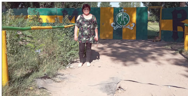
Este puente piden arreglar, porque no resiste mucho peso.