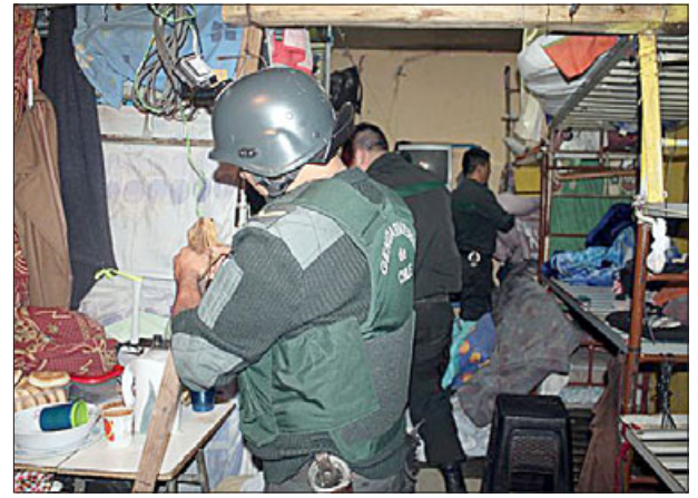
Personal del Centro de Cumplimiento Penitenciario de San Felipe participó en un registro y allanamiento la semana pasada, logrando incautar una serie de elementos prohibidos por la administración penitenciaria.

Tal como ocurre en las jornadas previas a las Fiestas Patrias, Gendarmería intensifica la realización de estos procedi-