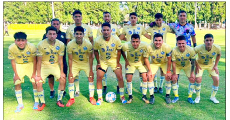
Unión Delicias fue el campeón en la serie de Honor en el torneo de la Asociación de San Felipe.

Con esto, el Campeón General del balompié sanfelipeño es el club Ulises Vera , mientras que