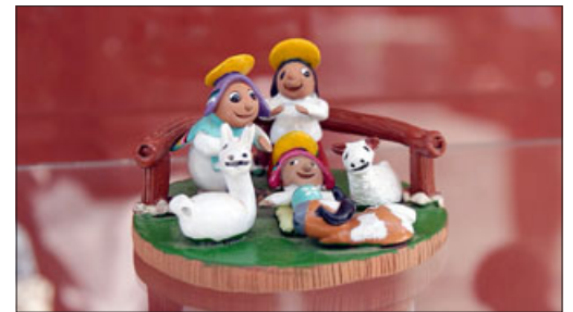
Los pesebres fueron confeccionados de manera artesanal y estarán en exhibición hasta el 30 de diciembre.