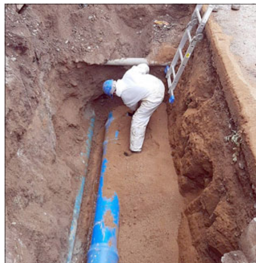
Hoy lunes comienzan obras de construcción del alcantarillo de Tocornal.

Junto con esto, el edil realizó un llamado a la precaución y al tránsito atento debido a los trabajos; «uno de los temas importantes es que cuando se hizo el simulacro, hubo gente que pasaba muy rápido y es peligroso para ellos, para la gente