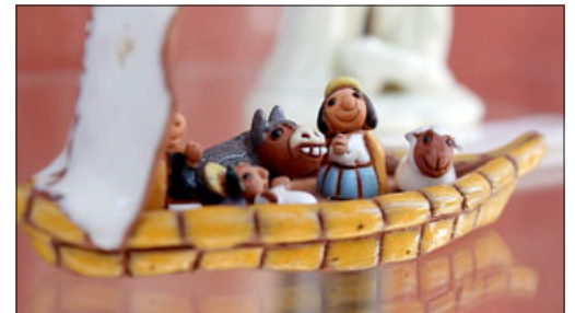
‘Expo Pesebres’ cuenta con más de 100 pesebres de distintas partes del mundo.

Finalmente, la encargada de mediación del museo sanfelipeño invitó a la comunidad respecto a actividades que se desarrollarán el día 15. «También vamos a tener actividades el día 15, así que están cordialmente invitados, nosotros la habíamos desarrollado como parte de la celebración del día de los patrimo-