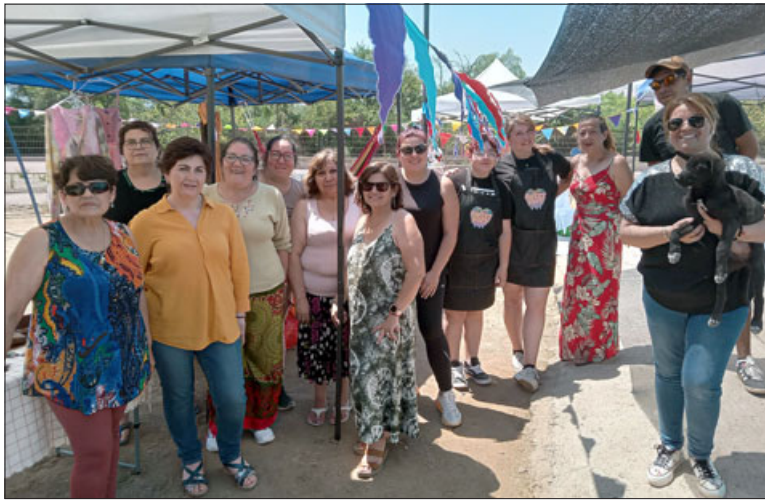
La feria de emprendedores se realizó el pasado viernes 8 de diciembre en la misma villa.