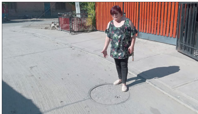
La tapa de cámara que pide que vaya Esvál a limpiar, pues iban cada 3 meses y ahora llevan 6 meses sin ir.