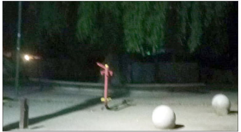
Así de oscura se ve en la noche la plazuela 'Las Tórtolas'.

- Hemos luchado más de 5 años por el alcantarillado, no pasa nada, solamente nos dan píldoras, «que estamos avanzando, que estamos avanzando», pero no pasa nada en el avance, nada, nada. Incluso nosotros tenemos unos bienes comunes (casas que dan vuelta hasta el castillo) de parceleros, yo soy una de las dueñas