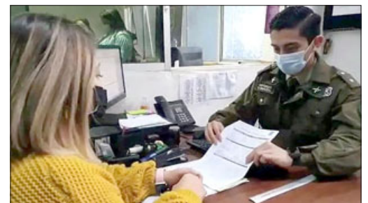
Carabineros habilitará espacio especial para recibir excusas en el plebiscito del 17 de diciembre.

Asimismo, y en el contexto del despliegue policial durante la jornada y los preparativos de seguridad en el exterior de los locales de votación, el comisario sostuvo que «se va a generar un perímetro de seguridad en todos los colegios que han sido nombrados como escurtadores, cuya finalidad es ser una operación activa ha-