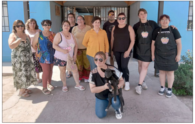
Vecinas y vecinos emprendedores de Villa Bernardo Cruz posando para Diario El Trabajo en el frontis de la sede vecinal.