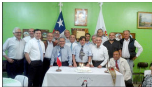
Momento en que los Aucas de San Felipe, Los Andes y Rancagua, junto al Consejo Nacional, entonan el feliz cumpleaños.

La instancia finalizó cuando el presidente Gustavo Canales bajó el banderín y expresó sentirse orgulloso por recibir tal misión, ya que con ello representó a to-