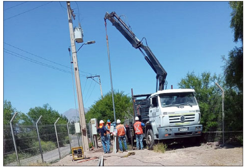
Problema eléctrico generó la última falla del APR de Las Cabras.

sostuvo que «en todas las ocasiones que ha habido problemas, nos hemos hecho presentes como municipalidad porque es un proyecto nuestro y también con la em-