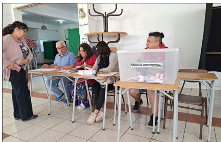
Sin mayores contratiempos y con una gran participación ciudadana se llevó a cabo el proceso de elecciones en la provincia.

Asimismo, Muñoz destacó la apertura de nuevos locales de vo-