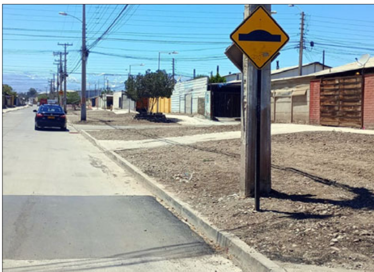
'Lomos de toro' ya han sido instalados en la nueva arteria de la ciudad.

Finalmente, y ante la consulta de la instalación de señalética vial en calle Pedro de Valdivia, Herrera expresó que «la señalética es parte de la obra, se hizo un levantamiento de la señalética pendiente de ejecutar y es la empresa la que tiene que entregar a partir de los tramos que se definan por el municipio».