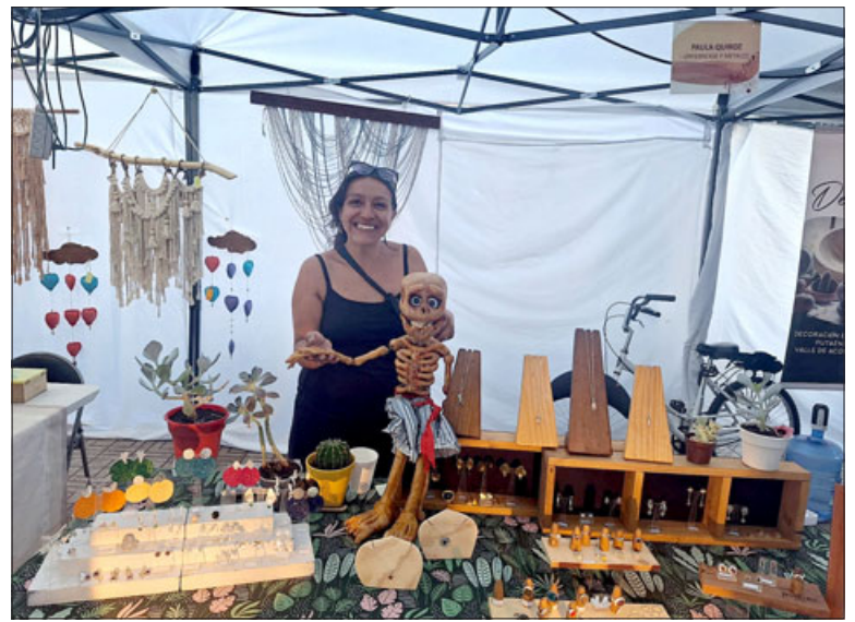
Variadas muestras de artesanía estuvieron presentes en San Felipe.

A su vez, señaló que la actividad tuvo como objetivo celebrar, aunque un poco atrasados, el pasado Día Nacional de Artesanos y Artesanos en nuestro país, y los problemas que han tenido al vi-