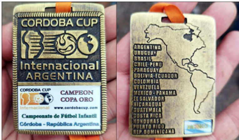
La medalla del primer lugar. Al reverso todos los países participantes.