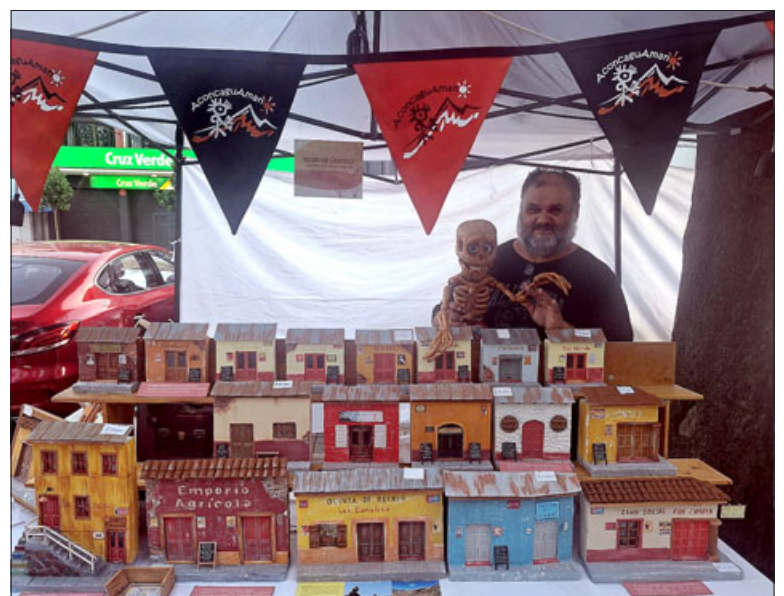
La iniciativa se desarrolló viernes, sábado y domingo.