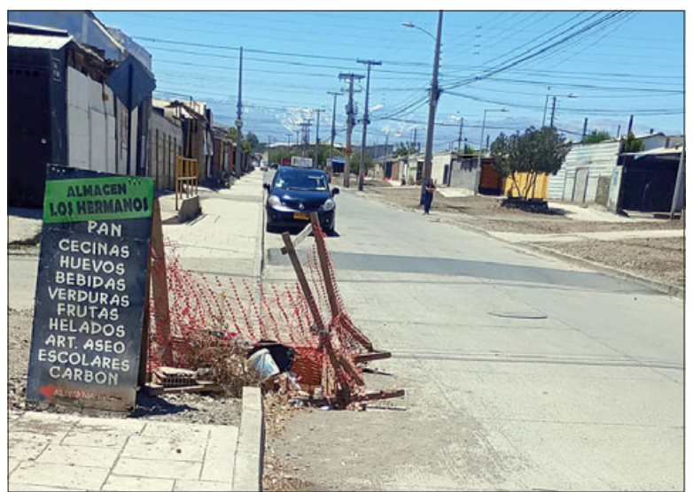
Estado actual de parte de la nueva calle Pedro de Valdivia.