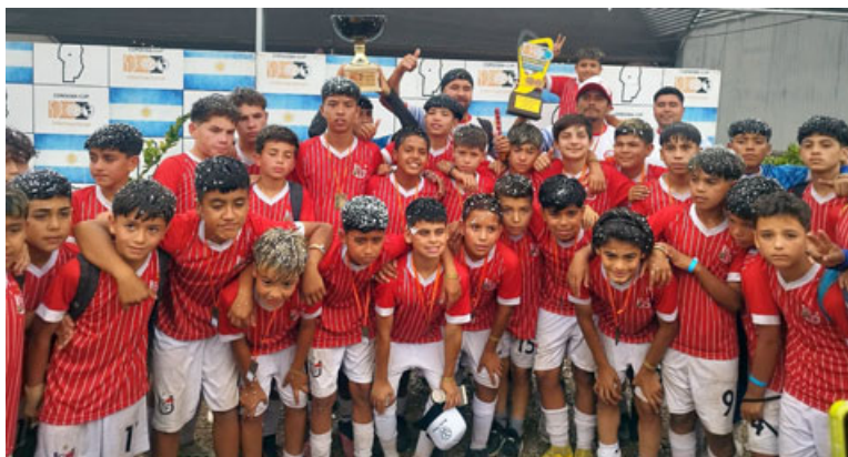
Los jugadores de series inferiores de Unión San Felipe, tras participar en la Córdoba Cup versión 32.