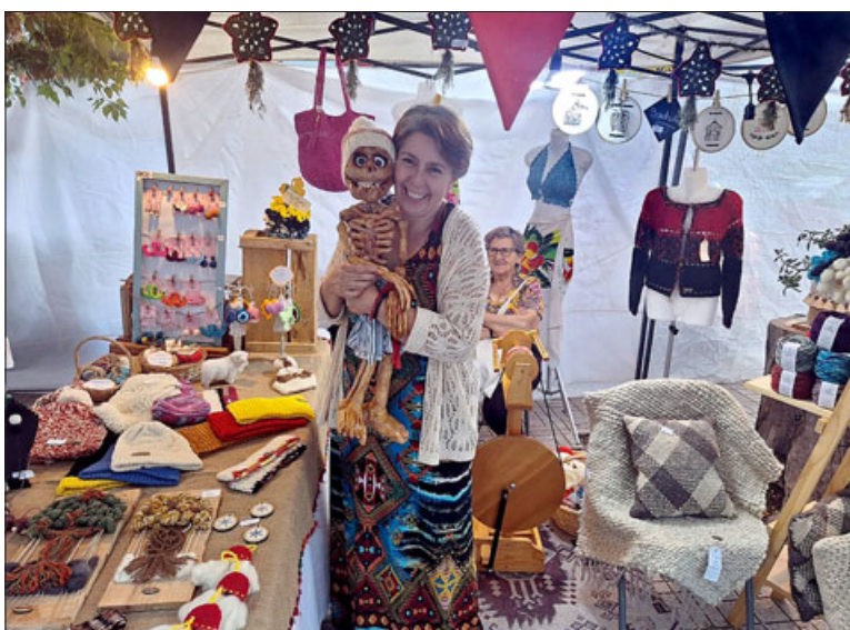
Más de 15 artesanos mostraron sus oficios en la Segunda Muestra de Artesanía.

Finalmente, Sánchez destacó la variada labor de los artesanos y la selección que deben realizar para este tipo de actividades. «Todos los artesanos tienen un estilo diferente al otro, ningún trabajo se va a parecer el otro, entonces, todos los artesanos son diferentes y en eso tratamos de hacer las selecciones lamentablemente, porque nosotros quisiéramos que todos los artesanos estuvieran, pero hay una selección», cerró.