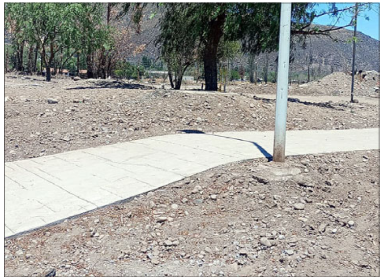
Así lucen actualmente parte de las áreas verdes del sector.

Asimismo, y ante el hecho de eventuales deudas con otras empresas, Herrera señaló que «respecto de que existan deudas con otras empresas, recién hoy hemos tomado conocimientos de que existiría una deuda con la empresa de áridos, pero no de la empresa que ejecuta las obras, sino que de otra empresa, por lo que hemos solicitado al mandante que nos esclarezca esta situa-