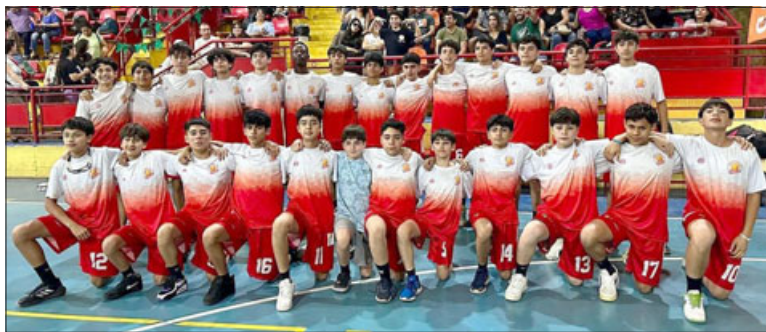
San Felipe Basket será el anfitrión en el 'Promesas de Chile'.

ORACIÓN A SAN JUDAS TADEO. - Patrón de los casos difíciles, ¡oh, gloriosísimo Apóstol San Judas Tadeo! Siervo fiel y amigo de Jesús, con el nombre del traidor que entregó a nuestro querido Maestro en manos de sus enemigos; ésta ha sido la causa de que muchos os hayan olvidado, pero la Iglesia os honra e invoca universalmente como patrón de los casos difíciles y desesperados. Rogad por mí, que soy tan miserable y haced uso, os ruego, de ese privilegio especial a vos concedido de socorrer visible y prontamente cuando casi se ha perdido toda esperanza. Venid en mi ayuda en esta gran necesidad para que reciba los consuelos y socorros del cielo en todas mis necesidades, tribulaciones y sufrimientos, particularmente (haga aquí la súplica que desee obtener, con fe y devoción, y repita esta oración durante 9 días, prometiendo publicarla en el 8º día y por difícil e imposible, se le concederá). Y para que bendiga a Dios con vos y con todos los escogidos por toda la eternidad. Amén