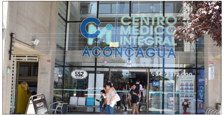
Este lunes se dio a conocer el convenio entre Fonasa y el Centro Médico 'Integral Aconcagua', ubicado en calle Merced N°552.

A su vez, abordó el auge de usuarios de Fonasa en relación a las Instituciones de Salud Previsional y la mantención de venta de bonos vía internet, entregando algunos datos de lo que es la atención en nuestra comuna. «Nosotros estamos siempre reforzando nuestros canales de atención, tanto los presenciales a través de estos convenios, a través de nuestra sucursal, pero también de las atenciones re-