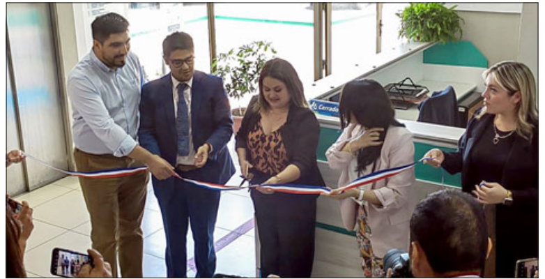
Autoridades y usuarios de Fonasa cortaron la cinta e inauguraron el punto de venta de bonos y programas médicos.