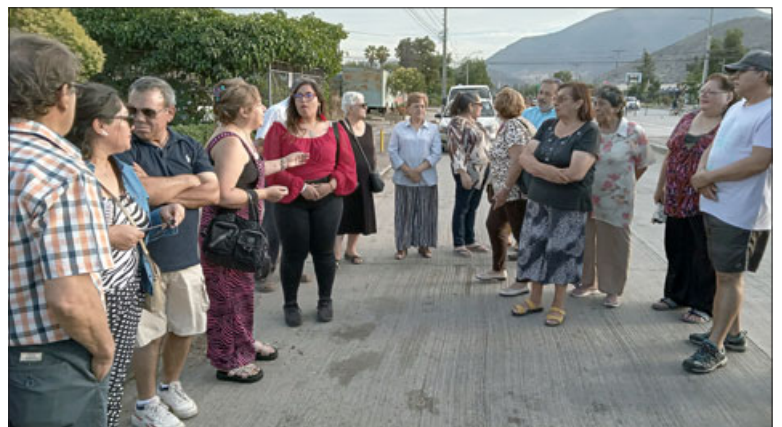
Una vecina habla con todos planteando su punto de vista.

- No, aquí no podemos contar, tratamos de ubicar para que viniera Carabineros para ayudar a ordenar el día domingo, no tampoco... tampoco.