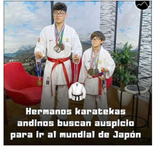
Hermanos karatecas andinos buscan auspicio para ir al mundial de Japón

A su vez, se refirió a la gran expectativa que se tiene con esta actividad, sobre todo pensando en el suculento premio que existe de por medio, ade-