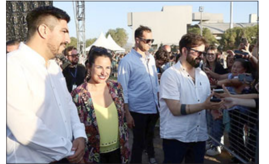
Con la presencia de autoridades locales y regionales se llevó a cabo la visita del mandatario a la comuna del viento.