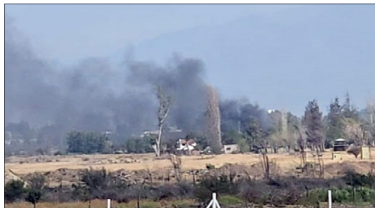
El humo y el fuego eran visibles a varios metros del lugar.

En este contexto, Herrera agregó que «a la llegada del primer carro, se pudo percibir que era una casa de material ligero. Afor-