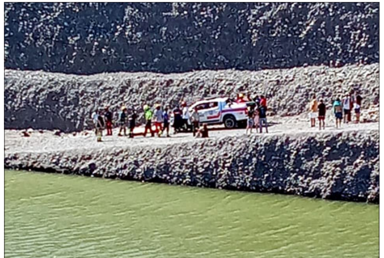
Personal de Carabineros y de Bomberos en el lugar de la tragedia que costó la vida a un joven de 25 años de nacionalidad venezolana.