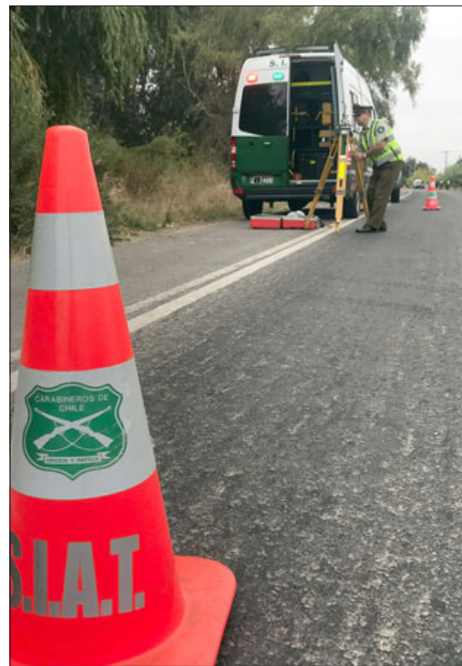
SIAT de Carabineros investiga las causas que provocaron el accidente donde falleció un joven de 22 años.

Asimismo, y respecto de las causas, el jefe de la SIAT de Aconcagua sostuvo que se está a la espera de los resultados de los últimos informes para entregar la información al Ministerio Público.