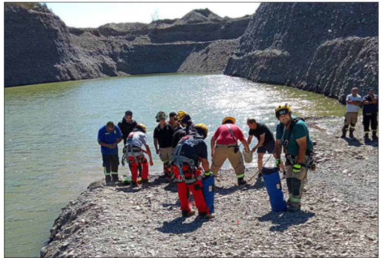
Voluntarios de Bomberos presentes en el lugar, quienes participaron del rescate del cuerpo que fue hallado a 7 metros de profundidad.