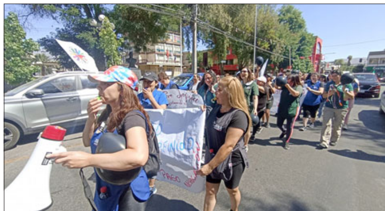
Marcharon por el damero central de la comuna, exigiendo al Gobierno el pago del bono de término de conflicto, reajuste y aguinaldos.