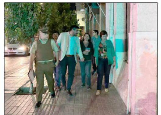
Autoridades y Carabineros recorrieron diversos puntos del damero central de nuestra comuna.