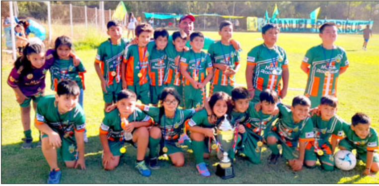
Las series infantiles del Club Manuel Rodríguez se hicieron del protagonismo en el torneo sanfelipeño.