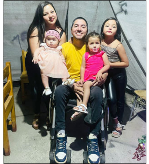
El Tabo Afcrew, junto a su familia compuesta por su esposa y tres hijas.

- No, nada, creo que ahora en febrero hay doctores que van a hacer una junta para ver un medi-