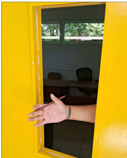
Hasta los vidrios de las puertas han roto para poder ingresar.