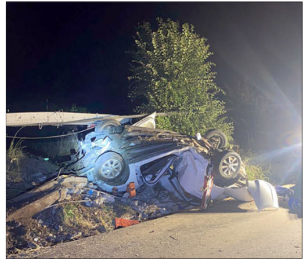
Una mujer (y no dos, como se informó inicialmente) falleció en el trágico accidente en Santa María.