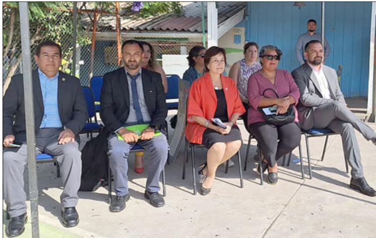
Alcaldesa dio a conocer los proyectos para dos establecimientos educacionales.

pertenece a la localidad y hemos recibido el apoyo de los apoderados, estamos con ganas de seguir trabajando, las mejoras que se vienen en la escuela están acompañadas de otras mejoras en lo educativo, didáctico y pedagógico que hemos ido abordando en las necesidades de la escuela, por lo tanto, finalizamos un año felices por lo que se ha hecho y felices por las mejoras en la escuela».