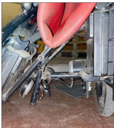
Acá abajo el desperfecto de la silla que la dejó inutilizable.