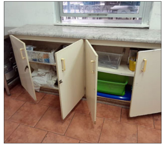
Muebles vacíos dejaron los delincuentes.

Quinto robo que ya ha generado pérdidas millonarias en el establecimiento, «hasta el momento con todo lo que nos han robado vamos cerca de los 2 millo-