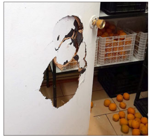
Este es el daño y destrucción que han generado en la escuela.