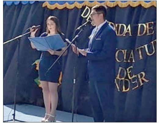
Escuela Heriberto Bermúdez de El Asiento celebró su ceremonia de egreso de estudiantes.