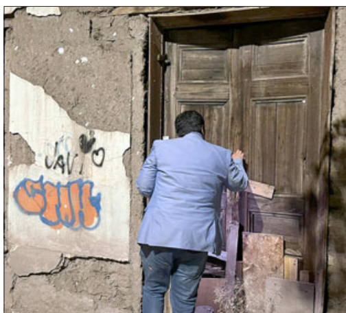
Viviendas abandonadas y en mal estado se pudieron constatar en la ronda nocturna.