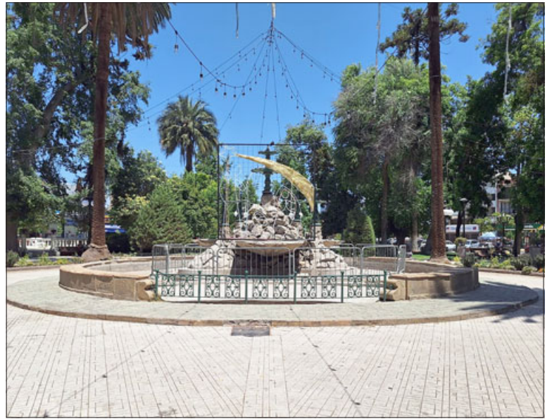
Municipio trabaja en proyectos para el mejoramiento de la Plaza de Armas de San Felipe.