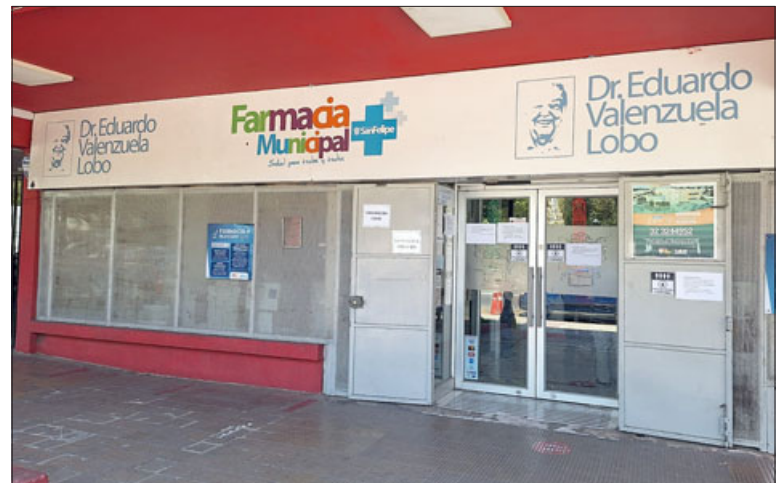
Sólo por este viernes, farmacia municipal y el vacunatorio que funciona en ésta, no atenderán público.

Asimismo, y en cuanto al no funcionamiento de la farmacia y el vacunatorio sólo por este día viernes, la directora del Cesfam explicó que «la farmacia continúa tal cual, a excepción de este viernes 5 de enero, que tendremos que momentáneamente cerrar nuestra far-