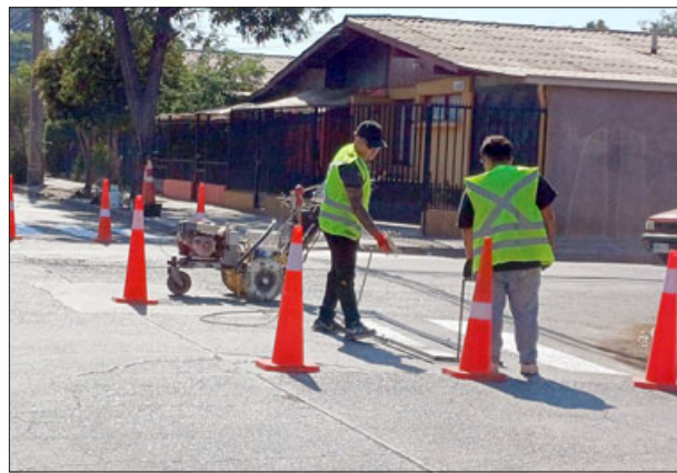
Personal municipal pintando el paso de cebra.