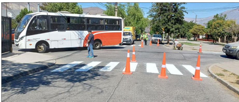
El paso cebra listo, recién pintado, hasta cambia por completo la estética del sector.

montón de veces, ellos decían que el puente no resiste peso, pero antes del puente puede ser, o que coloquemos dos lomos de toro, uno a cada lado para disminuir las velocidades cuando uno quiere cruzar. Se hizo un paso cebra que cuando estaban rayando ahí, hasta le pegaron a un pintor de estos niños que trabajan en la muni, reclamaban estos compadres ‘choros’ que cómo se les ocurría, la hora en que están pintando, que tenían cortado el tránsito. O sea, si tú trabajas en el día se molestan, si lo haces en la noche también porque « son sinvergüenzas, están trabajando para hacer sobretiempos, para poder ganar más plata ». Entonces estamos pidiendo lomos de toro antes o el semáforo antes del puente si no hay problema.