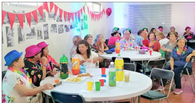
Los adultos mayores gozan con las actividades para ellos, razón por la que se implementarán talleres de verano por primera vez.

abordarán los talleres y el número de asistentes totales que esperan. «Entre comillas son talleres un poco expres, porque la idea es que puedan llevarse a cabo durante los meses de enero y febrero. Tenemos ‘Folclor’, ‘Baile’, ‘Repostería de Verano’, ‘Deportes’, ‘Prácticas Teatrales’, ‘Envejecimiento Activo y Sexualidad en Adultos Mayores’, que es algo nuevo y súper importante de poder relevar. También está ‘Vellón Agujado’ y ‘Souvenir’, entonces, la idea es que sean talleres que se pueden ejecutar dentro de estos dos