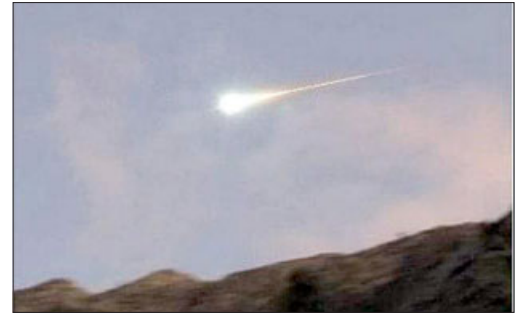
Supuesto meteorito captado en sector Las Vizcachas, Camino Internacional, el sábado 30 de diciembre 2023, alrededor de las 19:50 horas.

De acuerdo a National Geographic , los meteoritos son objetos espaciales, y su tamaño varía entre granos de polvo hasta varios